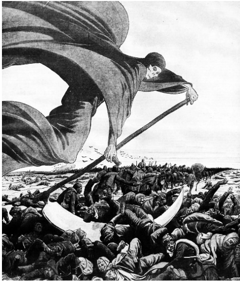
Kolera, Birinci Balkan Savaşı'nda Osmanlı askerlerini katlediyor (1912-1913), Le Petit Journal , 01.12.1912