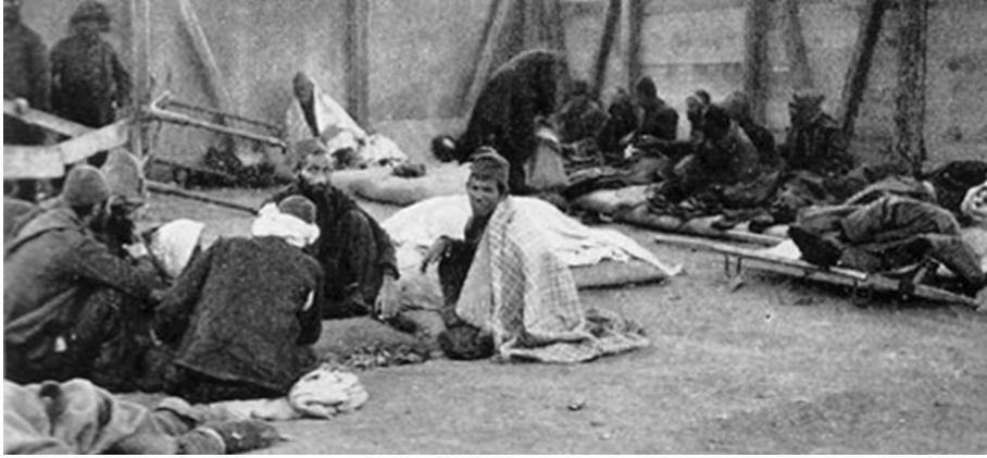
İstanbul'a gelen muhacir ve askerler şehirde koleraı daha da yaygınlaştırmıştı.

hastane haline getirilmiştir. Kış mevsiminin bastırması ve koleraın artması sebebiyle barakalar çadırlardan ayrılarak çadırlara yaralı ve hastalar yerleştirilmiştir.