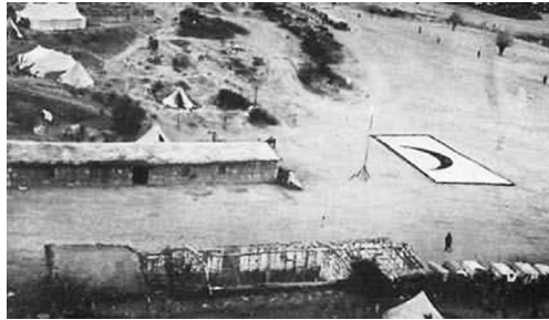
Bir seyyar hastane

Rumeli'den başlayan göç sırasında muhacirlerin geçtiği yollar üzerinde kolera ölen o kadar çok insan vardı ki hastalar sağlık kurallarına fazla dikkat edilmeden defnedilmek zorunda kalıyordu. Mezarların üzerine bile yeterince kireç atılmıyordu. 44 Bu koşullarda muhacirlerin hasta olmaması imkânsız gibiydi. Çerkesköy'den gelen muhacirlerde ve yaralı askerler arasında kolera'nın yanı sıra dizanteri vakalarına da rastlanmıştır. 45