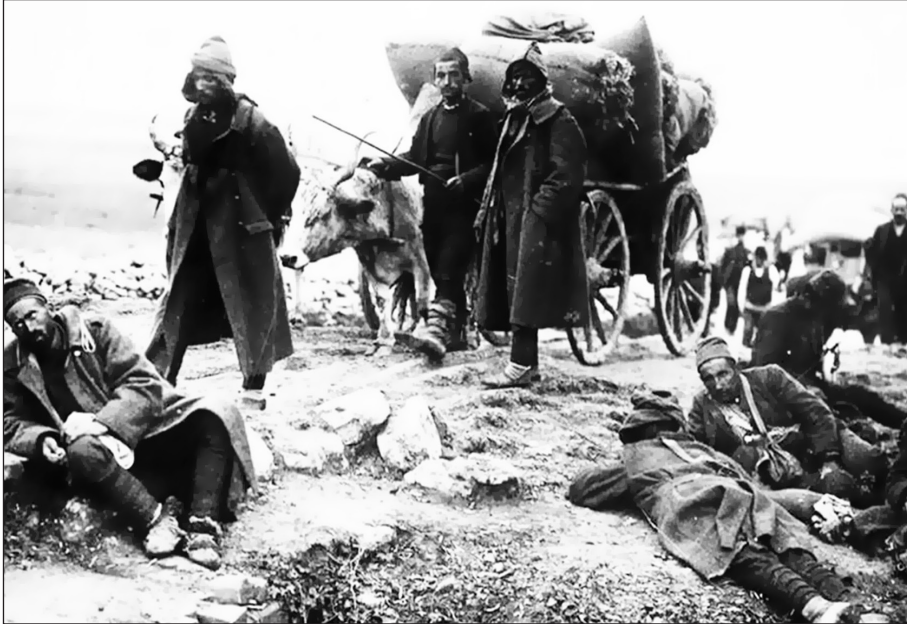
Gerri dönüş yolunda koleradan ölen ve yol kenarlarında hasta ve yorgun Osmanlı askerleri

Üstelik salgın yüzünden başta doktorlar olmak üzere diğer sağlık personeli de etkilenip ölüyordu. Asıl büyük tehlike İstanbul'un da tehdit altında olmasıydı.