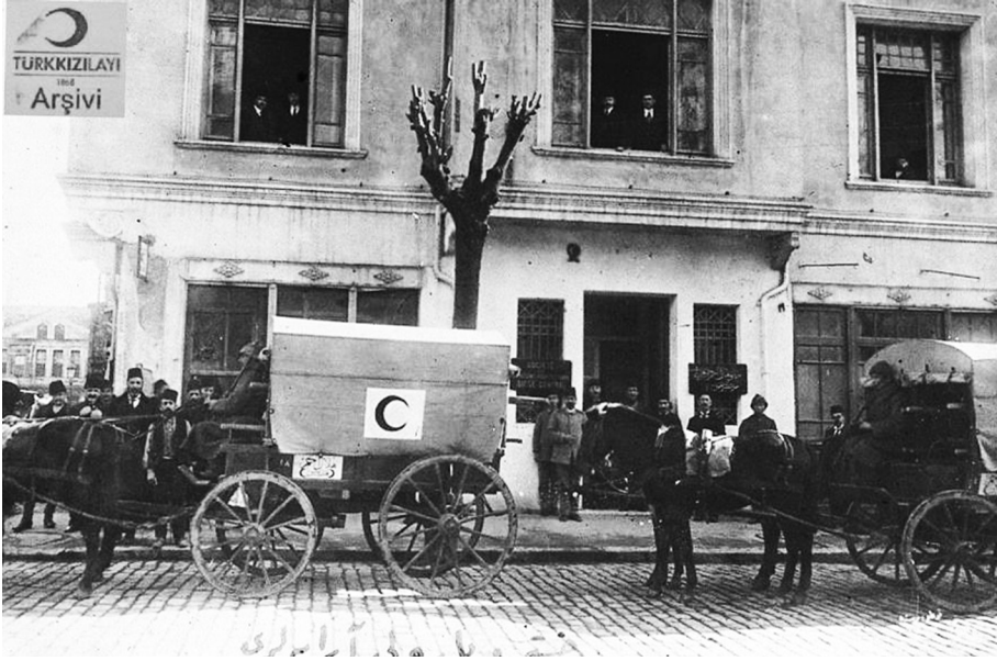
Hasta ve yaralı arabaları ile Hilâl-i Ahmer Cemiyeti'nin Sıhhiye-i Askeriye'ye yardımı

Tekirdağ ve çevresinden getirilen yaralı ve koleralılar ise, Şehremaneti tarafından Maltepe Hastanesi'ne nakledilse de ciddi bir sağlık tehlikesi olduğu için sevk edildikleri yerlerde kurulan seyyar çadırlarda tedavi edilmiştir. Çatalca hattındaki askerin morali yerinde olsa da erzak ve levazımata süratle sevki, orduda kolera hastalığının ortadan kaldırılması için mahalline bir heyet gönderilmesi, toplanan askerlerin noksanlarının teftişi ve sevkiyatın idaresi için askeri ve mülki makamlardan oluşan bir komisyon teşkil edildi. 37