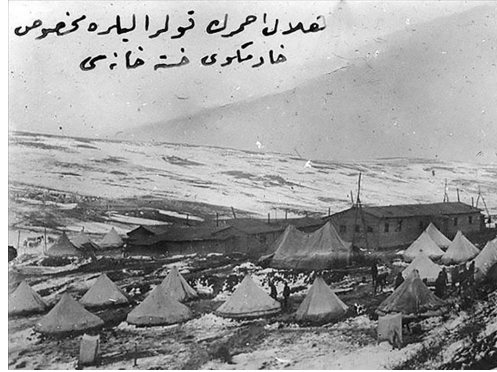
Hilâ-i Ahmer'in kolerallılara mahsus Hadimköyü Hastanesi

Bu tedbirlerden birisi ise hastaların tamamen izole edilmesi idi. Nitekim koleranın hızlı bir şekilde yayılma eğilimi göstermesi üzerine Harbiye Nezareti, Trakya ve İstanbul'da görülen kolerallıların sayısının gittikçe arttığını tespit etmiş ve adalardan birinin boşaltılarak kolerallıların orada tedavi ve bakımalarının uygun olacağını düşünmüştü. 22