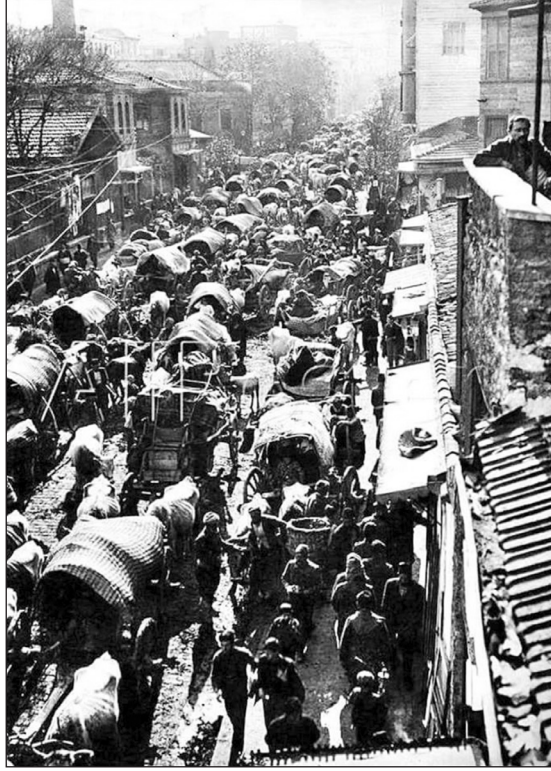
Balkan muhacirleri İstanbul sokaklarında

köy bölgesindeki on binlerce kişiyi etkilemiştir. 4 Dolayısıyla binlerce hastanın bulunduğu askeri çadırların tümü söndürülmüş, kireç tozu ile dezenfekte edilmeye çalışılmıştır. 5