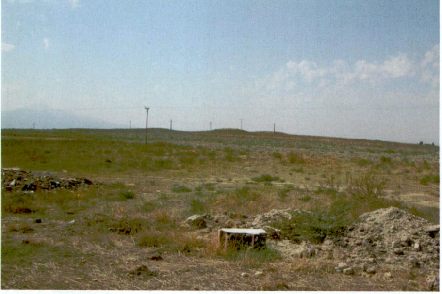
Resim 1: Üçhöyük (Bolvadin Höyük)