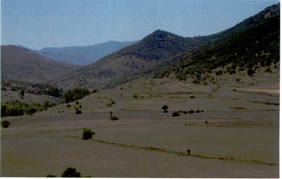
Resim 2: Tekdeğirmen Mevkii