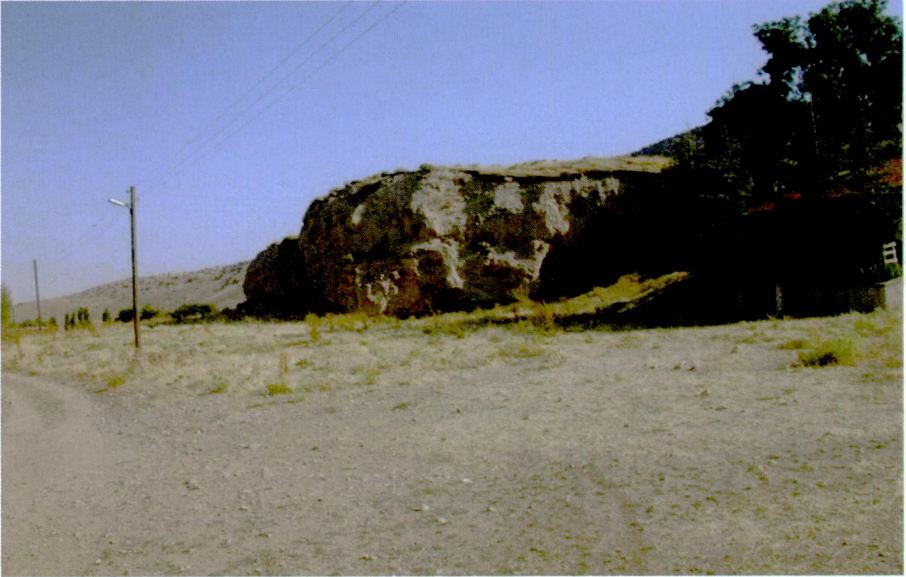
Resim 4: Bağlıca Höyük