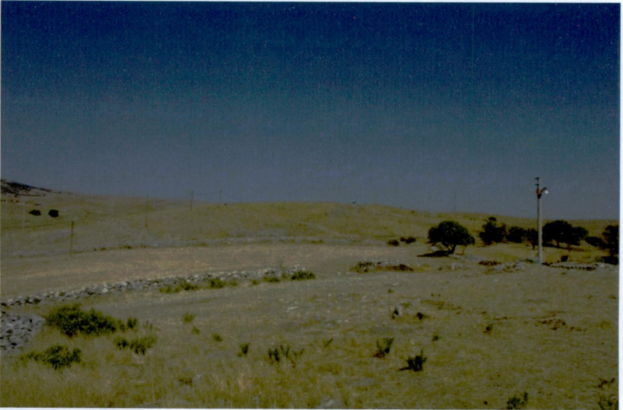
Resim 6: Akçaşar Höyük