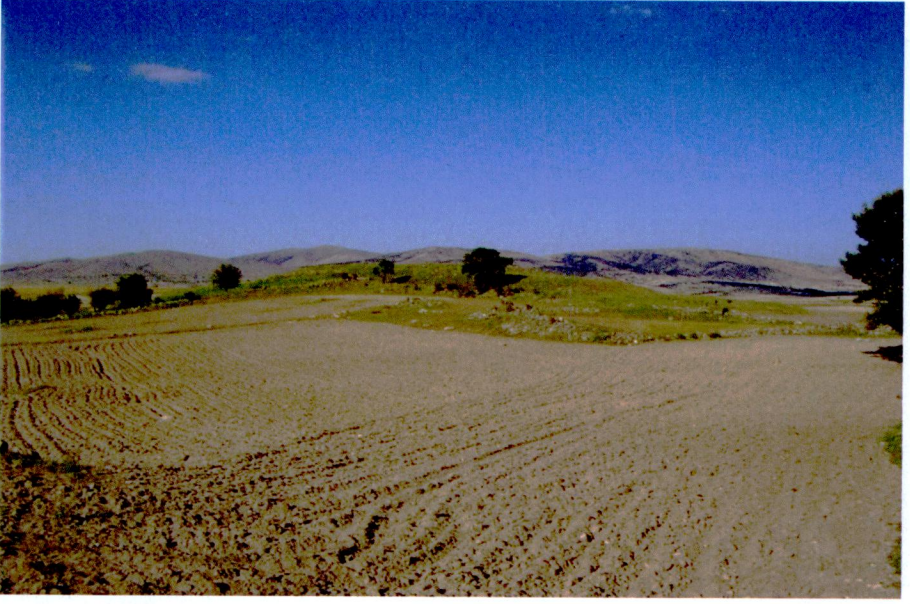
Resim 11: Ahaların Çeşme