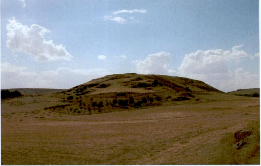
Resim 9: Köy Kalesi