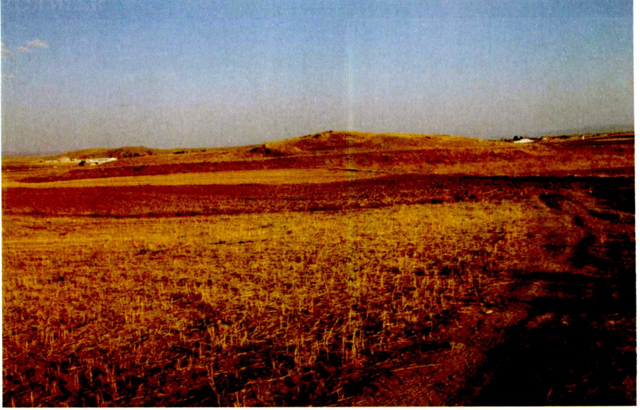
Resim 13: alıřlar Hyk