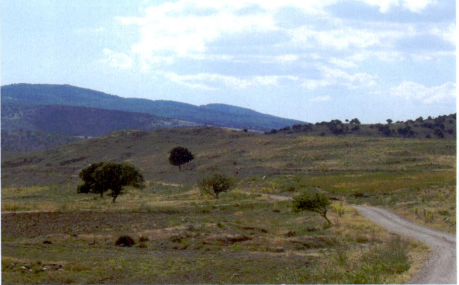
Resim 10: Asarcık Höyü