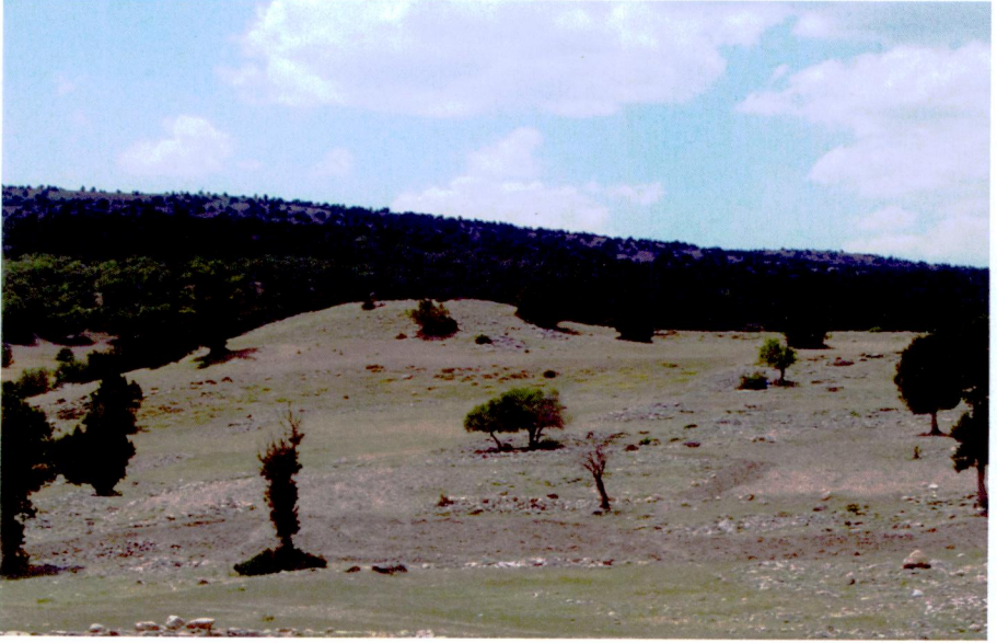
Resim 12: Muratkoru Höyük