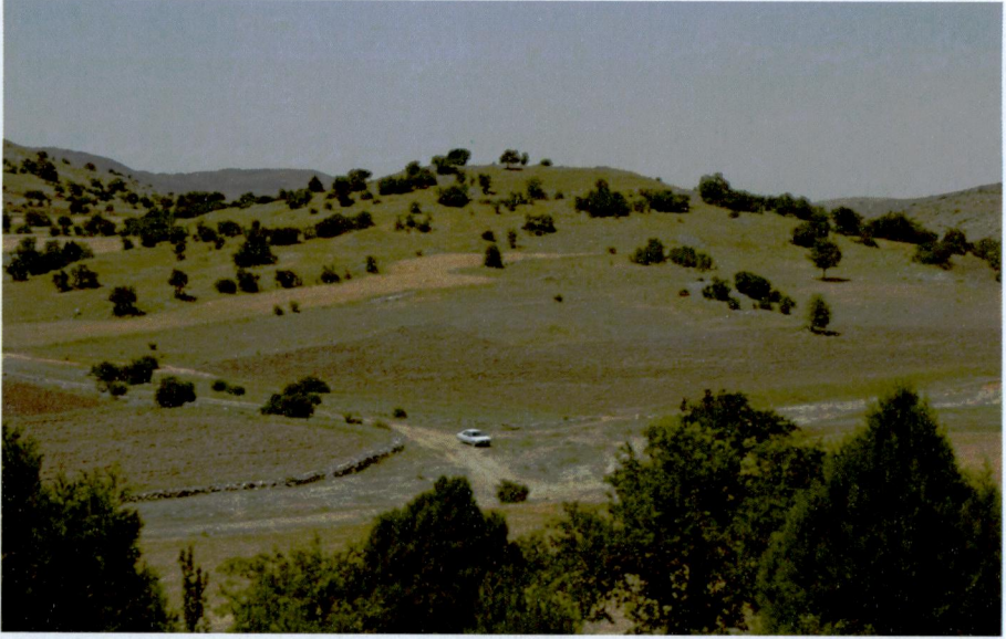
Resim 5: Kırkel Mevkii