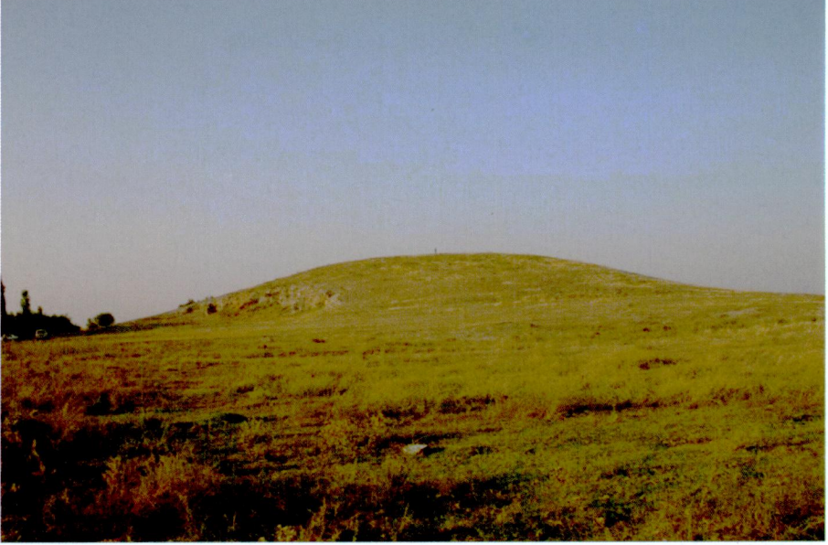
Resim 3: Çayır Höyük