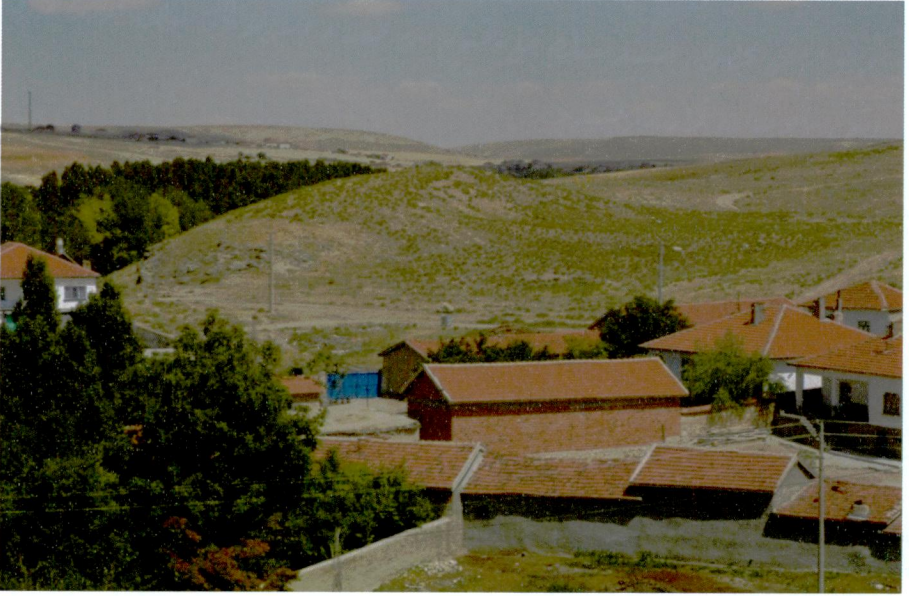
Resim 8: Aşağıpiribeyli-İnli Höyük