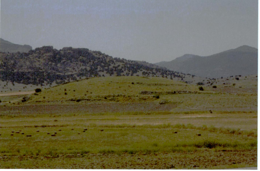
Resim 7: Tezköy Höyük