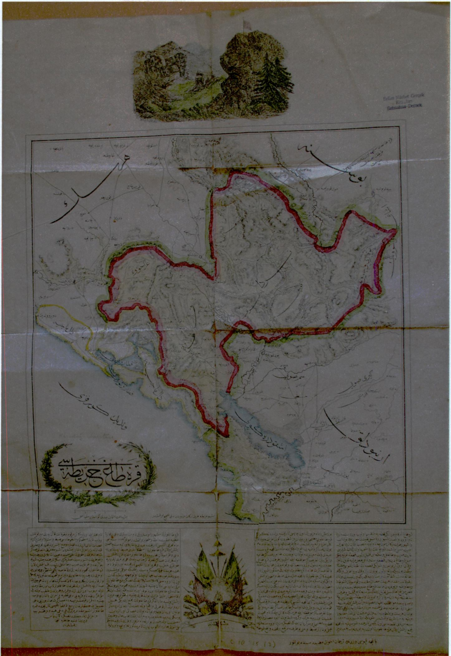
Harita 2: 1862 Karadağ Harekâtını anlatan Karadağ Haritası.