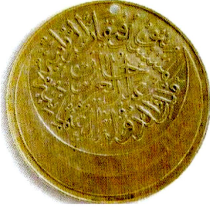
Resim 16: Karadağ Madalyası. Ön Yüz. Kaynak: Eldem, a.g.e. , s. 247.