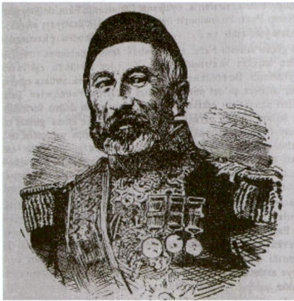
Resim 2: Bosna Ordu Komutanı Derviş Paşa.