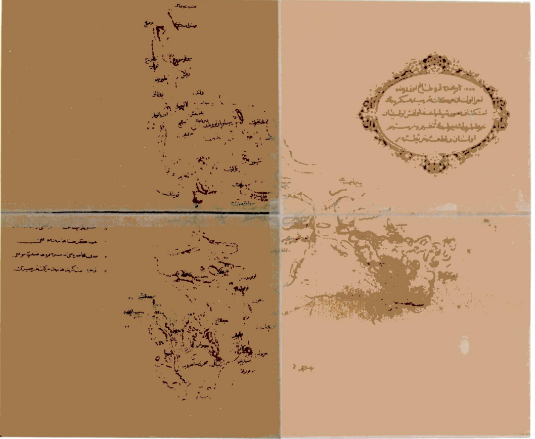
Harita 1: 1862 Karadağ Seferi'nde Askeri Hareketliliğe Sahne olan yerler (Detay). Erkân-ı Harbiye Dâiresi, 1291, Kaynak: Milli Kütüphane: HRT 1994 D 1851 , Demirbaş No: 2961.