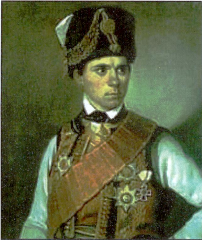
Resim 6: Danilo (1852-1860).