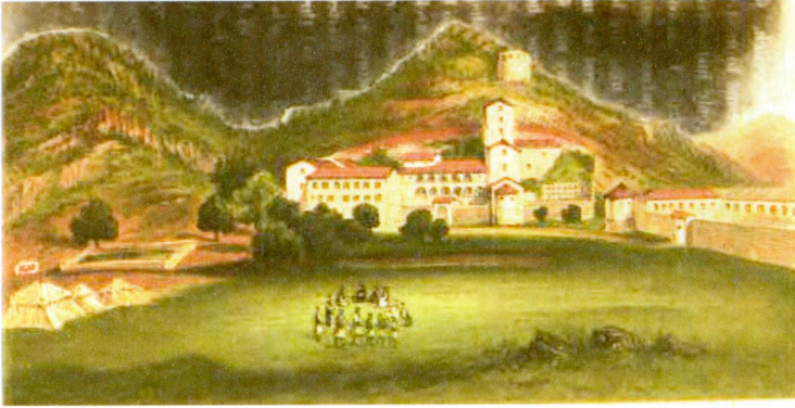
Resim 12: 1863'de Karadağ'ın idare merkezi Çetine. Kaynak: Strangford, a.ge. , s. 141.