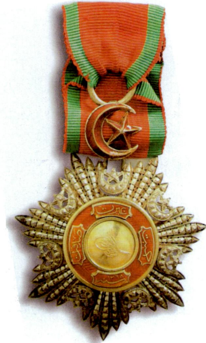
Resim 14: Dördüncü Rütbe Mecidi Nişanı. Kaynak: Eldem, a.ge. , s. 194.