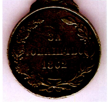
Resim 19: Karadağ tarafından bastırılan "1862 Cesaret Madalyası" arka yüz.