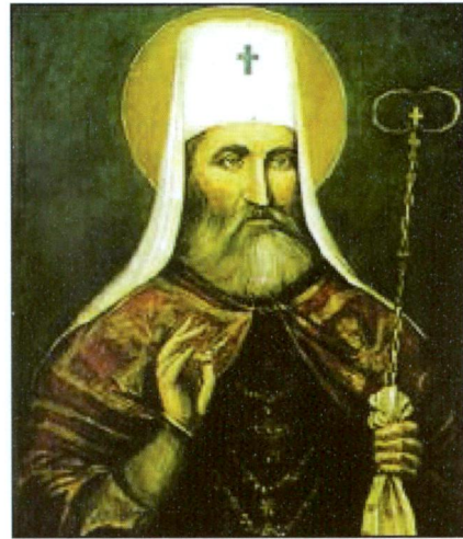
Resim 4: Petar I Petrovic Njegos (1782-1830)