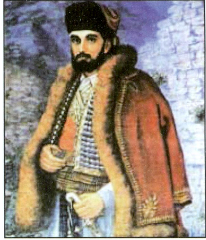
Resim 3: Danilo Petrovic Njegos (1697-1735)