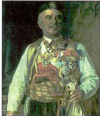
Resim 8: Nikola (1860-1918)