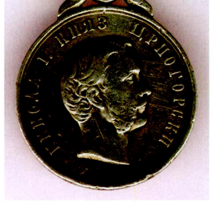
Resim 18: Karadağ tarafından bastırılan "1862 Cesaret Madalyası" ön yüz.