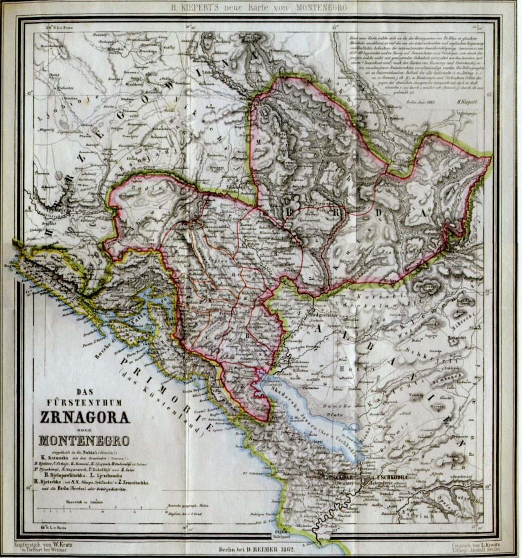
Harita 3: Karadağ ve çevresinin Almanlar tarafından çizilmiş 1862'deki haritası. Heinrich Kiepert, Neue von Karte Montenegro, Berlin bei D. Reimer 1862