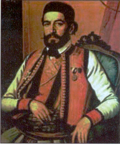
Resim 5: Petar II Petrovic Njegos (1830-1851)