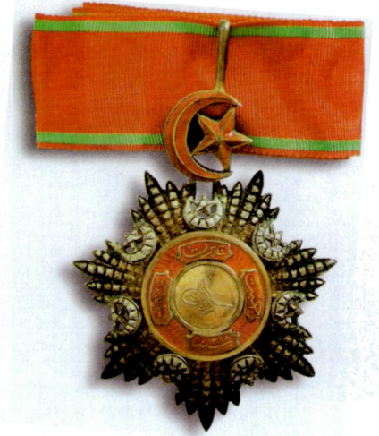
Resim 13: Üçüncü Rütbe Mecidi Nişanı.