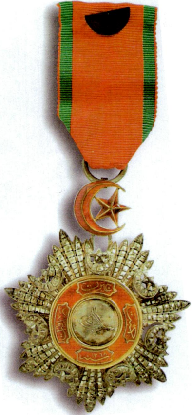
Resim 15: Beşinci Rütbe Mecidi Nişanı. Kaynak: Eldem, a.ge. , s. 194.