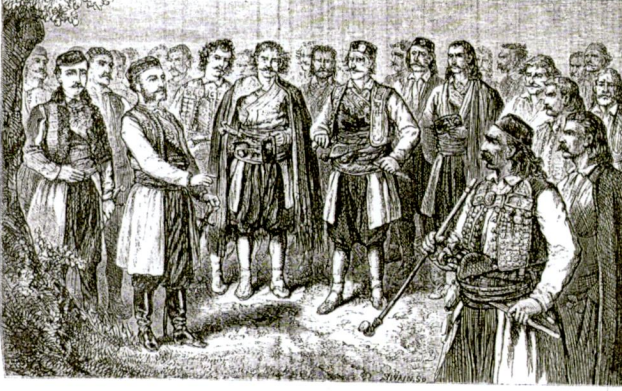
UNDER THE TREE AT CRISIE

Resim 9: Riyeka Savaşı sonrasında Vladika Nikola'nın Çetine'de Karadağlı şeflerle yaptığı toplantı. Kaynak: Mackenzie-Irby, a.g.e. , Volume:II, s. 243.