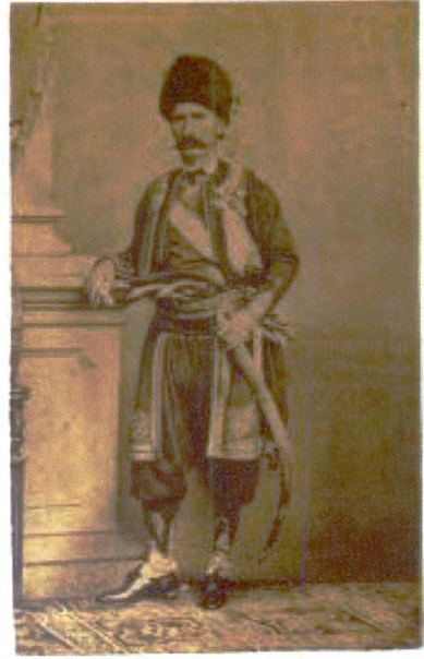
Resim 7: İşkodra Antlaşması'nda sorun olan Vladika Nikola'nın babası Mirko Petrović.