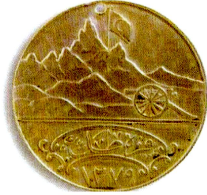
Resim 17: Karadağ Madalyası. Arka Yüz. Kaynak: Eldem, a.g.e. , s. 247.