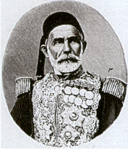
Resim 1: Rumeli Ordu Müşiri Ömer Lütfi Paşa Latas.