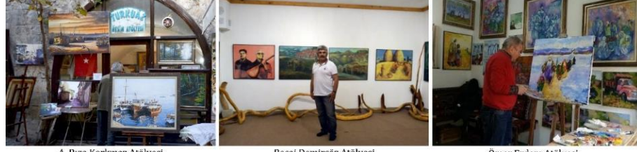
A. Rıza Korkmaz Atölyesi