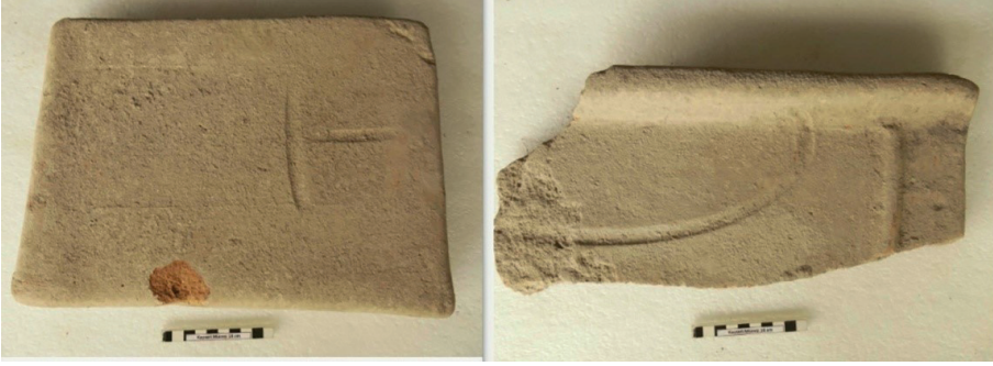
Resim 8. Bir Numaralı Plaka Tekne Mezar içinden bulunan kiremitler.