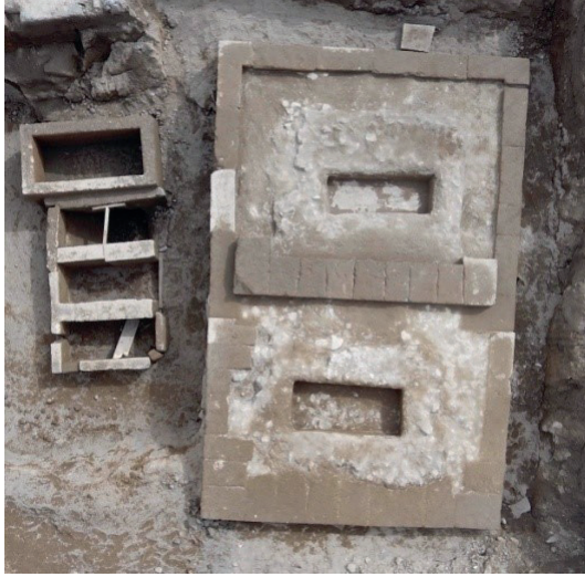
Resim 1. Gültepe Mezar Alanı.