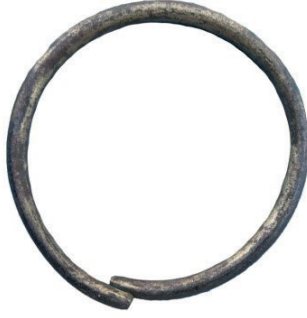
Resim 3. Bir Numaralı Lahit içinden bulunan bronz bilezik.