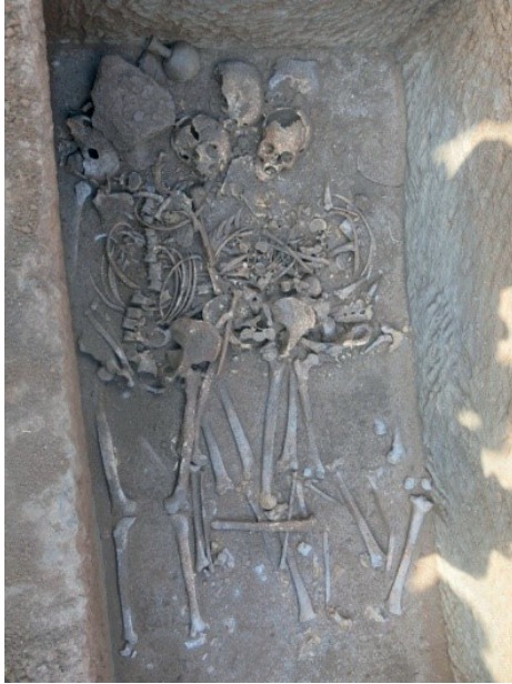
Resim 2. Bir Numaralı Lahit, gömüler.