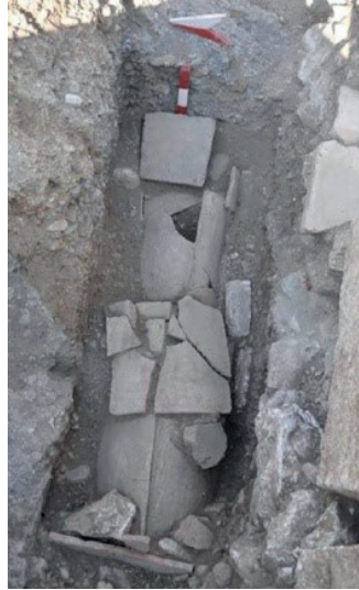
Resim 10. Kibyra'dan Kiremit Mezar örneği. Özüdoğru 2018, fig.17.