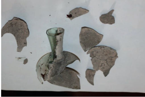
Resim 5. Bir Numaralı Lahit içinden bulunan cam unguenterium parçaları.