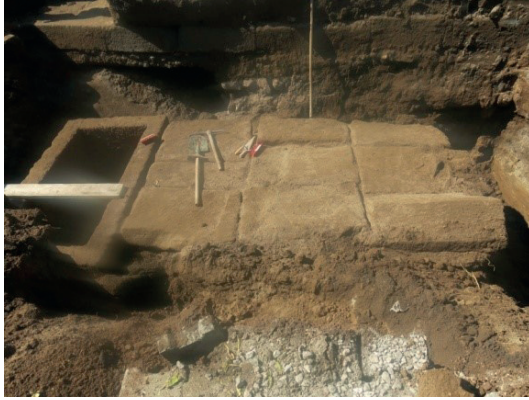
Resim 6. Plaka Tekne Mezarlar.