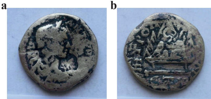
Resim 17. a) İki numaralı oygü mezar içinden bulunan Elagabalus sikkesi ön yüz, b) İki 2 numaralı oygü mezar içinden bulunan Elagabalus sikkesi arka yüz.