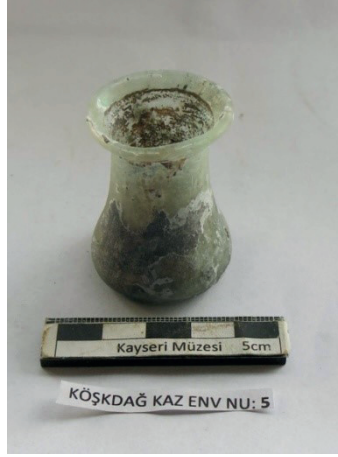
Resim 15. İki numaralı oygü mezar içinden bulunan cam unguenterium.