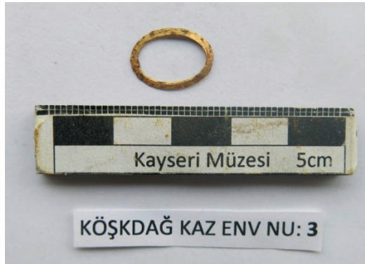
Resim 16. İki numaralı oygü mezar içinden bulunan altın obje.