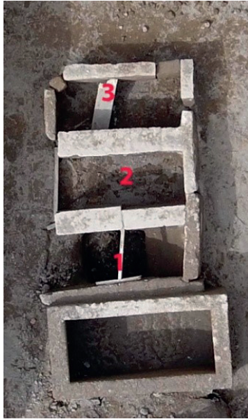
Resim 7. Gültepe Mezar Alanı numaralandırılmış Plaka Tekne mezarlar.