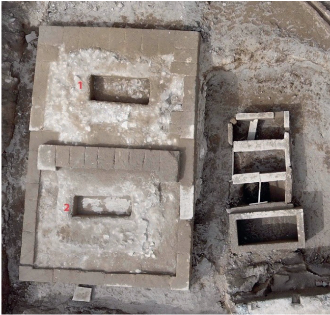
Resim 12. Oygu Mezarlar.