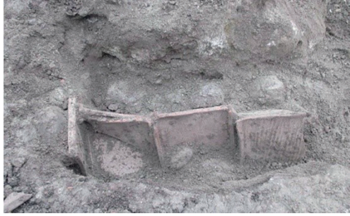
Resim 9. Amisos'tan Kiremit Mezar örneği. Şirin-Kolağasıoğlu 2017, Resim 21a.