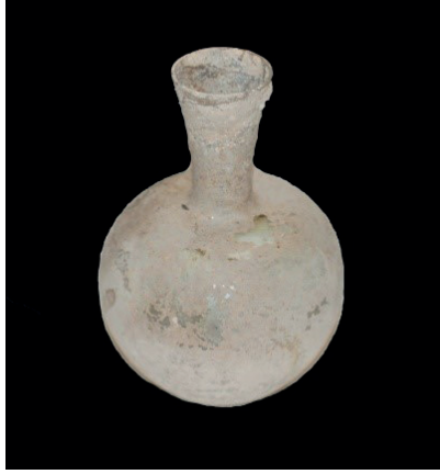
Resim 4. Bir Numaralı Lahit içinden bulunan cam unguenterium.