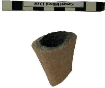
Resim 11. Üç Numaralı Plaka Tekne Mezardan bulunmuş unguentarium parçası.