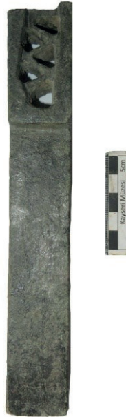
Resim 14. Bir numaralı oygu mezar içinden bulunan bronz obje (kalıp?).