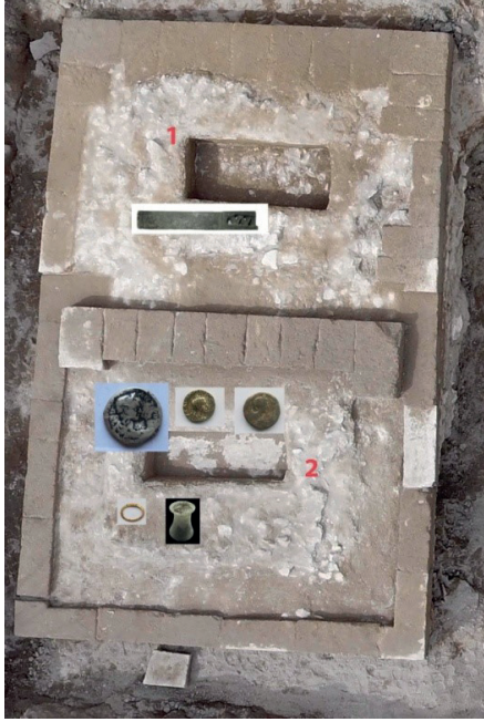
Resim 13. Oygu Mezarlar ve buluntuları.