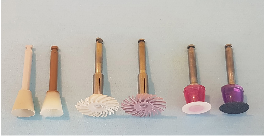
Resim 1. Çalışmada kullanılan bitirme ve cilalama uçları (soldan sağa doğru sırasıyla); EnhancePoGo Cilalama Silindiri (EPCS), Enhance Bitim Silindiri (EBS), Sof-Lex Spiral Bitim Lastiği (SSBL), Sof-Lex Spiral Cilalama Lastiği (SSCL), Super-Snap Rainbow Süper-Cilalama Diski (SRCD), Super-Snap Rainbow Bitim Diski (SRBD)

Bulk Fill Posterior Restorative (A2) rezin kompozit materyal uygulandı ve 20 sn boyunca 1470 \text{ mW/cm}^2 gücünde ışık veren LED cihazı Elipar Deep Cure-S ile polimerize edildi.