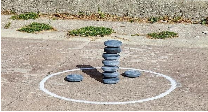
Şekil 2. Mokali Oyunu ( https://www.hepinsan.com/eskiden-oyananan-oyunlar/ )

3.3.3. Tumba: Misket ile oynanan Tumba oyununda oyuncu sayısının fazlalığı önemli değildir. En az 2 kişi ile oynanır. Düz ve toprak olan zemine dört veya beş tane oyuk açılır bu oyuklar çok derin olmamalıdır. Daha sonra açılan oyukların biraz gerisinden misket atılır ve oyuklardan sıra ile geçirilmeye çalışılır.