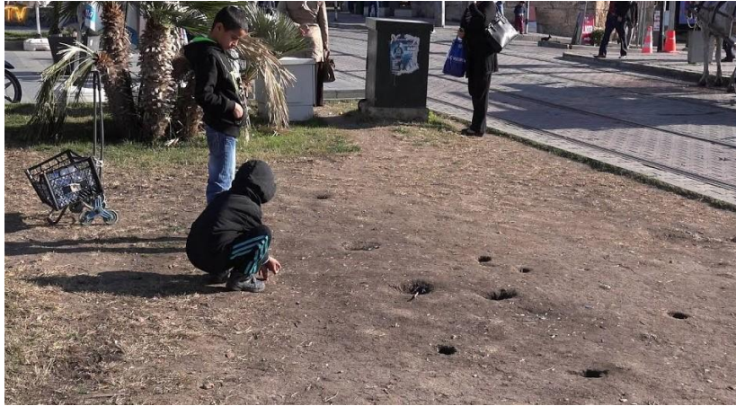
Şekil 3. Tumba Misket Oyunu ( https://www.youtube.com/watch?v=ztRq_p1p0m8 )

3.3.3. Tumba: Misket ile oynanan Tumba oyununda oyuncu sayısının fazlalığı önemli değildir. En az 2 kişi ile oynanır. Düz ve toprak olan zemine dört veya beş tane oyuk açılır bu oyuklar çok derin olmamalıdır. Daha sonra açılan oyukların biraz gerisinden misket atılır ve oyuklardan sıra ile geçirilmeye çalışılır.