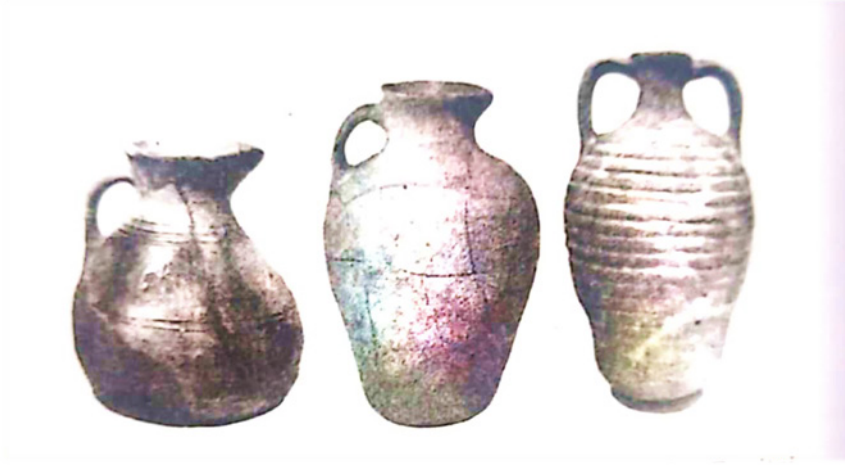
Resim 2. Pravoberejny yerleşimi çömllekleri. M. İ. Artamanov, Hazar Tarihi , İstanbul: Selenge Yayınları, 2008, 413.