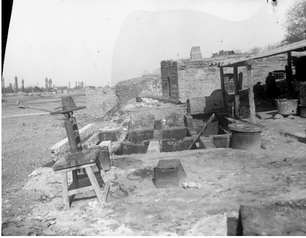
Fotoğraf 2. Gence. Tabaklama tankı. XIX. yy. sonu. Milli Azerbaycan Tarihi Müzesi

başmakları (pabuçları), diğer şahsılara ait çeşitli süsleri, daha da çok gümüşle süslenmiş deri kemerleri örnek verebiliriz.