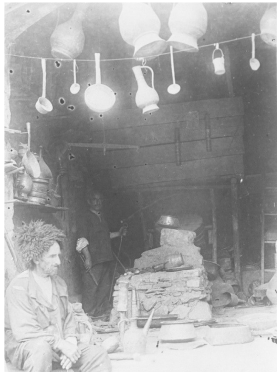
Fotoğraf 3. Bakırcılık imalathanesi. XIX. yy. Milli Azerbaycan Tarihi Müzesi

Azerbaycan arazisinde XIX. yüzyıl sonlarında genellikle Gence bölgesinde deri işleme dükkânları mevcut olmuştur. XIX. yüzyılın 30-40'lı yıllarında Şamahı'da 64 kişi, Nuha'da (şimdi Şeki – N.S.) 178 kişi debbağ olarak çalışıyordu (Sumbatzade, 1958: 94). 1888 yılında Yelizavetpol bölgesinde 99, Bakü'de ise 157 debbağhane vardı (Гулишанбаров, 1890: 209). Milli Azerbaycan Tarihi