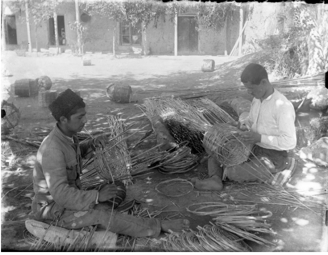
Fotoğraf 6. Hasır sepet dokuma. XIX. yy. sonu. Milli Azerbaycan Tarihi Müzesi

kullanılmış, bunun da başlıca nedeni düzlükte bataklık bitkilerinin zenginliğidir (Çursin, 1926: 35).