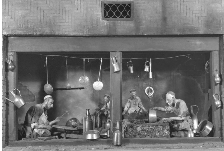
Fotoğraf 4. Bakır imalathanesi. XIX yy. sonu (Model). Milli Azerbaycan Tarihi Müzesi

Azerbaycan`da el sanatları, özelliklede dekoratif sanatın gelişiminde hakkâklık (oymacılık) sanatının önemini de belirtmek gerekir. Darabadi konu ile ilgili yazıyor: İslam`ın ilk dönemlerinde İran ve Azerbaycan sanatkarları tabakların üzerine kûfi yazısı ile işlemler yapmışlar. Kûfi yazıda harfler ilk başlarda noktasız yazılıyordu. Fakat sonralar nokta ve ünlüler de bu yazıya eklenmişti. Ama yine de bu yazının tüm sesleri karşılamadığı için nesih yazı türüne geçilmiştir (Darabadi,