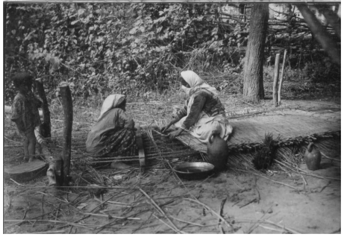
Fotoğraf 5. Hasır dokuyan kadınlar. XIX yy. sonu. Milli Azerbaycan Tarihi Müzesi

Geleneksel bakırcılık sanatında üretim tekniğinin basit el emeğine dayanmasına rağmen, büyük bakır dükkânları emek bölgesi karakterine göre hayli derecede fabrika tipine yaklaşmış, küçük ve orta üretim hacmine sahip bakırhanelerse makine sanayisinin gelişimi ile ilgili olarak baskıya dayanamayıp aradan kalkmıştır.