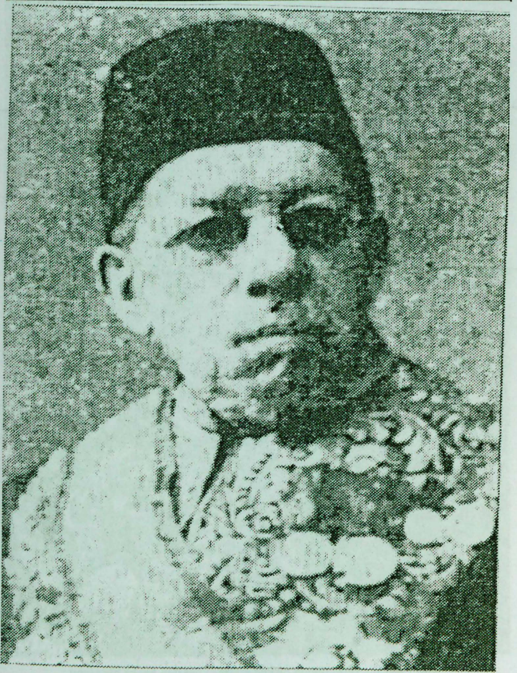
Köse Mehmet Râif Paşa