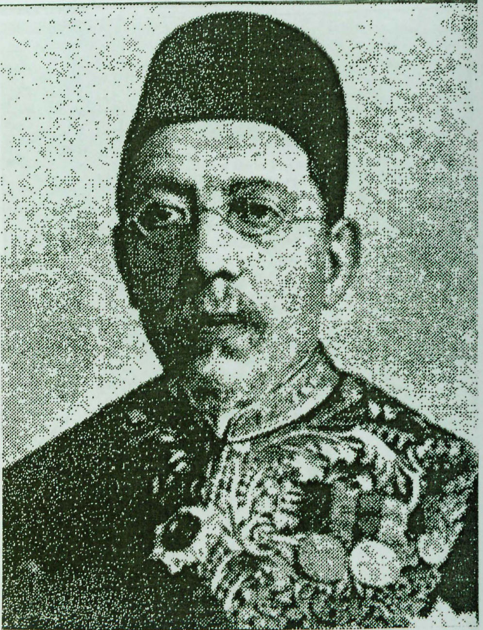
Râif Paşa'nın ölümünden birkaç yıl önce çekilen başka bir resmi