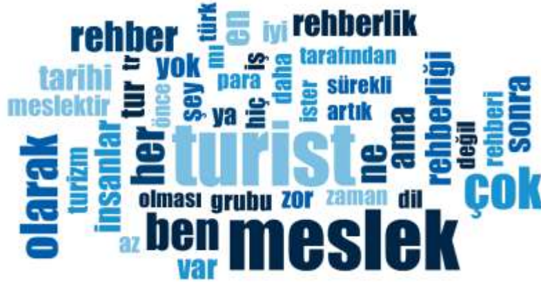
Şekil 1: Kelime Bulutu

çalışmaya ait kelime bulutuna başvurulmuştur. Şekil 1’deki kelime bulutunda yorum yapan kişilerin en sık kullandığı kelimeler daha büyük punto ile gösterilmektedir.