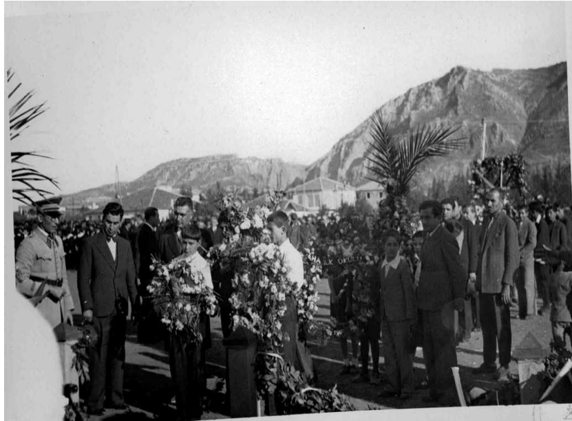
Ek 4: Çocukların Atatürk büstüne çiçek koyduğu an.