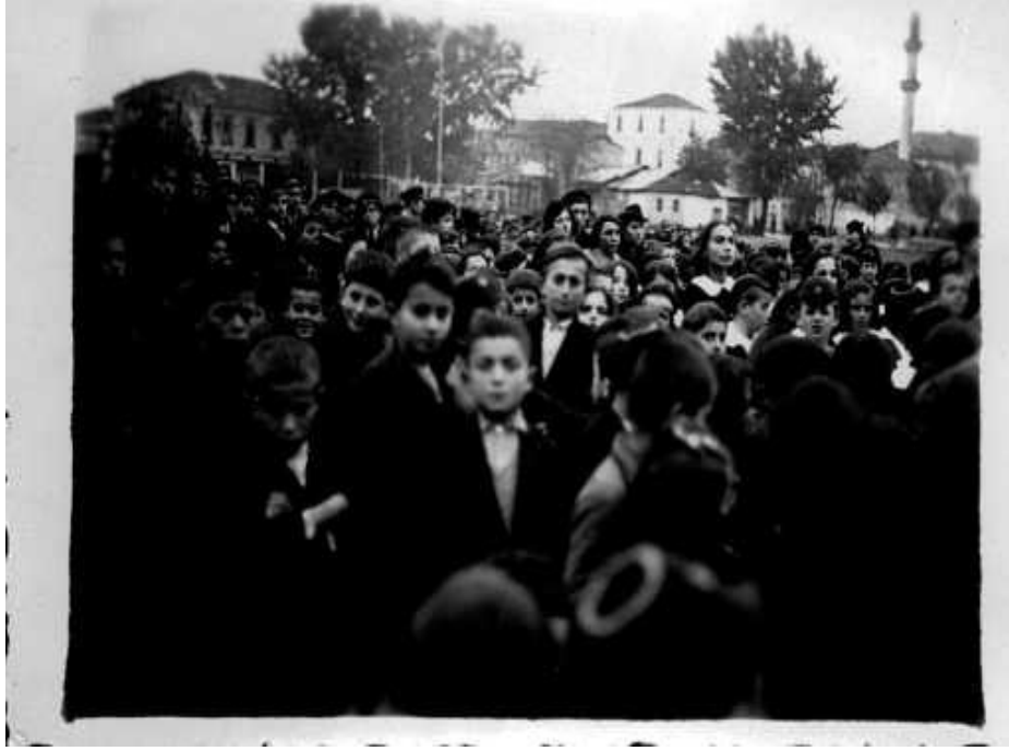
Ek 5- Ordu'daki matem töreninden bir kesit (BCA, 490.1.0.0.1432.733.1).