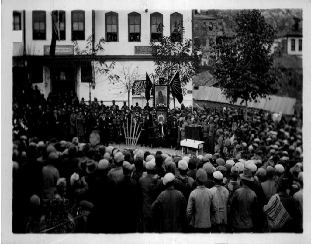
Ek 8: Sinop'ta meydanlar Atatürk için doldu (BCA, 490.1.0.0.1432.734.1).