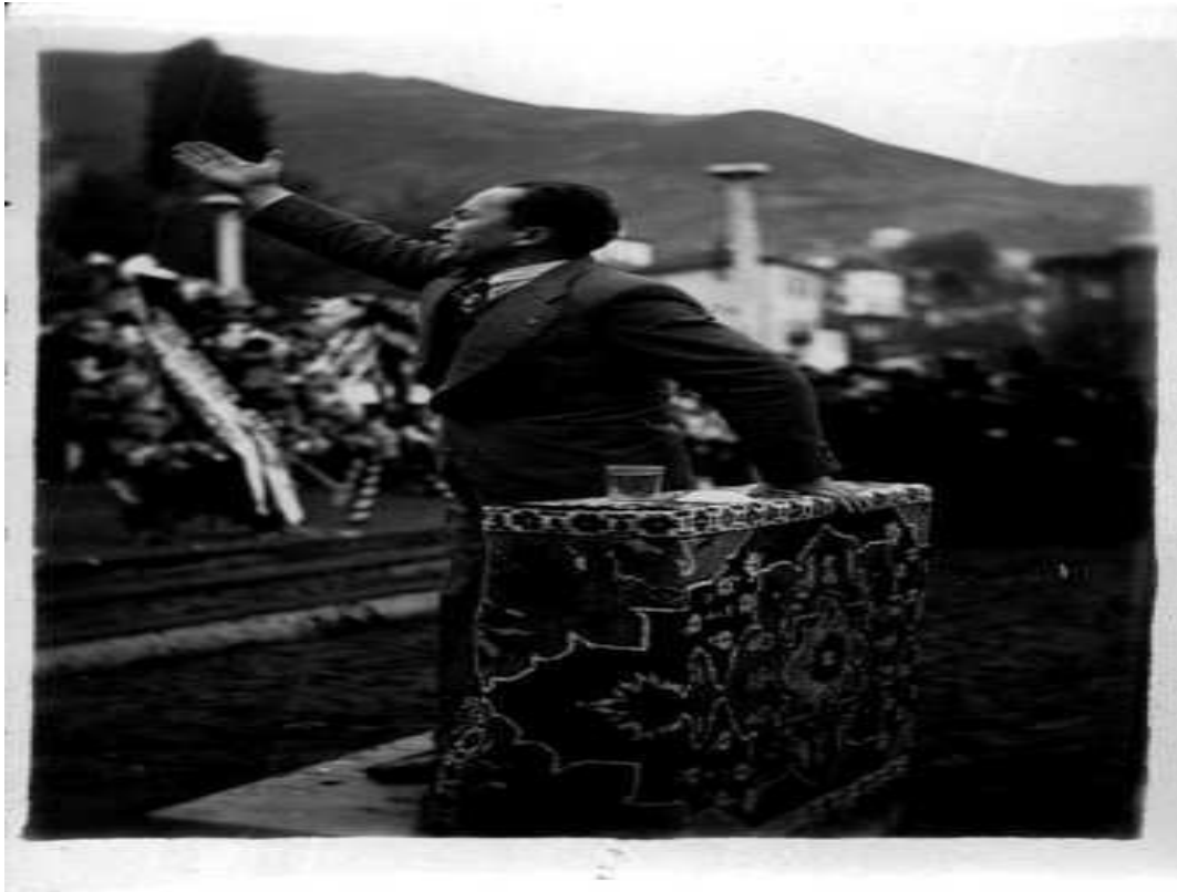
Ek 6: Atatürk için yapılan konuşmadan bir kare (BCA, 490.1.0.0.1432.733.1).