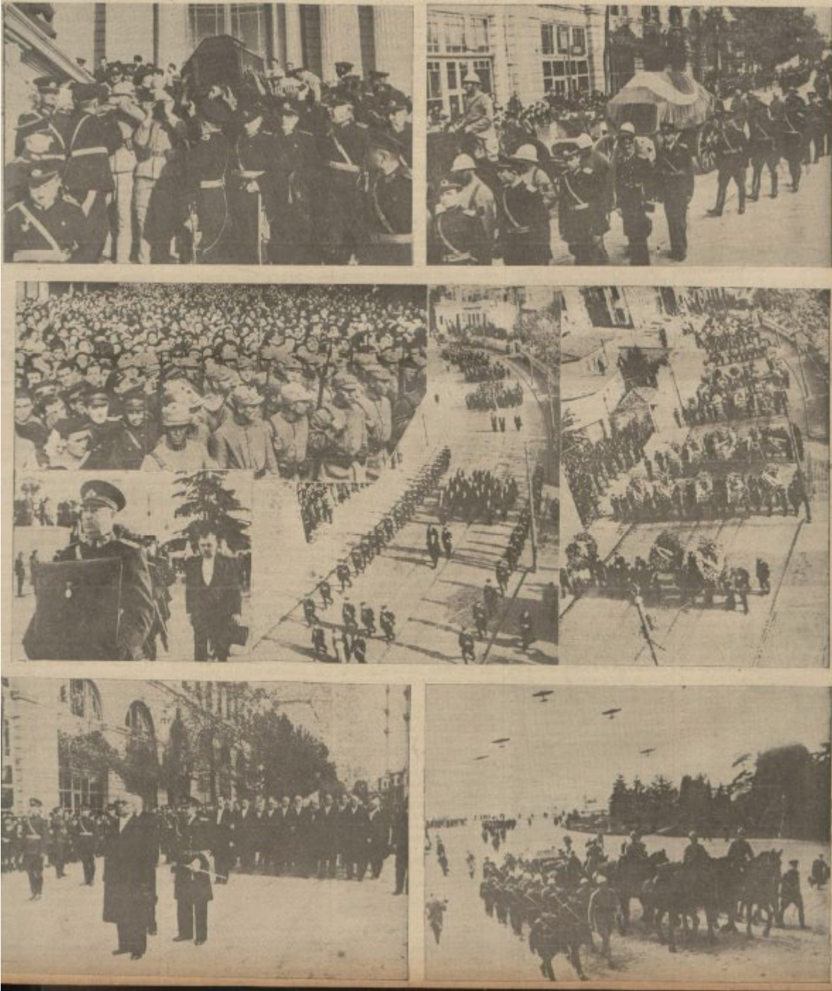
Ek 2: Atatürk'ün Naaşının Ankara'ya nakli (Akşam, 19 Kasım 1938, nr. 7219, s. 1).