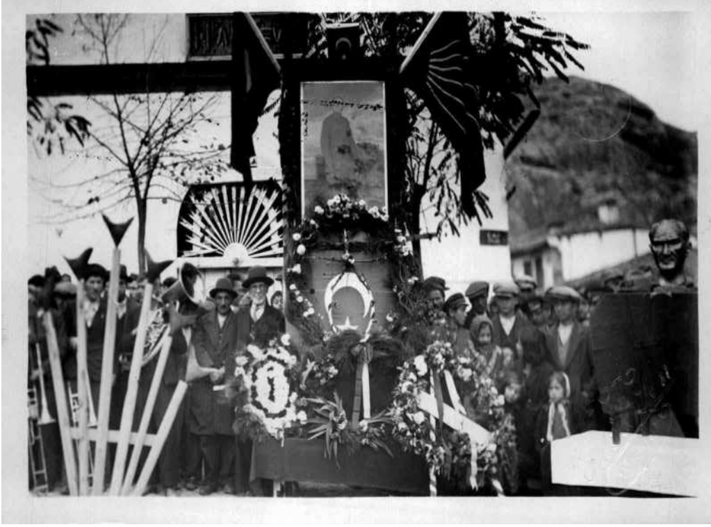
Ek 7: Sinop'ta Türk Milleti Ata'sını saygı ile anarken.