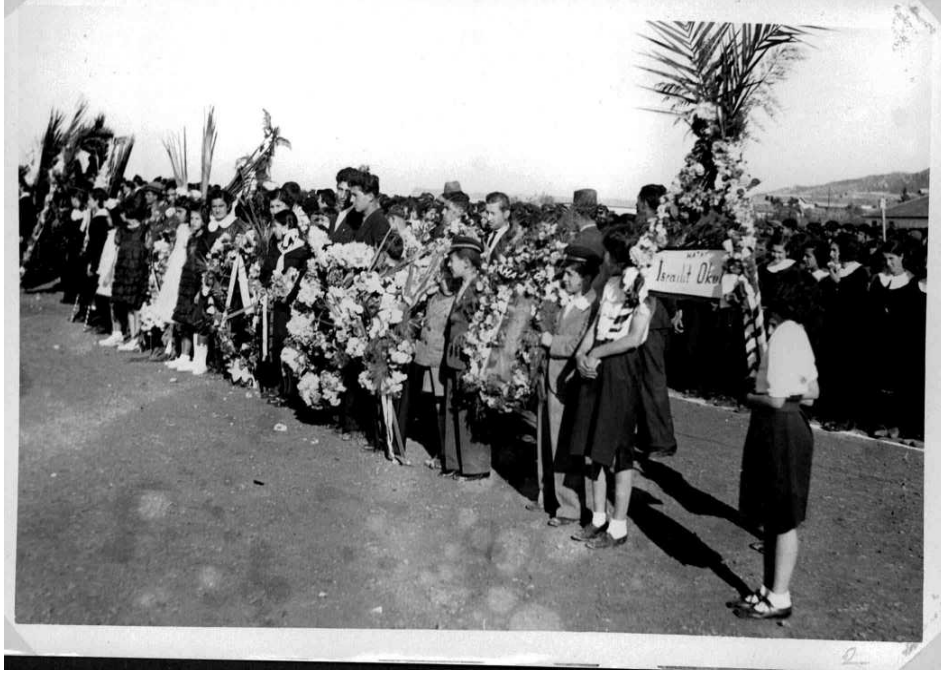
Ek 3: Bolu'da düzenlenen matem töreninden bir kesit.