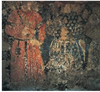
Fotoğraf 3. Leşger-i Bazar Sarayı Taht Odası fresklerinde işlenmiş kese

Bu tür örnekler, İlk Türk İslam devletlerinden biri olan Gazneliler'e ait Leşger-i Bazar sarayının taht salonunda yer alan ve hükümdarın askerleri olduğu düşünülen freskolarda da karşımıza çıkmaktadır. Tasvirlerin bellerinde, kemer, silah ve zincir ya da kolanlarla kemerlere tutturulmuş dip kısmında püsküllü ağız kısımları büzülmüş keselere yer verilmiştir. Bunun yanı sıra Anadolu Selçuklu dönemine tarihlendirilen Varka ve Gülşah adlı yazma eserde de Rabi'nin sarayından erkek kılığına girerek kaçan Gülşah'ın yer aldığı bir minyatürde, at üstündeki Gülşah'ın beline sarılı olan kuşağında sadak, kılıç kını ve sarı renkte keselerin takılı olduğu görülür. Bu tasvir, kese kullanımının Anadolu Selçuklu devrinde de sürdürüldüğünü göstermesi bakımından önem arz eder.