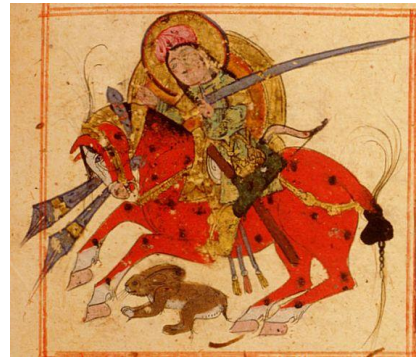
Fotoğraf 4. Gülşah'ın erkek kılığında saraydan kaçması

Kese, Osmanlı döneminde torbanın yanı sıra paranın değerini, cinsini ve hesap birimini de karşılayan bir ifade aracı olarak karşımıza çıkar. Değer bağlamında paranın kıymetinin düşmesi durumunda kesedeki miktarın arttığı, cins açısından bakıldığında kîse-i hasene'nin altını, kîse-i rûmî esedi'nin ise gümüş para karşılığı olarak kullanıldığı, hesap birimi açısından gözlemlendiğinde de dört sikke-i hasene kesenin bir sandığa denkliği ifade eder (Çakır:2019:42,43). Osmanlılar zamanında kesenin hem kullanım eşyasını hem de ölçü birimini karşıladığı Otar'ın ele aldığı Eytam Nizamnamesinde geçen "Eytamın parasının faizle işletilmesi yoluna gidilmiş, Bedesten'den sandık (tabut) sahipleri, işletilmek üzere kese ile para getirenlerin parasını işleterek vade sonunda faizini