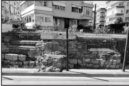
Ek-7: Günümüzde Çiftlikköy Başkent-1 Sahil Sitesi yanında yürüyüş yolunda Pylai kentinden kalan sur kalıntıları