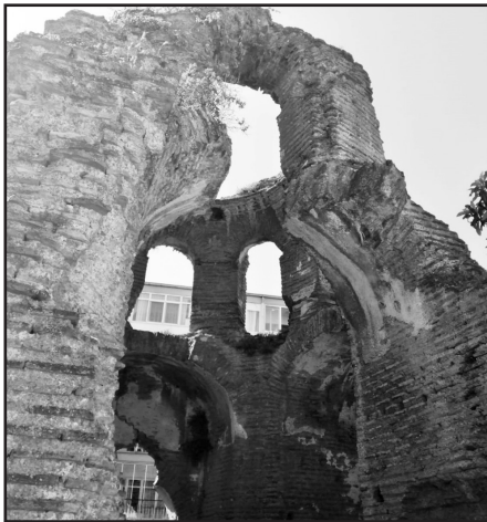
Ek-8: Günümüzde Baskent-1 Sitesi içerisinde yer alan Karakilise