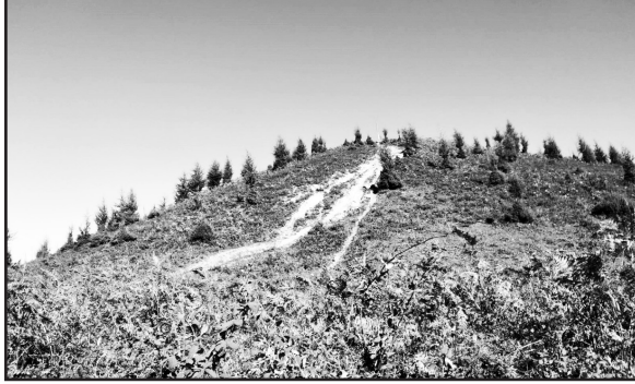
Ek-1: Höyüktepe (Pilavtepe) Kurganı