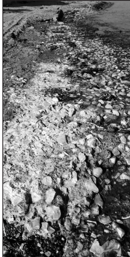
Ek-9: Çiftlikköy'de Mobil ismiyle tabir edilen bölgenin girişinin sahil kısmında Pylai limanına ait bazı kalıntıları