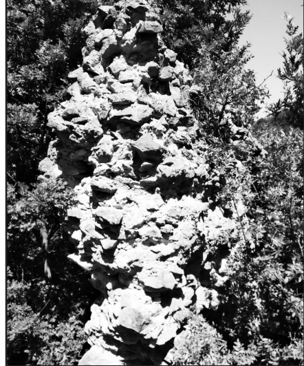
Ek-3: Elmalık Kalesi'nden günümüze kalan surlardan bir parça