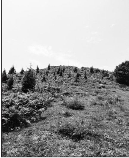
Ek-2: Höyüktepe (Pilavtepe) Kurganı