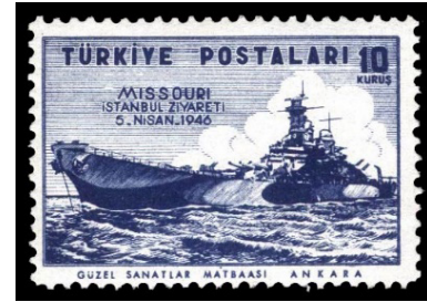
Görsel 39. Missouri Gemisinin gelişi (1946).

e. Kültürel Yönü: Pullar, taşıdıkları ekonomik değerlerin yanı sıra, kültürel gösterge olma vasfına da sahiptir (Yılmaz, 2019: 232). Pulların kültürel yönü, basıldığı ülkenin kendine has niteliklerinin yansıtılması bağlamında önem taşımaktadır.