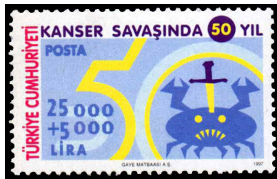
Görsel 52. Kanserle mücadele.

k. Tıbbi Uygulama Yönü: Son yüzyılda, kalp rahatsızlıklarının tedavi edilmesi amacıyla, ilaç yapımında etken madde olarak kullanılan bitki türleri, 22 farklı ülkenin posta pullarında görsel olarak kullanılmıştır (Ataman, 2010: 55).