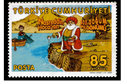
Görsel 64. Nasreddin Hoca.