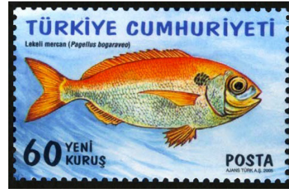
Görsel 55. Dünya Çevre Günü denizlerimizi koruyalım.

m. İletişim Yönü: Posta hizmetlerinde pul kullanımı, uygulama itibariyle 200 yıla yakın bir süreci kapsamaktadır. Bu süreçte milyonlarca insan pullara muhatap olmuştur. Belirli görseller içeren pullar, etkileşime geçenleri etkileyerek farklı bir izlenim bırakmaktadır. Pullar dolaylı iletişim fonksiyonunun yerine getirilmesinde ve bireylerarası iletişimde de önemli bir misyonun yüklenicisi konumundadır.