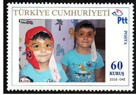
Görsel 59. Kişisel pul örnekleri.