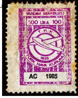
Görsel 19. THK yardım makbuzu.

f. Artı Değerli Pullar: 09.06.1958 tarih ve 7127 sayılı yasa gereği, PTT AŞ'nin yılda iki defa 300.000 tiraj ile çıkardığı ve yıl sonunda pulun üzerinde yazan ek gelirin %25'ini Çocuk Esirgeme Kurumuna, %75'ini de Kızılay'a aktardığı pul türüdür (Düzenli ve Kavuran, 2004: 198).