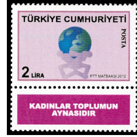
Görsel 49. Kadınlar anısına.

j. Tarihsel Yönü: Geniş anlamda yapılan tanımlamaya göre pul, tarihi evrak statüsünde konumlandırılmış belge olarak yorumlanmaktadır (Ferreira, 2006: 11). Sosyal bir bilim olan filateli, çeşitli dönemlere ait izlenimleri görselleştirerek tarih bilimine yardımcı olmaya çalışır.