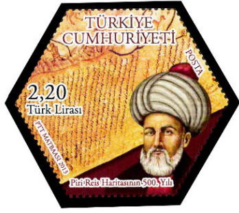
Görsel 26. Altıgen pul.