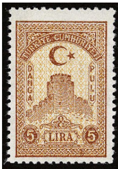
Görsel 9. Damga pulu.

a. Hazine Pulları: Hazineye gelir sağlama amacı taşıyan resim, harç, vergi, bağış vb. ücretlerin toplanması için kullanılan, bir yüzü yalın diğer yüzü yapışkanlı olan değerli kâğıtlardır (Aydoğmuş, 2015: 68). Posta puluna benzeyen ancak fiskal pul türüne dâhil olan bu pullarda, damga kullanılmaz. Fiskal pullar genellikle imza, çizgi, kabartma mühür veya perfin adı verilen pulun üzerine delik açan makinelerle iptal edilir. Bu yöntem, pulun çalınmasını önlemek amacıyla geliştirilmiştir. Ayrıca, fiskal pulları posta işlemlerinde kullanmak da yasaktır (Alp, 2019: 97).