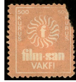
Görsel 45. Film-san pulu.

h. Eğitsel Yönü: Bireyin, görsel okur-yazarlık becerisi kazanmasında pulun önemli bir etkisinin olacağı düşünülmektedir (Bakmaz, 2016: 37). Son 25 yılda yapılan birçok çalışmada pulların, ilk ve orta öğretim kurumlarında, eğitim aracı olarak kullanılması gerektiğine vurgu yapılmaktadır (Anameriç, 2018: 596).