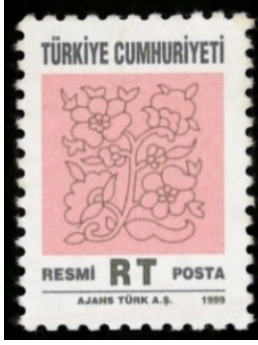
Görsel 12. Resmi pul.