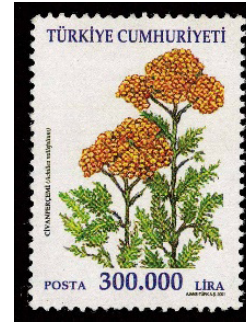
Görsel 53. Şifalı bitkiler (Civanperçemi).

l. Küresel ve Çevresel Değişim Yönü: İnsanların bir arada yaşamaya başlamaları zaman içerisinde bazı kentsel sorunlara sebebiyet vermektedir. Nüfus artışı, çarpık yapılaşma, yeşil alanların yetersizliği, zehirli gazlar ve hava sirkülasyonunun yetersizliği gibi değişkenler; küresel ısınma başta olmak üzere, biyoçeşitlilikte azalma, erozyon, rekolte düşüklüğü, su sorunları, meteorolojik hadiseler (ani yağışlar, fırtına, kasırga, uzun süreli kuraklık vb.) bilinçsiz enerji tüketimi ve kontrolsüz kaynak kullanımı gibi sorunları ortaya çıkarmaktadır. Devlet mekanizmaları, dünyayı ve insanlığın geleceğini tehdit eden küresel krizlere karşı, vatandaşlarına; ekosistem, eğitim ve sürdürülebilir enerji kaynakları konularında bilgilendirmelerde bulunmaktadır. Dolayısıyla bu süreçte, küresel değişimlere vurgu yapan ve yeşil etik politikalarını benimsetmeye çalışan görseller üzerinden, kitlesel bilinç oluşturulmaya çalışılmaktadır (Brunn, 2017: 131).