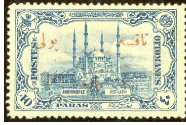
Görsel 6. İlk resmi pul Selimiye Camii 1913.

Selimiye Camii motifli pul, ilk resmi pul olma özelliğine sahip olup, anılan dönemde sürşarj edilerek posta pulu yerine kullanıldı (Düzenli ve Kavuran, 2004: 196).