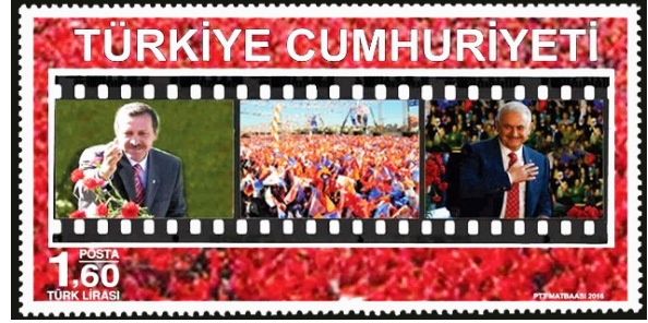
Görsel 43. Ak Partinin 15.Yılı.

g. Sanatsal Yönü: Pullar, insanların yaşam tarzını estetik açıdan ele alan sanatsal nesnelere. Gelenekselin korunmak suretiyle geleceğe taşınması, sanatın önemli bir işlevi olarak düşünülebilir (Begiç ve Çelebilik, 2015: 270).