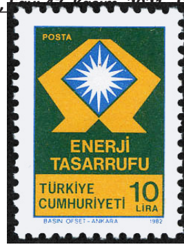
Görsel 37. Enerji tasarrufu temalı pul.

d. Siyasi Yönü: Pullar, çoğunlukla bağımsızlığın ve siyasi egemenliğin göstergesi olmaktadır. Bağımsızlığını ilan eden devletler, pullarda ve paralarda bağımsızlığını tasvir eden ulusal öğeleri kullanmaktadır (Yazıcı, 2016: 99). Bir ülkenin, tam bağımsızlığı ancak bayrak, para ve pul üçlemesiyle sağlanabilmektedir (Say'dan aktaran Düzenli ve Kavuran, 2004: 189). Fransız Ticaret Bakanı Mesureur, 1892 yılında bir rapor yayınladı. Raporda, bir ülkenin ulusal karakterinin ve hüküm süren siyasi rejiminin, pullarda yer alan görsellerle mantıklı bir ilişkisinin olduğunu belirten bir açıklamaya yer verildi (Ferreira, 2006: 38). 1945 yılında, ABD Sovyet Hükûmetine karşı Türkiye ile yakınlaştı ve ABD donanmasının en büyük gemilerinden biri olan Missouri Gemisi 1946 yılında Türkiye'ye geldi. Halkta heyecan uyandıran bu gelişme karşısında, caddelere bayraklar asıldı ve olayı anlatan posta pulları bastırıldı (Ertem, 2013: 176). Ayrıca, bağımsızlığını ilan eden bir ülkenin pullarının satın alınması o ülkenin, siyasi olarak tanındığı anlamına gelmektedir.