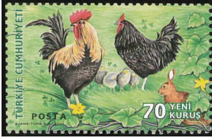
Görsel 62. Hayvanları tanıyalım.