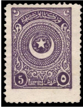
Görsel 7. Birinci Ayyıldız serisi 1923.

d. Türkiye Cumhuriyeti Postaları: Cumhuriyetin ilanından sonraki dönemi kapsamaktadır. Bu dönemde, posta hizmetlerinde dönüşüm yaşandı. İllerde, ilçelerde, bucaklarda ve köylerde posta merkez ve şubeleri kuruldu. Bu dönemde belirli alanlara posta kutuları konuldu. Aynı zamanda pul bayileri ve acentelikler açılarak posta hizmetlerine işlerlik kazandırıldı (Yurtoğlu, 2015: 78).