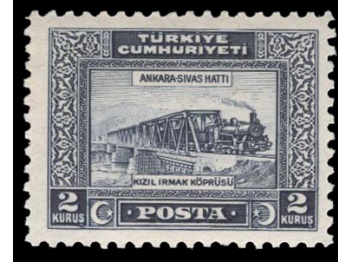
Görsel 8. Ankara Sivas demiryolu 1929.