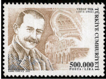
Görsel 15. Vedat Tek (Mimar).

c. Sürekli Posta Pulları: Çeşit ve miktar itibarıyla, çok fazla sayıda bastırılan ve genellikle iki renk içeren, günlük posta ücretlerinin ödenmesinde kullanılan pullardır (Tarlakazan, 2017: 342).