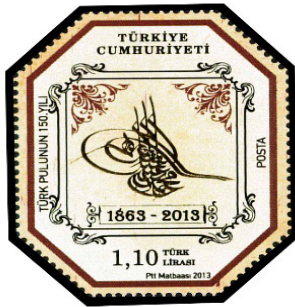
Görsel 23. Sekizgen pul.

Sınırlı kullanım alanına sahip olan pullar, çeşitli görseller içermektedir. Bazen, tasvir edilmek istenen tema standart dikdörtgen kalıba sığdırılamayabilir. Bu nedenle, form oluşturulurken konu bütünlüğüne uygun olarak zaman zaman farklı geometrik şekiller kullanılabilir (İnce, 2017: 28). Pullar, biçim itibarıyla 2'ye ayrılır. Bunlar: dörtgen ve dörtgen olmayan pullardır. Kareye yakın olarak tasarlanan dörtgen pullar, portföyün 1 çoğunluğunu oluşturur. Dörtgen olmayan pullar ise daha çok yuvarlağa yakın üçgen, altıgen veya sekizgen olarak tasarlanır (Tamer, 2014: 10-11). 1898 yılında, Osmanlı İmparatorluğunun bastırdığı Teselya Ordusu Posta Pulları, dünyanın sekizgen formda bastırılan ilk posta pulları olmuştur (Çelik, 2008: 34).