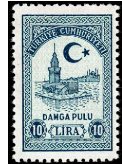
Görsel 11. Damga pulu.

b. Resmi Pullar: 5584 sayılı kanununun 21. maddesi gereği resmi kurumların, pul talep formu karşılığında aldıkları ve sadece resmi yazışmalarda, posta ücretine karşılık kullandıkları pullardır (Güven Bezaz, 2006: 317).