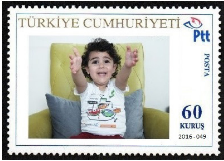
Görsel 60. Kişisel pul örnekleri.