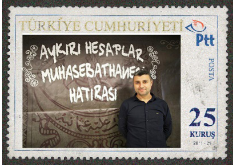
Görsel 58. Kişisel pul örnekleri.