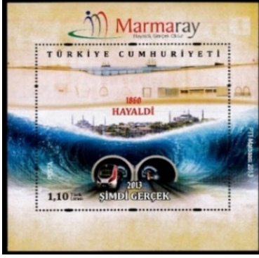
Görsel 42. Marmaray projesi.

girerler. Kullandıkları simge ve semboller üzerinden de halkı manipüle etmeye çalışırlar (Elal, 2018: 122).