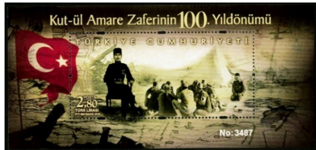
Görsel 18. Kut-ül Amare Zaferinin 100. Yılı.

e. Yardım Pulları: Şefkat pulları olarak da isimlendirilen bu pullar, hayır kurumlarının asgari faaliyetlerini yürütebilmeleri gayesiyle, kendi adlarına bastırdıkları ve satışa sundukları pul türüdür (Bakmaz, 2016: 30).