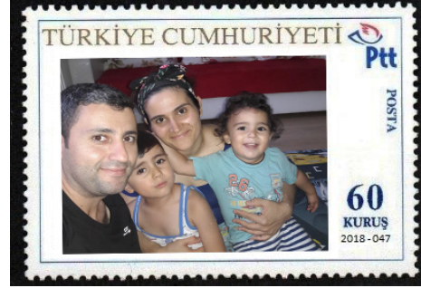
Görsel 61. Kişisel pul örnekleri.