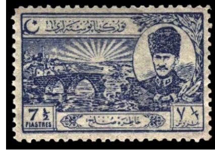
Görsel 51. Milli Mücadele ibareli pul.

k. Tıbbi Uygulama Yönü: Son yüzyılda, kalp rahatsızlıklarının tedavi edilmesi amacıyla, ilaç yapımında etken madde olarak kullanılan bitki türleri, 22 farklı ülkenin posta pullarında görsel olarak kullanılmıştır (Ataman, 2010: 55).