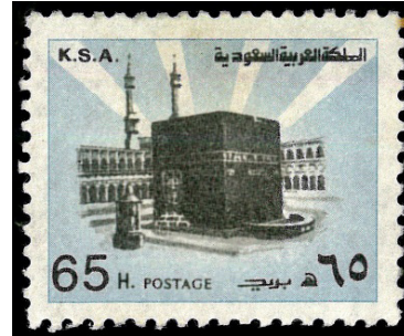
Görsel 35. Kâbe-i Muazzama.

c. Ekonomik Yönü: Pullarda kullanılan görseller, ülkelerin iktisadi ve teknolojik gelişmişliğini göstermek amacıyla da kullanılabilir. Ülkelerin, tarihi gelişimlerine bakıldığında sanayi, tarım, hayvancılık, maden, turizm vb. potansiyellerine ilişkin veriler elde edilebilir (İnce, 2017: 42). Erken dönem pullarında özellikle, ülkelerin ekonomik potansiyellerini ön plana çıkaran görseller kullanılmaktadır.