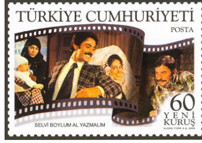
Görsel 44. Selvi boylum al yazmalım filmi pulu.

g. Sanatsal Yönü: Pullar, insanların yaşam tarzını estetik açıdan ele alan sanatsal nesnelere. Gelenekselin korunmak suretiyle geleceğe taşınması, sanatın önemli bir işlevi olarak düşünülebilir (Begiç ve Çelebilik, 2015: 270).