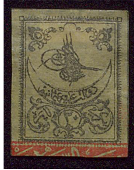
Görsel 4. İlk Osmanlı pulu Tuğralı Pul 1 Ocak 1863.

a. Osmanlı Postaları (1863-1921): İlk pulun tedavüle çıkarıldığı yıldan, Cumhuriyet dönemine kadar geçen süreyi kapsamaktadır. Dönemin Posta Nazırı Agâh Efendi, 1863 yılında, Tuğralı pul olarak anılan ilk Türk posta pulunu bastırdı (Arı, 2013: 169). Sultan Abdülaziz'in tuğrasının modellenmesiyle oluşturulan pul, posta tarihinde bir ilke sahne oldu. Bu tarihten itibaren, mesafenin dikkate alınması koşuluyla mektuplarda ücret karşılığı, pul uygulamasına geçildi (Düzenli, 2004: 194). İki ve beş kuruştan satışı çıkarılan tuğralı pullar, günümüzde 1 milyon 200 bin TL'den alıcı bulmaktadır (Çelik, 2008: 34).