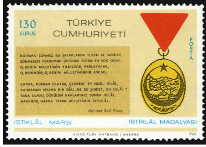
Görsel 32. İstiklal Marşı.

basılı bulunan tüm yayınlar ve eserler, derleme kanunu kapsamında arşivlenmektedir. Eserler arasında 8 milyon pul ve sayısız filateli malzemesi de yer almaktadır (Bezirci, 2018: 239).