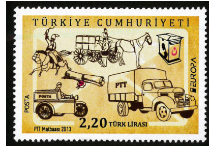
Görsel 57. Posta arabaları ve posta araçları.