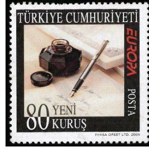
Görsel 33. Yazının anlam ve önemi.

b. Dini İnanç ve Semboller: Pullar, uzun zamandır dini propaganda aracı olarak da kullanılmaktadır. Vatikan, pullara yüklediği misyonla; papalık arması, portreler, Codex Justinianus gibi tasvirleri, tarih boyunca pullarda kullanmış ve Hristiyanlığı kabul eden toplumlara subliminal içerikli mesajlar vermiştir (Stoetzer, 1953: 8). Birleşmiş Milletlerin 2020 yılını, bitki sağlığı yılı olarak ilan etmesiyle birlikte Vatikan, İlk Hristiyan Devlete Ziyaret başlığıyla imgesel bir pul bastırmıştır. Pulun üzerinde Ermeni soykırımı anıtı olarak nitelendirdikleri ve değer atfettikleri anıt, dua eden Hristiyan din adamları, Hz. Nuh'un Gemisi şeklinde tasarlanan saksı ve bu saksıya dikilen ağacın sulanması tasviri yer almaktadır (Armenpress.am, 2020). 2021 yılının mart ayında, Kürt Bölgesel Yönetimi , Papa Francis'in Irak'a ziyaretini anmak amacıyla, pul bastırmaya yönelik bir girişimde bulunmuştur. Basılması düşünülen pullar, altı farklı tasarımdan oluşmaktadır. Tasarımların birinde Türkiye'nin birçok vilayetinin, Irak topraklarına dâhil edildiği bir harita resmedilmiştir (Duz, 2021). İlgili yönetim, tasarımların resmi olarak doğrulanmadığını, sadece sanatçı çizimi olduğunu belirten bir açıklamada bulunmuştur. Ayrıca Şeâir-i İslâm'iyeyi temsil eden medrese, türbe, külliye ve camii gibi eserler de propagandadan münezze tutularak pullarda neşredilmiştir.