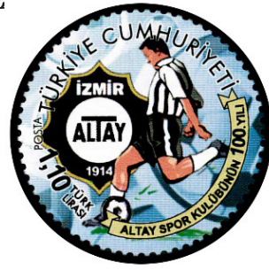
Görsel 27. Daire pul.

Günümüzde swarovski taşlı, altın kaplama, 3 boyutlu, kabartmalı, polimer veya plastik maddeden üretilen pulların yanı sıra bitter, okaliptus ve çikolata aromalı kâğıtlardan elde edilen kahve kokulu pullar da bastırılmıştır. 1973 yılında Bhutan Krallığı Bhutan Talking Stamps adıyla fonograf bir pul bastırmıştır. Çelik folyo üzerine tasarlanan bu pul, gramafon yardımıyla çalınabilmektedir. Alışılmış görseleğe eklenen işitsel fonksiyon ile pul tarihinde çığır açan uygulama, pullarla ilgili farklı tasarımlara da ilham kaynağı olmuştur. 21.yy'da İngiltere Kraliyet Postası, tag veya karekod özelliğine sahip akıllı pul tasarlamıştır. Akıllı telefonlara yüklenen uygulama yardımıyla, karekod okutulmakta ve pula yüklenen bütün bilgiler ekrana gelmektedir (Toker, 2013: 40-49).