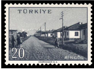
Görsel 2. Memleket serisi II. grup (1958).

Pul, üzerinde çeşitli görsellerin yer aldığı, ayırt edici ölçü ve kriterlere göre oluşturulmuş, arka yüzü zamkılı olan değerli kâğıtlardır (Kazan, 2016: 15). Pul, minyatür sanat eseri niteliği taşıyan görsel hafızadır.