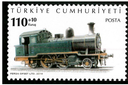
Görsel 21. Lokomotifler.