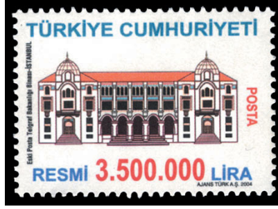
Görsel 13. Resmi pul.