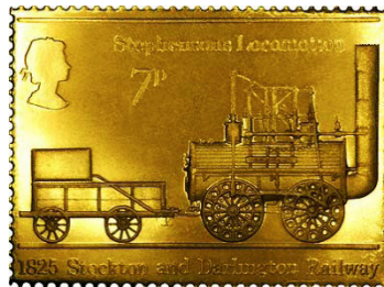
Görsel 31. Altın pul Stephenson'ın Lokomotif (1825) Stockton ve Darlington demiryolu.