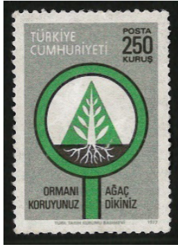
Görsel 54. Ormanlarımızı koruyalım.