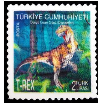
Görsel 29. Dinazor serisi T-REX lenticular baskılı 3D pul.