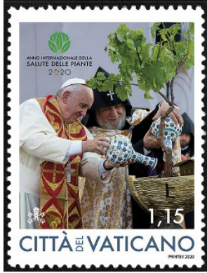
Görsel 34. Vatikan'ın Hristiyan devlete ziyareti.

b. Dini İnanç ve Semboller: Pullar, uzun zamandır dini propaganda aracı olarak da kullanılmaktadır. Vatikan, pullara yüklediği misyonla; papalık arması, portreler, Codex Justinianus gibi tasvirleri, tarih boyunca pullarda kullanmış ve Hristiyanlığı kabul eden toplumlara subliminal içerikli mesajlar vermiştir (Stoetzer, 1953: 8). Birleşmiş Milletlerin 2020 yılını, bitki sağlığı yılı olarak ilan etmesiyle birlikte Vatikan, İlk Hristiyan Devlete Ziyaret başlığıyla imgesel bir pul bastırmıştır. Pulun üzerinde Ermeni soykırımı anıtı olarak nitelendirdikleri ve değer atfettikleri anıt, dua eden Hristiyan din adamları, Hz. Nuh'un Gemisi şeklinde tasarlanan saksı ve bu saksıya dikilen ağacın sulanması tasviri yer almaktadır (Armenpress.am, 2020). 2021 yılının mart ayında, Kürt Bölgesel Yönetimi , Papa Francis'in Irak'a ziyaretini anmak amacıyla, pul bastırmaya yönelik bir girişimde bulunmuştur. Basılması düşünülen pullar, altı farklı tasarımdan oluşmaktadır. Tasarımların birinde Türkiye'nin birçok vilayetinin, Irak topraklarına dâhil edildiği bir harita resmedilmiştir (Duz, 2021). İlgili yönetim, tasarımların resmi olarak doğrulanmadığını, sadece sanatçı çizimi olduğunu belirten bir açıklamada bulunmuştur. Ayrıca Şeâir-i İslâm'iyeyi temsil eden medrese, türbe, külliye ve camii gibi eserler de propagandadan münezze tutularak pullarda neşredilmiştir.