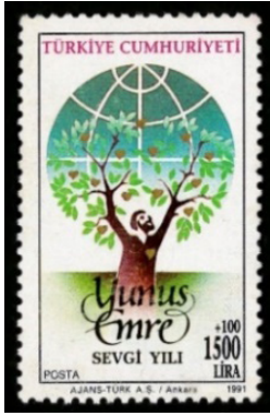
Görsel 20. Yunus Emre.

f. Artı Değerli Pullar: 09.06.1958 tarih ve 7127 sayılı yasa gereği, PTT AŞ'nin yılda iki defa 300.000 tiraj ile çıkardığı ve yıl sonunda pulun üzerinde yazan ek gelirin %25'ini Çocuk Esirgeme Kurumuna, %75'ini de Kızılay'a aktardığı pul türüdür (Düzenli ve Kavuran, 2004: 198).