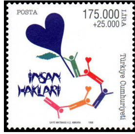
Görsel 48. İnsan hakları konulu pul.

bu pullar, bütün yurttan satışa sunuldu (Keser, 2013: 49).