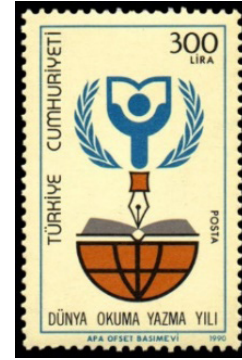
Görsel 47. Dünya okuma yazma yılı.

i. Yardımlaşma ve Dayanışma Yönü: Olası felaketlerle karşılaşılması durumunda, devletler yardım amaçlı pul bastırabilmektedir. 1911 yılında, yoksullukla mücadele kampanyası yürüten Portekiz, ilk defa posta pullarına artı değer ilave ederek, finansman sağlama yoluna gitmiştir (Ferreira, 2006: 118). Rumların uyguladığı ambargo neticesinde, siyasi ve ekonomik yaptırımlara maruz kalan Kıbrıslı Türklerin durumunu değerlendirmek amacıyla Bakanlar Kurulu toplantısı düzenlendi. 7 Ocak 1964 ve 12 Eylül 1964 tarihli toplantıda, ağır yaptırımlarla karşı karşıya kalan Kıbrıslı Türklerin, ekonomik ihtiyaçlarını teminen Kıbrıs'a Yardım Pulu bastırılması ve bütün yurtdışı satışa sunulması yönünde karar alındı. Kızılay başta olmak üzere birçok kurumun ve derneğin girişimiyle bastırılan