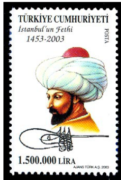
Görsel 17. İstanbul'un Fethi.

d. Anma Pulü: Bir kişiyi veya olayı yâd etme amacı taşıyan, üzerinde kişiye veya olaya ait vurgulayıcı görsellerin yer aldığı, bazen de propaganda gayesiyle oluşturulan pullardır. Anma pulları bazen bloklar halinde de bastırılmaktadır (Düzenli ve Kavuran, 2004: 197).