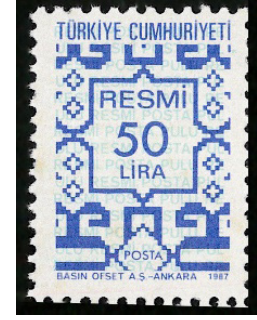
Görsel 14. Resmi pul.

c. Sürekli Posta Pulları: Çeşit ve miktar itibarıyla, çok fazla sayıda bastırılan ve genellikle iki renk içeren, günlük posta ücretlerinin ödenmesinde kullanılan pullardır (Tarlakazan, 2017: 342).