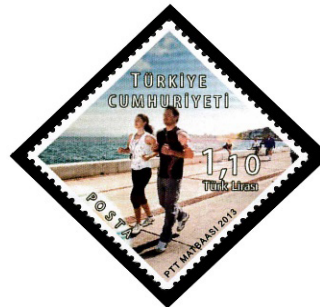
Görsel 24. Köşegen pul.