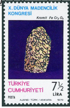
Görsel 36. 10. Madencilik Kongresi.