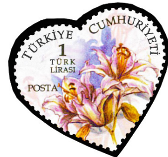
Görsel 25. Kalp şekilli pul.