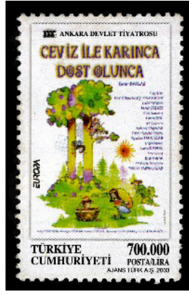
Görsel 63. Ceviz ile Karınca.