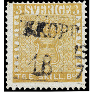
Görsel 65. Duloz basımı 20 para. Görsel 66. The British Guiana One Macenta. Görsel 67. The Treskilling Yellow.