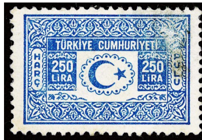
Görsel 10. Harç pulu.