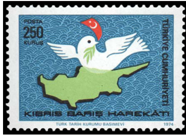
Görsel 38. Kıbrıs Barış Harekâtı.

d. Siyasi Yönü: Pullar, çoğunlukla bağımsızlığın ve siyasi egemenliğin göstergesi olmaktadır. Bağımsızlığını ilan eden devletler, pullarda ve paralarda bağımsızlığını tasvir eden ulusal öğeleri kullanmaktadır (Yazıcı, 2016: 99). Bir ülkenin, tam bağımsızlığı ancak bayrak, para ve pul üçlemesiyle sağlanabilmektedir (Say'dan aktaran Düzenli ve Kavuran, 2004: 189). Fransız Ticaret Bakanı Mesureur, 1892 yılında bir rapor yayınladı. Raporda, bir ülkenin ulusal karakterinin ve hüküm süren siyasi rejiminin, pullarda yer alan görsellerle mantıklı bir ilişkisinin olduğunu belirten bir açıklamaya yer verildi (Ferreira, 2006: 38). 1945 yılında, ABD Sovyet Hükûmetine karşı Türkiye ile yakınlaştı ve ABD donanmasının en büyük gemilerinden biri olan Missouri Gemisi 1946 yılında Türkiye'ye geldi. Halkta heyecan uyandıran bu gelişme karşısında, caddelere bayraklar asıldı ve olayı anlatan posta pulları bastırıldı (Ertem, 2013: 176). Ayrıca, bağımsızlığını ilan eden bir ülkenin pullarının satın alınması o ülkenin, siyasi olarak tanındığı anlamına gelmektedir.