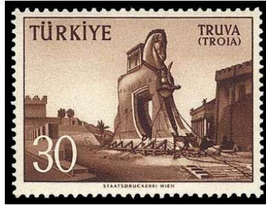
Görsel 50. Truva Atı.

Milli Mücadele döneminde işgal edilen Adana, Balıkesir, İstanbul ve İzmir gibi vilayetleri görsel olarak tasvir eden pulların bastırılması ve üzerine Milli Mücadele Hatırası ibaresinin yazılması yönünde karar alındı (Yurtoğlu, 2015: 53).