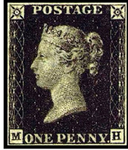
Görsel 1. The Penny Black , basılan ilk pul

toplantısında yaşadıklarını dile getirdi ve posta hizmetlerinin göreceği zararı asgariye indirecek yeni bir sistem önerisinde bulundu. Buna göre, posta ücreti, göndericisinden peşin olarak tahsil edilmeli ve alınan ücreti temsil eden küçük resimli bir kâğıt, mektuba yapıştırılmalıydı. Öneri kabul edildi ve 6 Mayıs 1840 tarihinde yürürlüğe girdi. Akabinde, Kraliçe Victoria'nın resminin yer aldığı 1 penny değerinde siyah ve 2 penny değerinde mavi renkli pullar tedavüle çıkarıldı (Güven Bezaz, 2006: 291-292).