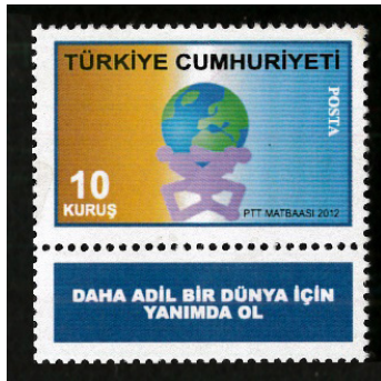
Görsel 56. Adil dünya pulunun orijinali.

Silivri Cezaevinde yatan emekli bir askerın, mecliste grubu bulunan siyasi bir partinin genel başkan yardımcısına mektup göndermesi üzerine, farklı bir polemik yaşandı. Zarfa yapıştırılan pulların birine entegre edilen parçada daha adil bir dünya için yanımda ol ifadesi yer aldı. Bunun üzerine ilgili vekil, pulun üzerinde yazan ibarenin ne anlama geldiğini ve pul üzerinden özel olarak ne anlatılmak istendiğini sorgulayan bir soru önergesini meclise sundu (Umutoran.com, 2013).