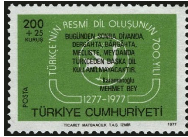
Görsel 46. Türkçenin resmi dil oluşunun 700.yılı.

h. Eğitsel Yönü: Bireyin, görsel okur-yazarlık becerisi kazanmasında pulun önemli bir etkisinin olacağı düşünülmektedir (Bakmaz, 2016: 37). Son 25 yılda yapılan birçok çalışmada pulların, ilk ve orta öğretim kurumlarında, eğitim aracı olarak kullanılması gerektiğine vurgu yapılmaktadır (Anameriç, 2018: 596).