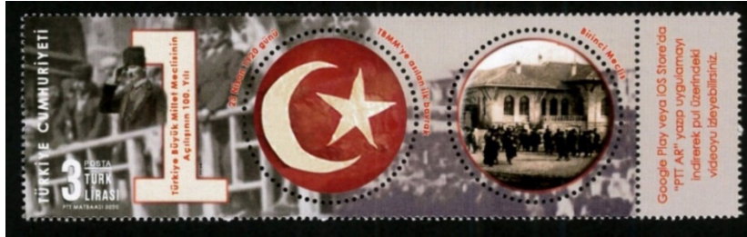
Görsel 30. Google Play veya PTT AR uygulamasıyla çalışan Türkiye'nin ilk görüntülü ve sesli pulu.