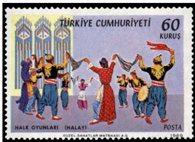
Görsel 40. Halkoyunları (Halay).

e. Kültürel Yönü: Pullar, taşıdıkları ekonomik değerlerin yanı sıra, kültürel gösterge olma vasfına da sahiptir (Yılmaz, 2019: 232). Pulların kültürel yönü, basıldığı ülkenin kendine has niteliklerinin yansıtılması bağlamında önem taşımaktadır.