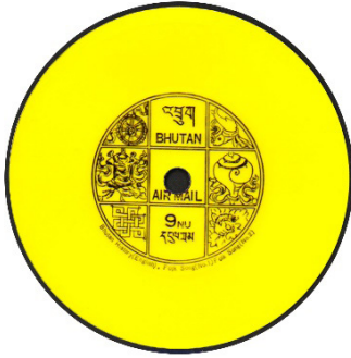
Görsel 28. Bhutan Talking Stamps.

Günümüzde swarovski taşlı, altın kaplama, 3 boyutlu, kabartmalı, polimer veya plastik maddeden üretilen pulların yanı sıra bitter, okaliptus ve çikolata aromalı kâğıtlardan elde edilen kahve kokulu pullar da bastırılmıştır. 1973 yılında Bhutan Krallığı Bhutan Talking Stamps adıyla fonograf bir pul bastırmıştır. Çelik folyo üzerine tasarlanan bu pul, gramafon yardımıyla çalınabilmektedir. Alışılmış görseleğe eklenen işitsel fonksiyon ile pul tarihinde çığır açan uygulama, pullarla ilgili farklı tasarımlara da ilham kaynağı olmuştur. 21.yy'da İngiltere Kraliyet Postası, tag veya karekod özelliğine sahip akıllı pul tasarlamıştır. Akıllı telefonlara yüklenen uygulama yardımıyla, karekod okutulmakta ve pula yüklenen bütün bilgiler ekrana gelmektedir (Toker, 2013: 40-49).