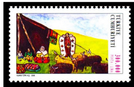
Görsel 41. Yörüklerin kültür ve gelenekleri.

f. Propaganda Yönü: Dünya'nın birçok ülkesinin siyasi, ekonomik ve sosyolojik incelemelerinde para ve pul gibi görseller üzerinden, bilinçaltına mesaj telkin edildiği yönünde çıkarımlarda bulunulmuştur. Özellikle, iktidara gelen hükümetlerin sıklıkla başvurduğu propaganda araçlarının başında, pullar gelmektedir. Hükümetler, genellikle kendi iktidarlarını, önceki siyasi oluşumlarla karşılaştırırlar. Diğer siyasi aktörlerin hata ve noksanlıklarını vurgulayan yıpratma yönlü davranışları kullanarak, egemen gücün kendileri olduğunu gösterme gayreti içerisine