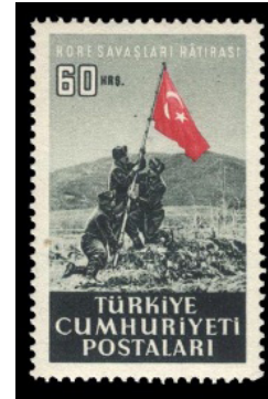
Görsel 16. Kore Savaşı anısına.

d. Anma Pulü: Bir kişiyi veya olayı yâd etme amacı taşıyan, üzerinde kişiye veya olaya ait vurgulayıcı görsellerin yer aldığı, bazen de propaganda gayesiyle oluşturulan pullardır. Anma pulları bazen bloklar halinde de bastırılmaktadır (Düzenli ve Kavuran, 2004: 197).