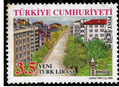
Görsel 3. İllerimiz pul serisi (2005).