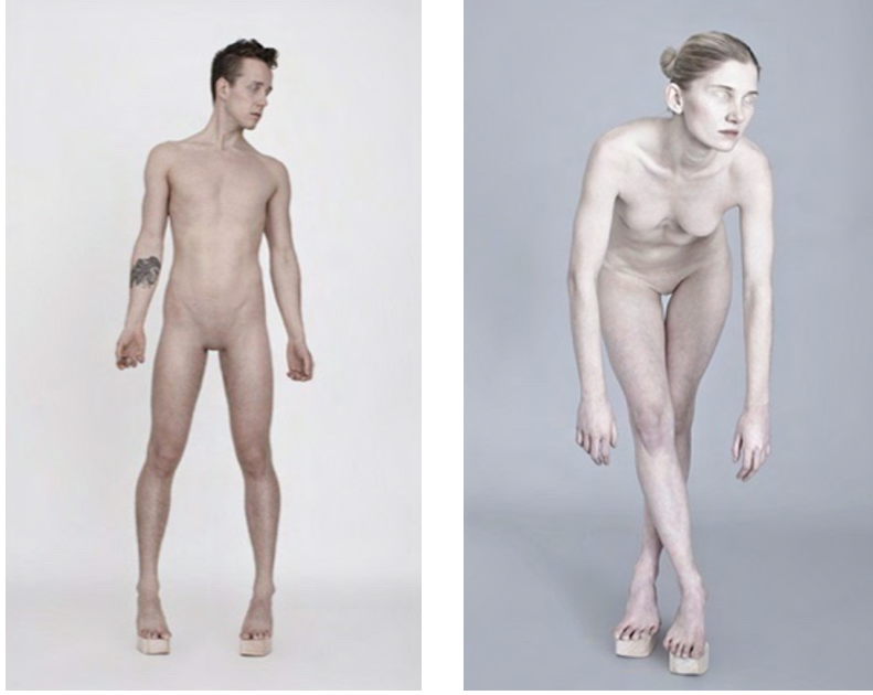
Görsel 7: Georg Mild, Tükenmiş Çıplak, 2012, Dijital Fotoğraf, 120x65cm, Newyork ( https://art-sheep.com/the-sexless-unidentified-figures-of-georg-milde/ ).

Cinsiyetsiz bedenler izleyicide rahatsızlık uyandıran figürler olarak üçüncü bir cinse işaret eder. “Cinsiyetsiz, yani üçüncü cins diye adlandırılan bedenler, toplum tarafından kadına ve erkeğe atfedilmiş toplumsal davranış modellerini de yerinden ederler” (Murat, 2012: 97). Slavoj Zizek Cinsel Olan Politik midir? isimli kitabında bireyin biyolojik cinsiyeti ile toplumsal cinsiyeti ve öznel kimliği arasındaki uyumsuzluk sonucunda, transgenderizmin ortaya çıkacağını ifade eder. Kadınsılığın ve erkeksiliğin dışında gender-kuir konumları içeren karmaşık bu yapının: çift cinsiyetlilik, üç cinsiyetlilik, akışkan cinsiyetlilikten tutun da cinsiyetsizliğe kadar gideceğini belirtir. (Zizek, 2018: 67) Zizek, bunu aynı zamanda postgenderizm olarak adlandırır ve ekler “Toplumsal cinsiyetin biyoteknoloji ve üreme teknolojilerinde kaydedilen son gelişmeler sayesinde gönüllü olarak ortadan kaldırılmasını savunan toplumsal, siyasi ve kültürel bir harekettir bu” (Zizek,2018: 68). Marshall McLuhan ise teknolojiyi bir protez gibi gören organ kesme metaforu ile Zizek ile benzer bir yaklaşım sergiler. Georg Miller’in çalışmalarıyla da örtüşen bu metaforda teknoloji, hadım olma korkusuna sahip beden, görkemli bir şekilde fallik hale gelirken, tektipleşen bedenler cinsel kimliklerinden arınmışlardır. Böylece insani ve karakteristik özelliklerini de kaybederler.