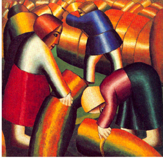
Görşel 2: Kazimir Malevich, Hasat Almak, 1912, Tuval Üzerine Yağlıboya, 94x71.5cm, Amsterdam ( https://www.arthipo.com/tr-tr/kazimir-malevich-hasat-alma.html ).

Teknolojik yeniliklere bağılı olarak sınıf ayrımlarının oluştuğı Rusya'da feodal yaşamın zorlukları belirginleşmiş, 1917 Devrimi'nden sonra ise Marksizm'e yakınlık duyan ve Rusya dışında yaşayan sanatçılar, kapitalizmin acımasız sömürüsüne başkaldırma ihtiyacıyla eserlerini üretmeye başlamışlardır. Fernand Leger'in Mekanik Dönem olarak adlandırılan döneme ait resimlerinden bir olan Kağıt Oynayanlar tablosu Dix'in eserinde olduğu gibi sanatçının savaştan kalan izlenimleri yansıtır. Silindirik formlarla resmedilmiş askerlerin parçalanmış bedenleri, kıyafetleri ve buldukları mekan hepsi bir makinanın parçası gibi resmedilmiştir.