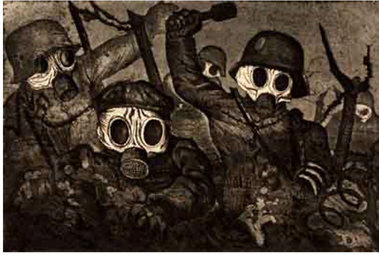
Görsel 1: Otto Dix, Saldırı Kıtası Gaz Altında İlerliyor, 1924, Gravür Baskı 29.1x 19.6 cm, Moma Amerika ( https://arthistoryoftheday.wordpress.com/2011/07/25/otto-dix-stormtroopers-advance-under-cover-of-gas-1924/ ).

Avrupa'nın dünyayı Batılılaştırma ve modernleştirme çabalarının devamında gelen I. Dünya Savaşı, Alman sanatçılar tarafından kültürel bir yenilenme olarak görülmüştür. Bu sanatçılardan bazıları savaşa bizzat katılarak, izlenimlerini eserlerine yansıtmışlardır. Alman dışavurumcu sanatçı Otto Dix Hendek Savaşı anılarını Der Krieg (Savaş) isimli gravür baskı resim serisine dönüştürmüştür. Dix, Saldırı Kıtası Gaz Altında İlerliyor gravüründe gaz saldırısında düşman hattı boyunca ilerleyen, yüzleri gaz maskeli beş askeri tasvir etmiştir.