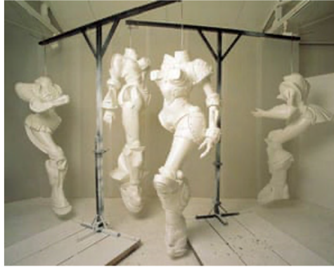
Görsel 11: Lee Bul, Siborg W1-W4, 1998, Enstalasyon Karışık Teknik, Kore ( https://www.theguardian.com/artanddesign/2018/may/28/cyborgs-gorgeous-art-lee-bul-south-korean-artist-seoul ).

Bul, cyborg heykelleri ve enstalasyonlarında, distopik hikayeler, bilimkurgu filmleri, ütöpik rüyalar ve sosyal eleştirilerden esinlenmektedir. Sanatçı çalışmalarında, bedenlerimizi iyileştirmek veya toplumu yeniden oluşturabilmek için, zarar verici nitelikteki mükemmellik arayışımızı incelemektedir. Heykelleri görkemli olmakla, grotesk olmak arasında gidip gelmektedir. Siborgları kendi kendini üretebilir hale getirme çabalarımız, sanatçıyı etkileyen ve çalışmalarına yansıyan bir durumdur. Bu ironik durumu şöyle ifade etmektedir: “Mükemmeliğin peşine düşüp, beceremeyip, korkup sonra da ona canavar diyoruz. Ama yine de deniyoruz, çünkü bu bizim insani kaderimiz” 6 . Sanatçı, yanlış giden bir genetik deneyi andıran anagram heykellerinde böcek, bitki ve deniz yaşamının karışımını andıran başsız bedenler sunmakta ve bu heykellerle, siborgun sanal düzlemle organik yaşam arasındaki var olma sürecini yansıtmaya çalışmaktadır.