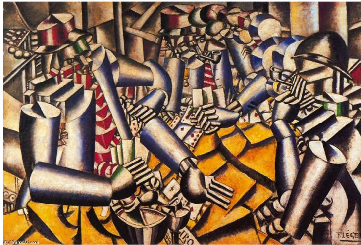
Görşel 3: Fernand Leger, Kağıt Oynayanlar, 1917, Tuval Üzerine Yağlıboya, 193x129cm, Tate Modern Müzesi, Londra ( https://www.tate.org.uk/art/artists/fernand-leger-1488/five-things-know-about-fernand-leger ).

Bu biçimsel ifadedeki benzerlikler, beden-nesne ayrımını yapabilmeyi zorlaştırmaktadır. Ayrıca Leger, katı soyut geometrik biçimciliğı öne alarak resimlerini: deri, göz, ağız, burun gibi tüm uzuvlarından arındırmıştır. Bu, modernizm ile birlikte derinin yalnızca, kişinin diğerkleriyle kendisi arasına çizdiği bir sınır haline geldiğini göstermektedir. Batılı ve modern beden, "diğerk bedenlerden net çizgilerle ayrılmış, kendi derisinin sınırları içinde güven altına alınmış düzenli bir bedendir" (Çabuklu, 2004: 98). Leger'in Kağıt Oynayanlar resminde de beden, disiplin altına alınması ve kontrol edilmesi gereken bir nesne haline gelmiştir. Yeni gerçekçiliğın kökeninin modern yaşamın bizzat kendisi olduğunu düşünen sanatçılar eserlerinde zinde, güzel ve ölümsüz olanı, sert, mekanik kütleli formlarla ifade etmişleridir.