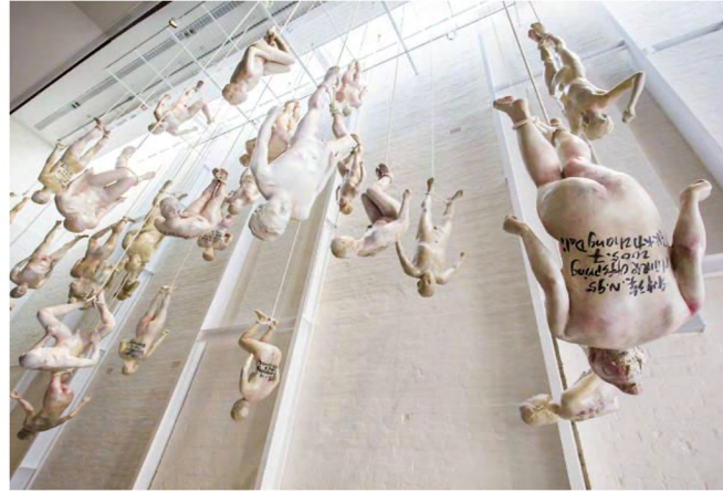
Görsel 6: Zhang Dali. Çinli Çocuklar, 2005, Reçine, 30 parça Farklı Ölçülerde Heykel, White Rabbit Galerisi, Sydney ( https://thestandardstore.com.au/blogs/news/standard-city-guide-sydney ).

Vanessa Beecroft'un moda fotoğraflarına dönüşen performansları, izleyiciyi bir nevi röntgenci konumuna getirerek, konfor alanını sorgulamaktadır. Beecroft'un çalışmaları güzellik yarışmalarında, podyumda, reklamlarda ve filmlerde postmodern cinsellik ve temsil siyaseti üzerine bir diyalogu canlandırmaktadır. Sanatçı modanın küresel giyim şekline dönüşmesini ve tektipleşmiş ikonik kadın bedenini, steril bir ihtişamla yansıtmaktadır.