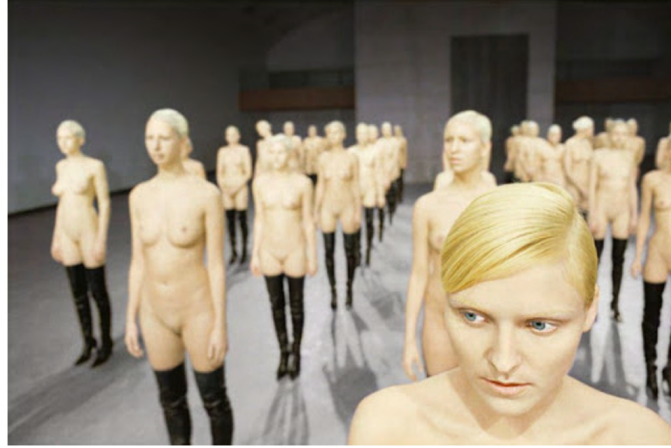
Görsel 5: Vanessa Beecroft, ALI, 2001, Dijital Fotoğraf, 160x127cm, Ion Soledad Lorenzo Koleksiyonu, İtalya ( https://www.carolinesmulders.art/vanessa-beecroft-04/ ).

Vanessa Beecroft'un moda fotoğraflarına dönüşen performansları, izleyiciyi bir nevi röntgenci konumuna getirerek, konfor alanını sorgulamaktadır. Beecroft'un çalışmaları güzellik yarışmalarında, podyumda, reklamlarda ve filmlerde postmodern cinsellik ve temsil siyaseti üzerine bir diyalogu canlandırmaktadır. Sanatçı modanın küresel giyim şekline dönüşmesini ve tektipleşmiş ikonik kadın bedenini, steril bir ihtişamla yansıtmaktadır.