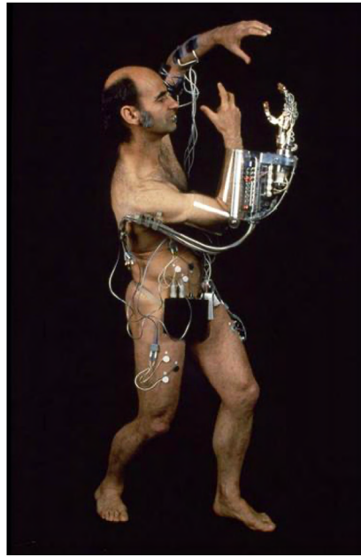
Görsel 8: Stelarc, Üçüncü El, Performans, 1980, Yokohama ( http://stelarc.org/?catID=20265 ).

Siborg bedenlerde toplumsal ve biyolojik cinsiyete dair sınırlılıkların ortadan kalktığı, toplumsal davranış rollerinin keskinliğinin kaybolduğu, insan bedeninin robotlaştığı ve robotların insanileştiği görülmektedir. Bu anlamda siborg sanat alanında çalışmalarını üreten sanatçılar hem maddi bir ontolojik gerçeklik, hem de bir hayal ürünü sunmaktadır. Özellikle performans sanatında sıklıkla karşımıza çıkan siborg sanatı, bir nevi insan sonrası sanat olarak da adlandırılmaktadır. Siborg sanatında sanatçının stratejisinin, bedeni, fiziksel ve teknik olarak güçlendirmek üzerine kurduğu iddia edilir (Şangüder, 2016: 10). Siborg sanatında dikkat çeken bir diğer önemli nokta ise, insan bedenlerinin yine insan yapımı materyaller tarafından donatılmış olmalarıdır.