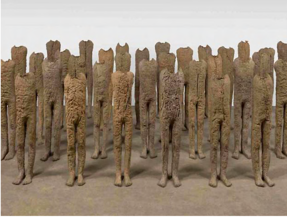
Görsel 4: Magdalena Abakanowicz, Çocuklar 2015, Çuval bezi ve Reçine, 170x53x22cm, Venedik Georgio Vakfı, İtalya ( https://www.marlboroughgallery.com/artists/magdalena-abakanowicz/ ).

Modernizm sürecinde tektipleşme, toplumdaki belirsizliği karşıt görüşleri, itirazları ve isyanların gerçekleşme ihtimalini yok ederek, bir güven ve bilinirlik ortamı sağlamaktadır. Zygmunt Bauman biyolojik bir terim olan asimilasyon kavramının yeni modern ulus devletlerindeki karşılığının tektiplilik güdüsü olduğunu düşünmektedir. Bu güdü, yakında ortaya çıkabilecek olan farklılığa tahammülsüzlüğün ayak sesleridir (Bauman, 2003: 139). Bauman'ın bu görüşünün çağdaş sanattaki yansımalarından biri de Magdalena Abakanowicz'in Çocuklar isimli eseridir.