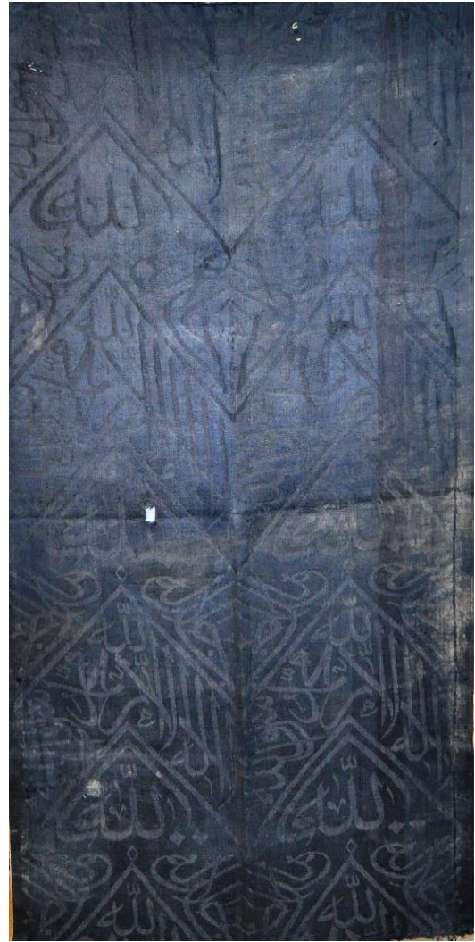
Fotoğraf: 8. 4.6.40 Envanter Numaralı Kisve-i Şerife örtüsü.

Açıklama: Genel olarak dokuma kondisyonu fazla yıpranmamıştır. Kumaşın bazı bölgelerinde sökülmeler ve yırtılmalar oluşmuştur. Sökülen bölgelerdeki çözgü ve atkı