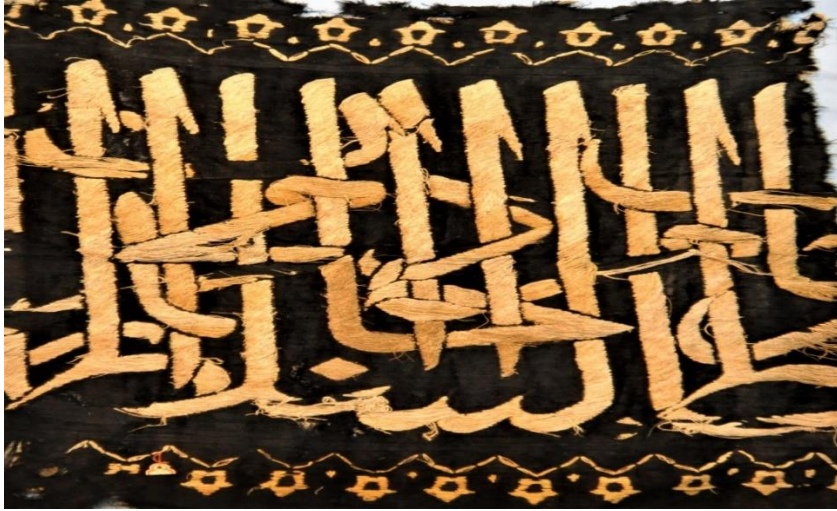
Fotoğraf: 10. 4/7/40 Envanter Numaralı Kisve-i Şerife Kuşağı- Kabetullah Kemerini- Nitak