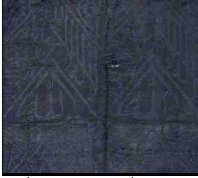
Fotoğraf: 9. Selin İpek, Kisve-i Şerife örtüsü, İBB Envanter Numarası: 684.