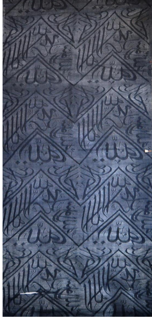
Fotoğraf: 7. 4.5.40 Envanter Numaralı Kisve-i Şerif örtüsü.