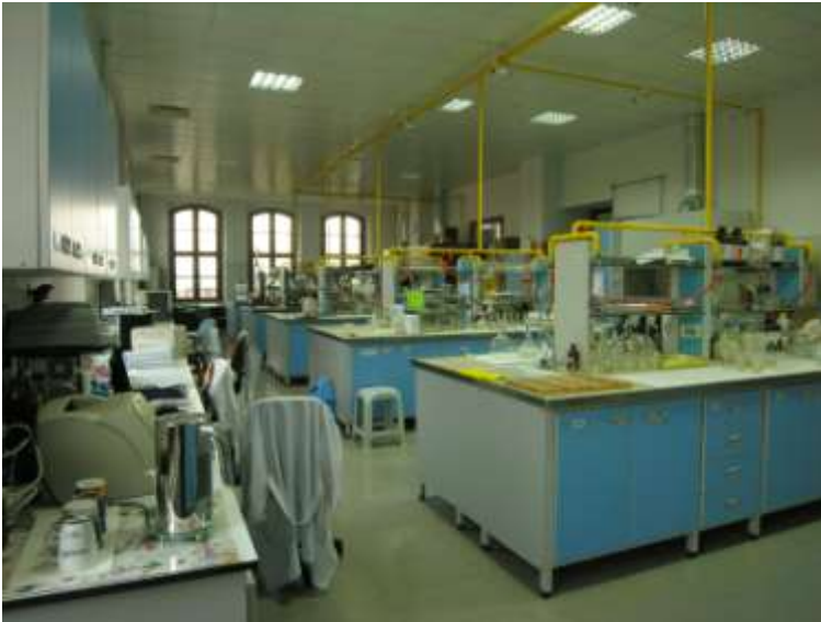
Farmakognozi Anabilim Dalı araştırma laboratuvarı