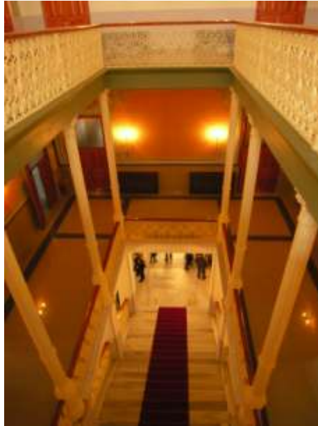
İ.Ü. Eczacılık Fakültesi A Blok (Keçecizade Fuad Paşa Konağı) giriş merdivenlerinin ve birinci katının, ikinci kattan görünümü.