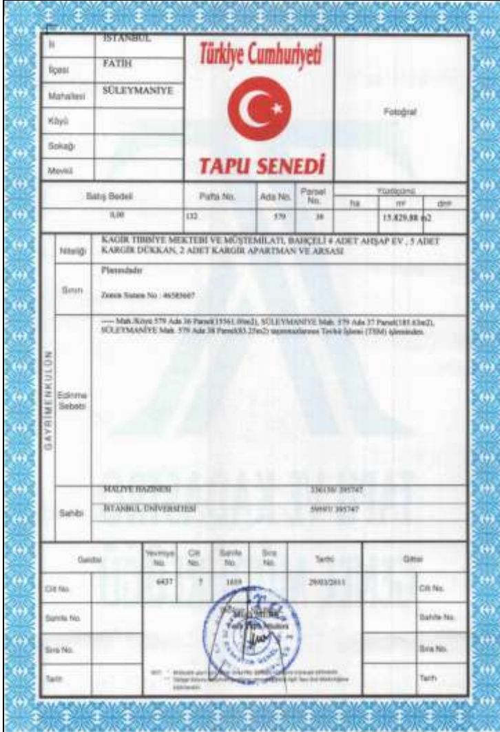
İstanbul Üniversitesi Eczacılık Fakültesi'nin tapusu

İ.Ü. Eczacılık Fakültesi'nin tarihi binasının resmi açılışından yaklaşık dört ay sonra, Eczacılık Fakültesi, uzun süren tevhid işlemlerinin tamamlanması neticesinde, tapu senedine kavuşmuştur. 29 Mart 2011 tarihli tapu senedine göre, Eczacılık Fakültesi, Fatih ilçesi Süleymaniye Mahallesi Ada 579 , Parsel 39 üzerinde yaklaşık 16.000 m2 alanı kaplamaktadır. Gayrimenkulün niteliği, sened üzerinde "Ka[r]gir Tıbbiye Mektebi ve Müştemilatı, bahçeli 4 adet ahşap ev, 5 adet kargir dükkan, 2 adet kargir apartman ve arsası" olarak belirtilmiştir.