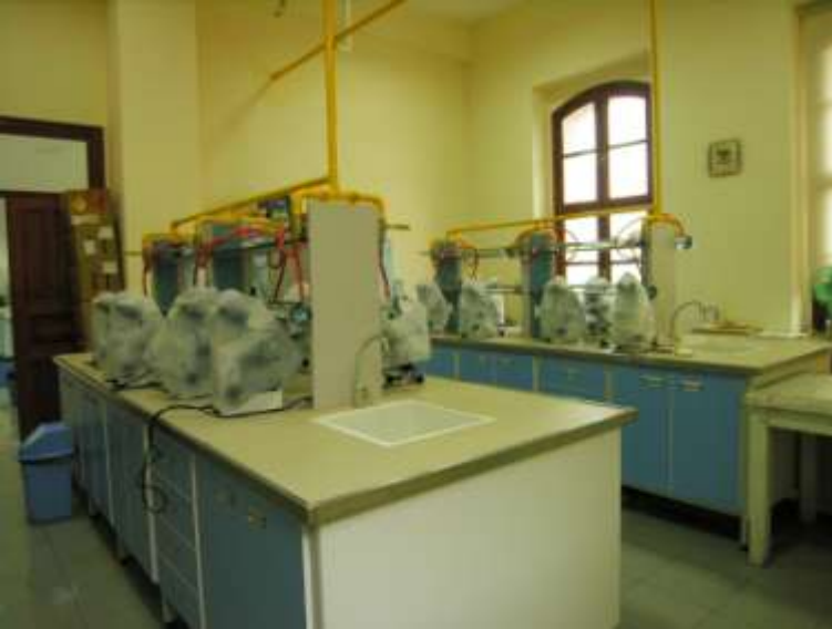
Farmakognozi Anabilim Dalı mikroskopi laboratuvarı