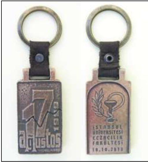
Eczacılık Fakültesi tarihi binasının açılışında (19.12.2010) dağıtılan anahtarlık