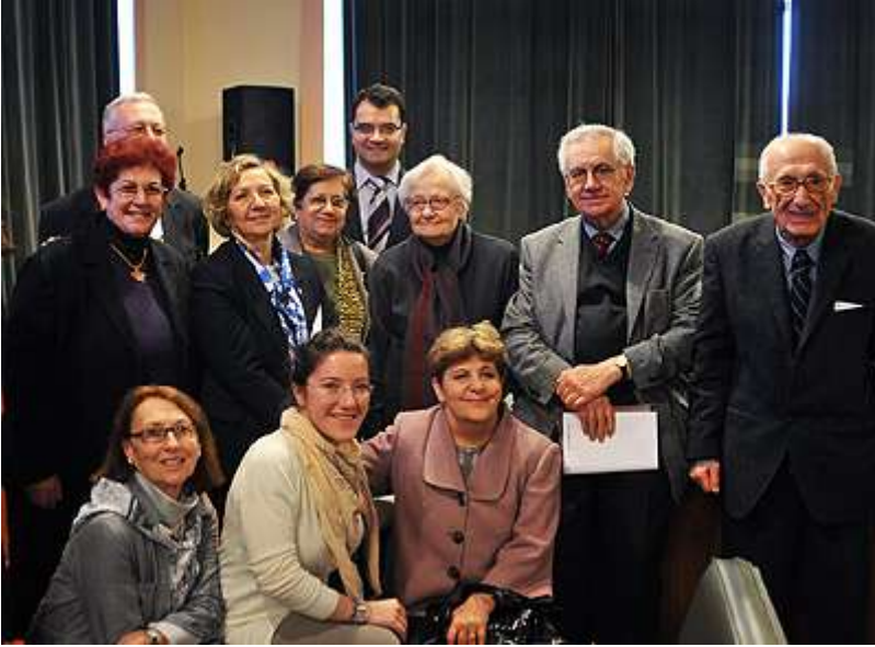
“Asuman Baytop Armağanı” Takdim Toplantısı'ndan bir anı, 24.02.2011