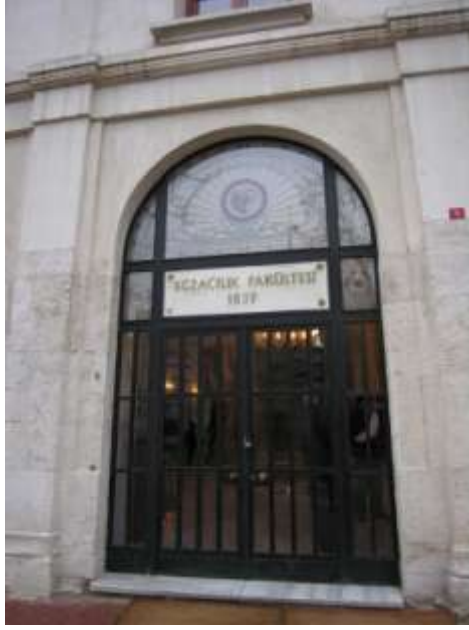
İ.Ü. Eczacılık Fakültesi A Blok (Keçecizade Fuad Paşa Konağı) giriş kapısı. Kapının üzerindeki 1839 tarihi, Mekteb-i Tıbbiye-yi Şahane içinde Eczacı Sınıfı'nın kuruluş tarihidir.