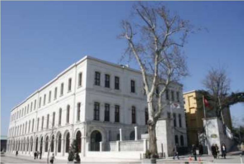
İ.Ü. Eczacılık Fakültesi tarihi binasının (Keçecizade Fuat Paşa Konağı = A Blok) restorasyondan sonraki görünümü (2011).