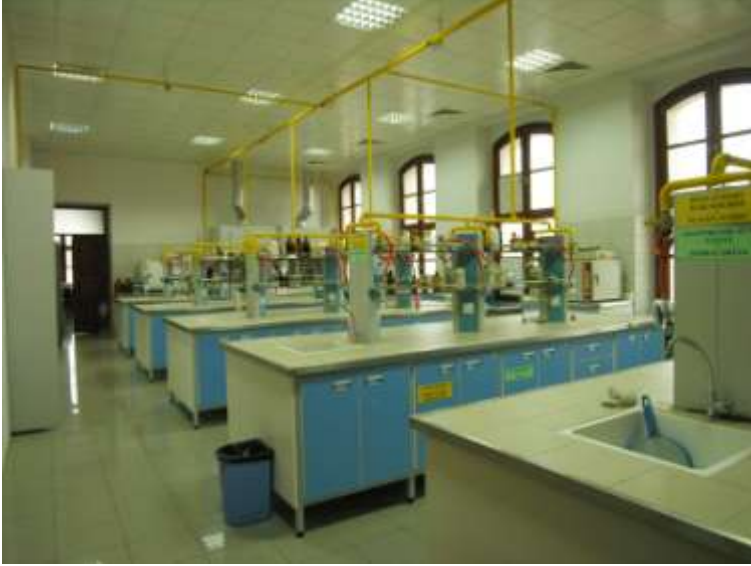
Farmakognozi Anabilim Dalı öğrenci laboratuvarı