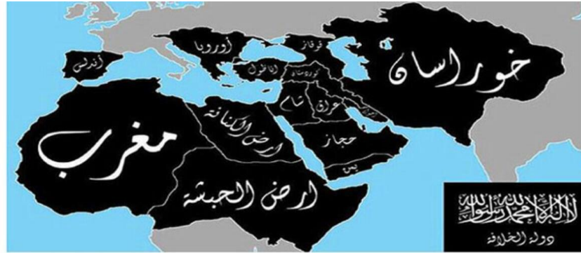
Şekil 2. IŞİD'in Potansiyel Olarak Kendisine Ait Olduğunu İleri Sürdüğü Bölgeler