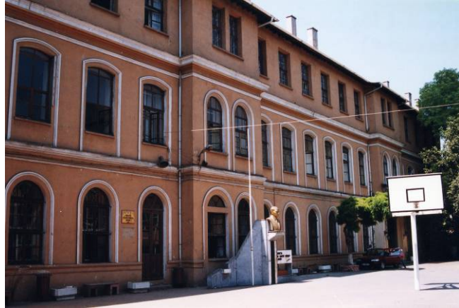
Darülfünun-ı Şahane’nin (1900) açıldığı ve bugün Çağaloğlu Anadolu Lisesi’ni barındıran bina.

Bu notu aldıktan sonra, bize iki yıl önce, Darülfünun’un bugün Eminönü Belediye Başkanlığı tarafından kullanılan binada açıldığını söylemiş olan ve bugün 80 yaşını aşmış olan kişiyle yeniden görüştük. Kendisi bu bilgiye teyit etmekte tereddüt etti. Bunun üzerine makalemizdeki yanlış bilgiyi düzeltmek için, A. Baltacıoğlu’nun notunu yayımlamak ve okuyuculara verdiğimiz yanlış bilgiyi düzeltmek istedik. Sonuç olarak, 1900 Darülfünunu’nun bugün Çağaloğlu Anadolu Lisesi’ni barındıran eski Mekteb-i Mülkiye binasında açıldığını söyleyebiliriz.