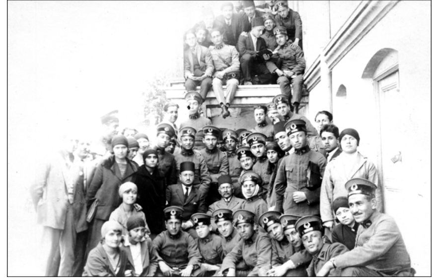
Tıbbiye'nin ilk F.K.T (P.C.N.) öğrencileri Zeynep Hanım Konağı'nda (1924) 43