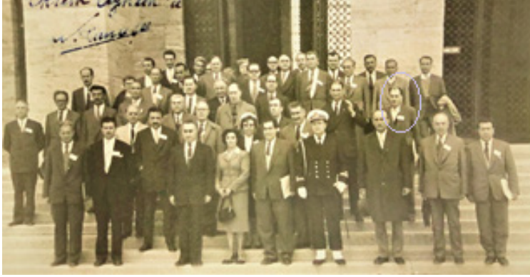
Kızılay Heyeti ile Anıtkabir Ziyareti, 27 Nisan 1961