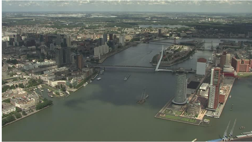
Şekil 3. Erasmus Köprüsü ve Kop van Zuid.

Proje, doğrudan kentin gelişiminin her yönüyle seçmeninden sorumlu olan Rotterdam Kent Konseyi tarafından yürütülmektedir. Çok sayıda farklı belediye departmanı (arazi sahibi Rotterdam Şehir Geliştirme İşletmesi, Planlama ve Konut Dairesi, Rotterdam Ulaştırma Şirketi, Kamu İşleri Dairesi ve Liman Yetkilileri) projeye dahildir. Proje bir iletişim ekibi ile bir karşılıklı fayda ekibi içeren özel bir proje ekibi tarafından koordine edilmektedir. Proje Yöneticisi, geliştirme önerilerini sağlayan ve tasarımın her alanında tavsiyede bulunan dış kalite ekibini de denetleyen bir konsey yönetim kuruluna karşı sorumlu durumdadır.