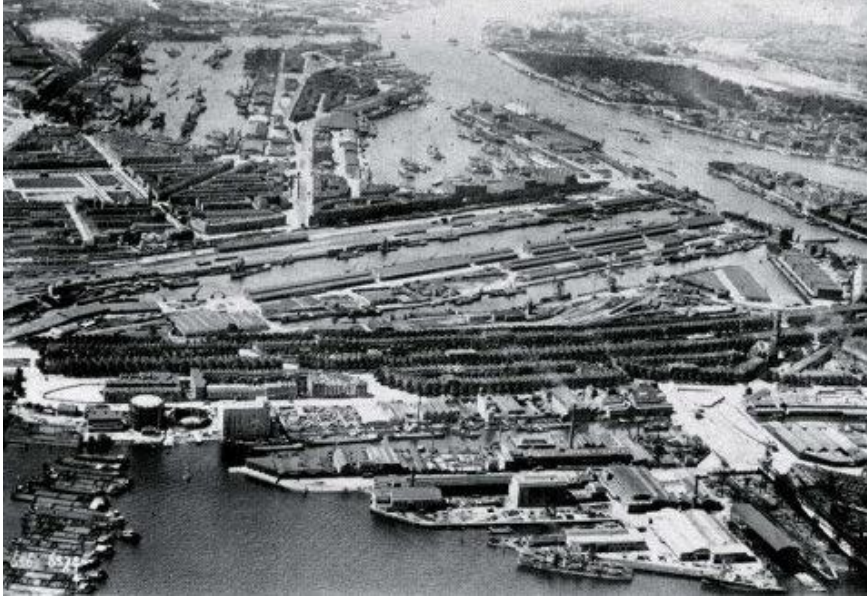
Şekil 2. Kop van Zuid.

Kop van Zuid'i yeniden yapılandırma projesi hem karmaşık hem de iddialıydı. Güçlü sosyal ve ekonomik ve fiziksel hedefleri vardı. Amacı sadece terk edilmiş bir liman alanını dönüştürmek değil bir bütün olarak Rotterdam'ı değiştirmektir. Projenin amaçları kısaca şu şekilde listelenebilir: