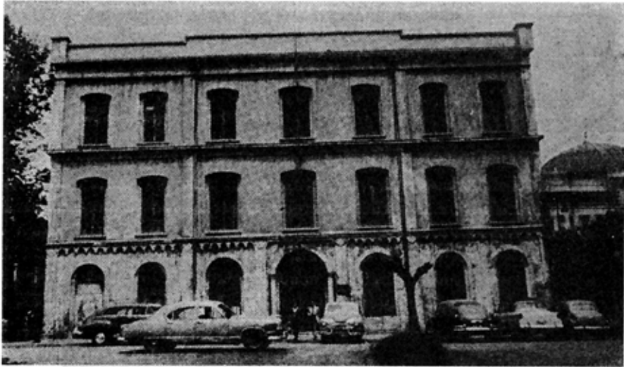
Resim 3: 1926-1959 yılları arasında Eczacı ve Dişçi mekteplerinin çalıştığı Beyazıt Meydanı'ndaki Jandarma Komutanlığı binası.