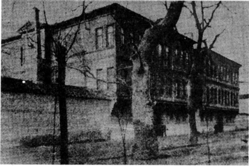
Resim 2: 1908 yılında açılan Eczacı Mekteb-i Alisi'nin 18 yıl çalıştığı Kadırga Cinci Meydanı'ndaki Sivil Tıbbiye binası (Besim Ömer [Akalin], Nevsal-i Afiyet , c.1, İstanbul 1315 / 1897, s.72).