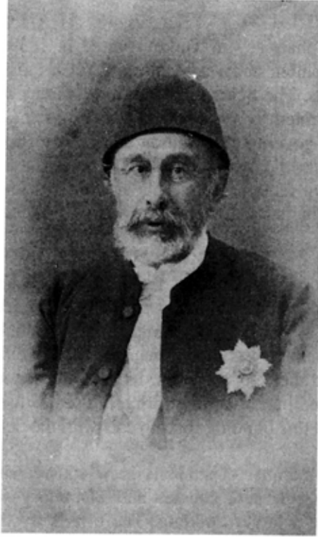
Resim 6: Sadrazam Keçecizade Dr. Fuad Faşa (1815-1869).