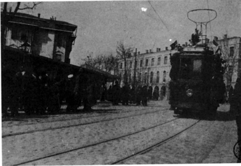
Resim 5: Eczacılık Fakültesi'nin 1959 yılından itibaren yer aldığı Keçecizade Dr. Fuad Paşa Konağı'nın Maliye Nezareti iken 4 Mayıs 1914'te çekilmiş fotoğrafı.