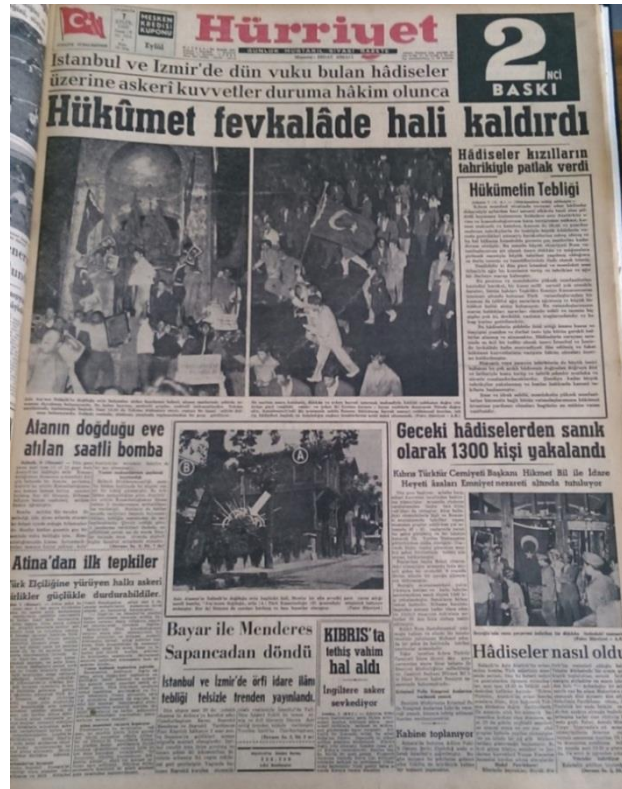
Resim 5. (Hürriyet, 1955c: 1)

“Hadiseler kızılıların tahrikiyle patlak verdi” başlığının altında Hükümetin Tebliği’ne yer verilmiştir: