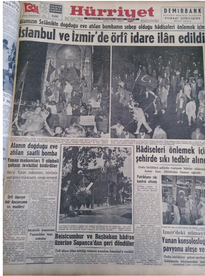
Resim 2. (Hürriyet, 1955b: 1)

maksadiyle İstiklal caddesine doğru yürüyüşe geçti ve yolun iki kıyısını kırmızı-beyaz renklerle donatarak Tünele doğru aktı. Asmalımescit'teki bir eczanenin sahibi bir Rumun, dükkânına bayrak asmayı reddetmesi üzerine tahrip hadiseleri başladı ve kalabalığın coşkun tezahürlerine artık mani olunamadı (Hürriyet, 1955b: 1).