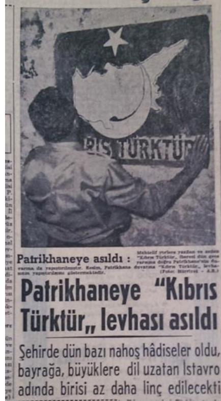
Resim 1. (Hürriyet, 1955a: 1)

“Patrikhaneye ‘Kıbrıs Türktür’ levhası asıldı” başlıklı haberin spotunda “Şehirde dün bazı nahoş hadiseler oldu, bayrağa, büyüklere dil uzatan İstavro adında birisi az daha linç edilecekti” cümlesine yer verilmiştir. “Kıbrıs meselesi Türkiye tarafından ciddiyle ele alındıktan ve Londra’da üçlü konferans başladıktan sonra şehrimizde de bazı hadiseler olmağa başlamıştır” cümlesiyle başlayan ve içeriğinde “Teşvikiye’de bir duvar üzerine çizilen bir Kıbrıs haritasının ve üzerindeki ‘Kıbrıs Türktür’ ibaresinin bir Rum tarafından silinmesi de bütün şehirde nefretle karşılanmıştır” cümlesinin yer aldığı haberde, Türk ve Rum vatandaşlar arasında yaşanan hatta linç varan tartışmalara yer verilmiştir. Resim 1’de yer alan görselin alt yazısında ise “Muhtelif yerlere yazılan ve asılan ‘Kıbrıs Türktür’ ibaresi dün gece yarısına doğru Patrikhane’nin duvarına da yapıştırılmıştır. Resim, Patrikhane duvarına ‘Kıbrıs Türktür’ levhasının yapıştırılmasını göstermektedir” cümleleri kullanılmıştır (Hürriyet, 1955a: 1).