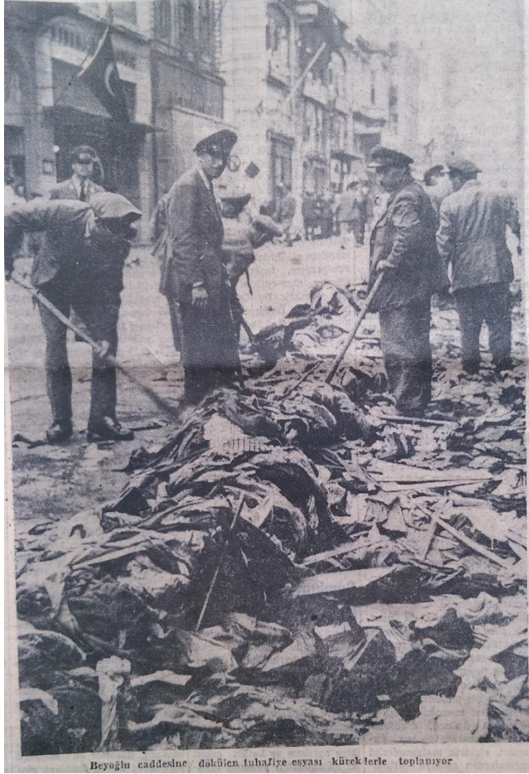
Resim 21. (Akşam, 1955: 1)

Kıbrıs Türktür Cemiyeti Genel İdare Kurulu yaptığı toplantı sonunda uzun bir açıklama yayınlamıştır. Dört maddelik açıklamanın son cümleleri “Kıbrıs Türktür, Türk kalacaktır, bunun aksini kim düşünüyor ve yemini bozmaya çalışıyorsa nerede olursa olsun hareketinin hesabını çok pahalıya ödeyecektir” (Akşam, 1955: 2) şeklindedir.