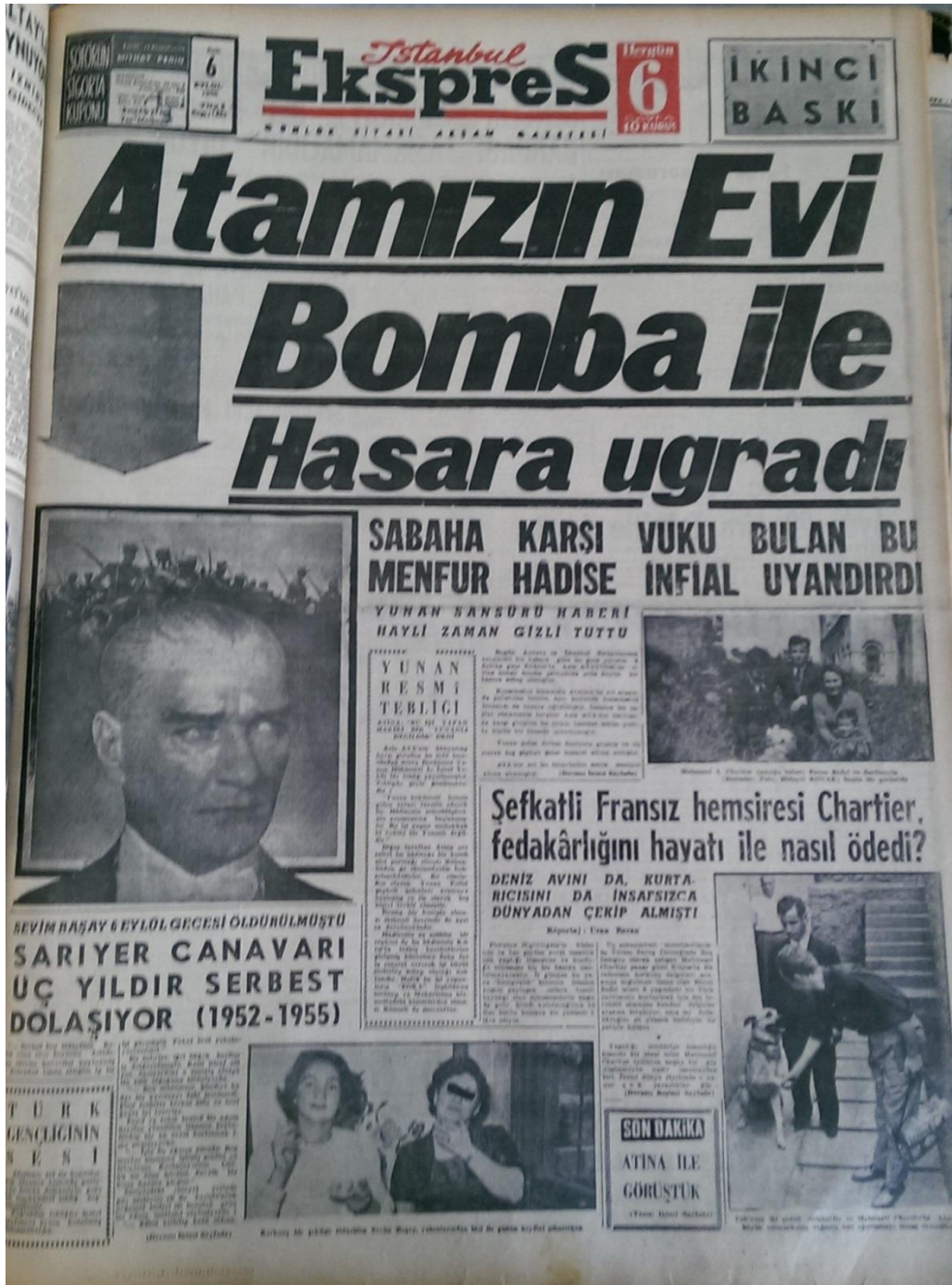
Resim 6. (İstanbul Ekspres, 1955b: 1)

Manşet haberde olaya dair ilk açıklamalar şu şekilde verilmiştir: