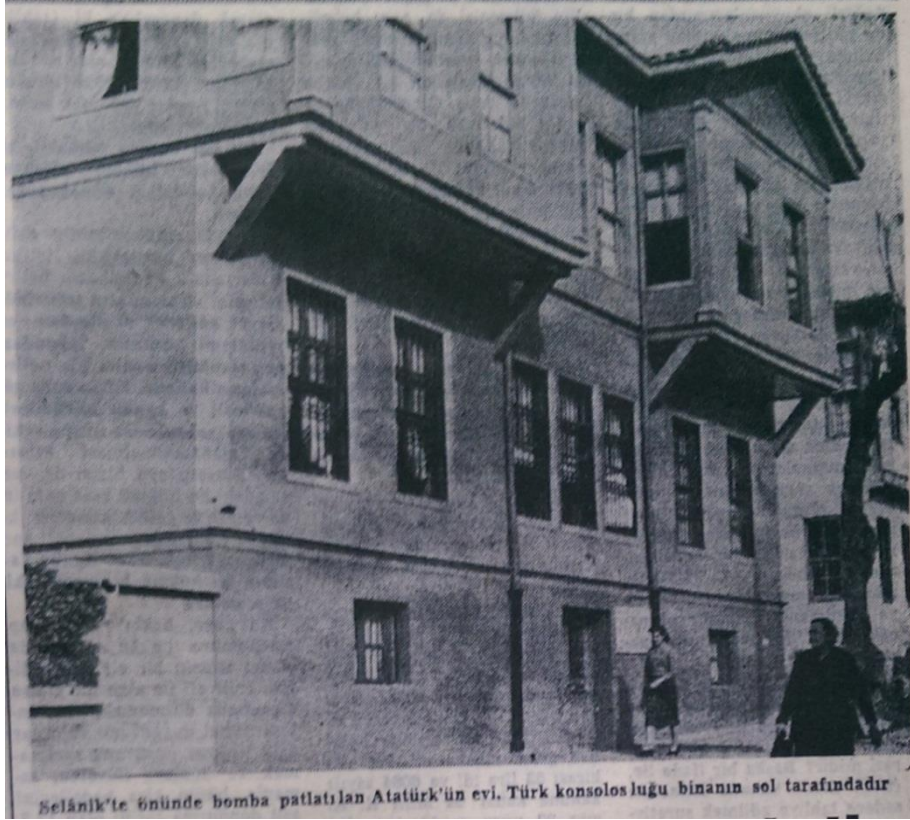
Resim 17. (Vatan, 1955b: 1)

Atatürk'ün evi Selânik'te Kulekahveleri semtindedir. Ev Türk Başkonsolosluğu ile bir bahçe içindedir. Bahçe yoluyla birinden ötekine geçmek mümkündür. Ev 3 katlıdır. Kapısında türkçe, fransızca ve elence olarak yazılmış şu kitabe vardır: Türk milletinin büyük müceddidi ve Balkan ittihadının müzahiri Gazi Mustafa Kemal burada dünyaya gelmiştir. İşbu levha Türkiye Cumhuriyetinin onuncu yıldönümü münasebetiyle konulmuştur. Selânik, 29 Birinciteşrin 1933. Kulekahvelerinde eskiden Türk nüfusu otururdu. Şimdi buraya mübadiller yerleştirilmiştir (Vatan, 1955b: 1).