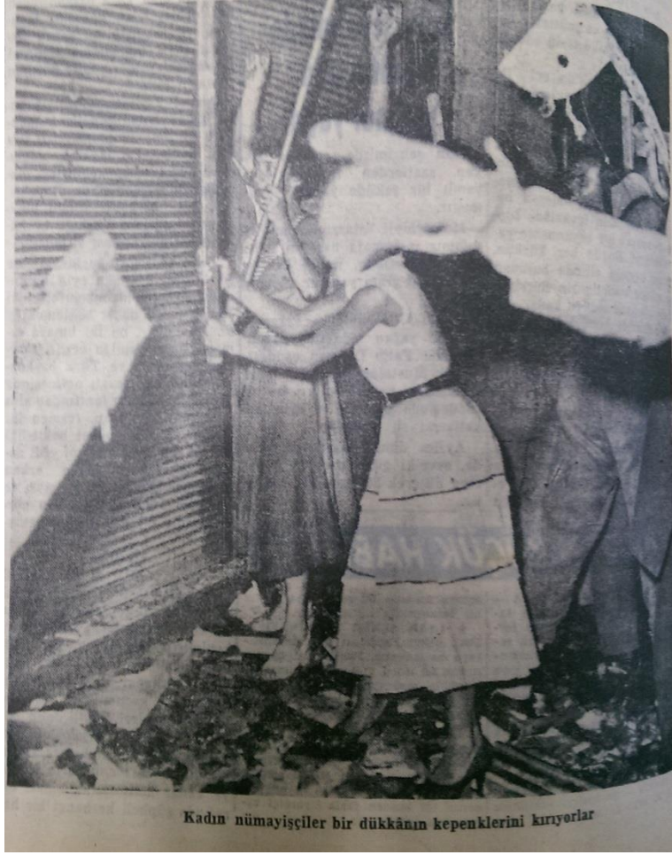
Resim 19. (Vatan, 1955b: 8)

İlgili haberin fotoğraf altı yazısında “Kadın nümayişçiler bir dükkânın kepenklerini kırıyor” (Vatan, 1955b: 8) cümlesine yer verilmiştir.