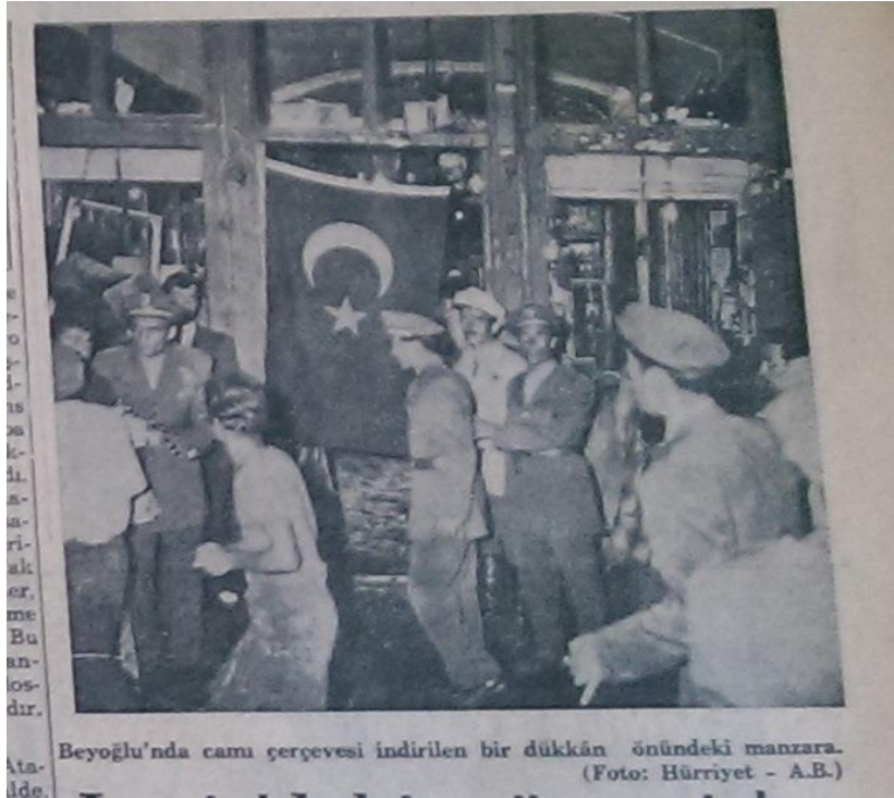
Resim 4. (Hürriyet,1955b: 1)