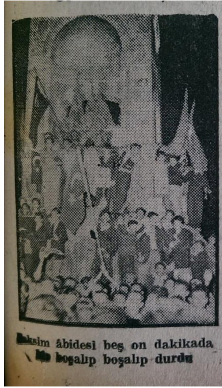
Resim 13. (İstanbul Ekspres, 1955c: 1)

“Taksim abidesi beş on dakikada boşalıp boşalıp durdu” (İstanbul Ekspres, 1955c: 1)