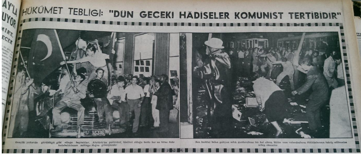
Resim 9. (İstanbul Ekspres, 1955c: 1)

“Hükümet Tebliği: ‘Dün geceki hadiseler komünist tertibidir’ başlığının kullanıldığı fotoğrafların alt yazısında “Gençlik yukarıda görüldüğü gibi elinde bayraklar, Atatürk’ün portreleri, büstleri olduğu halde her an biraz daha kalabalıklaşan mitinge doğru gitmişlerdir” ve “Son haddini bulan galeyan artık durdurulmaz bir hal almış, bütün Rum vatandaşlarının dükkânlarının tahrip edilmesine sebep olmuştur” (İstanbul Ekspres, 1955c: 1) cümleleri kullanılmıştır.