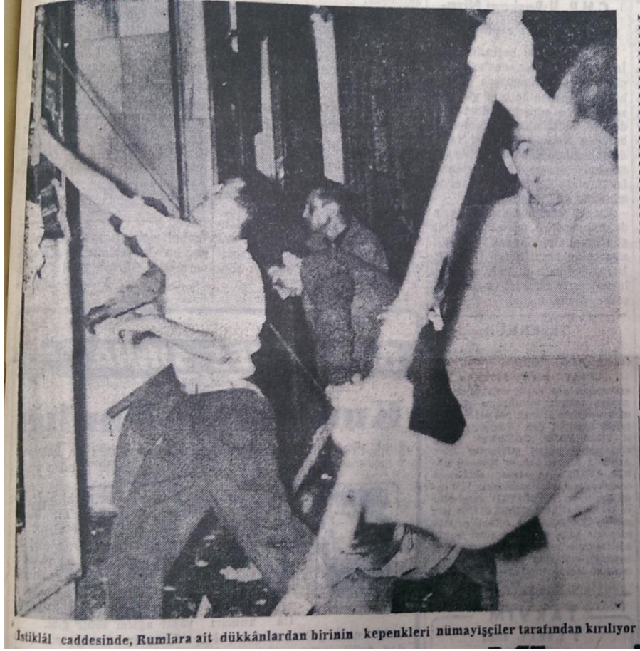
Resim 16. (Vatan, 1955b: 1)

“Selânik’te Ata’mızın evi ile Konsolosluga bomba atıldı” başlıklı haberin spotu “Bombalar, bina önünde nöbet bekleyen Yunan polislerinin önünde konuldu. Tutulan beş kişi serbest bırakıldı” (Vatan, 1955b: 1) cümleleriyle verilmiştir.