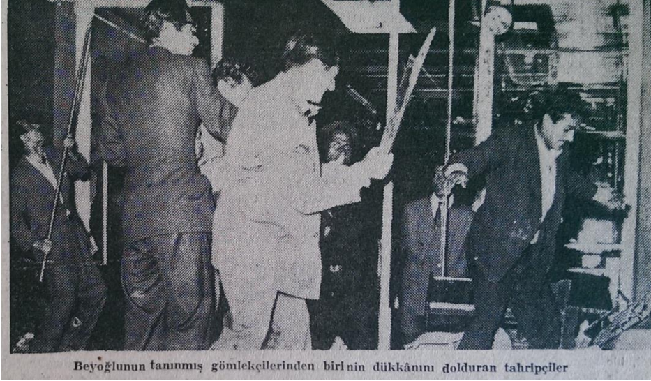
Resim 11. (İstanbul Ekspres, 1955c: 1)

“Beyoğlunun tanınmış gömlekçilerinden birinin dükkânını dolduran tahripçiler” (İstanbul Ekspres, 1955c: 1).