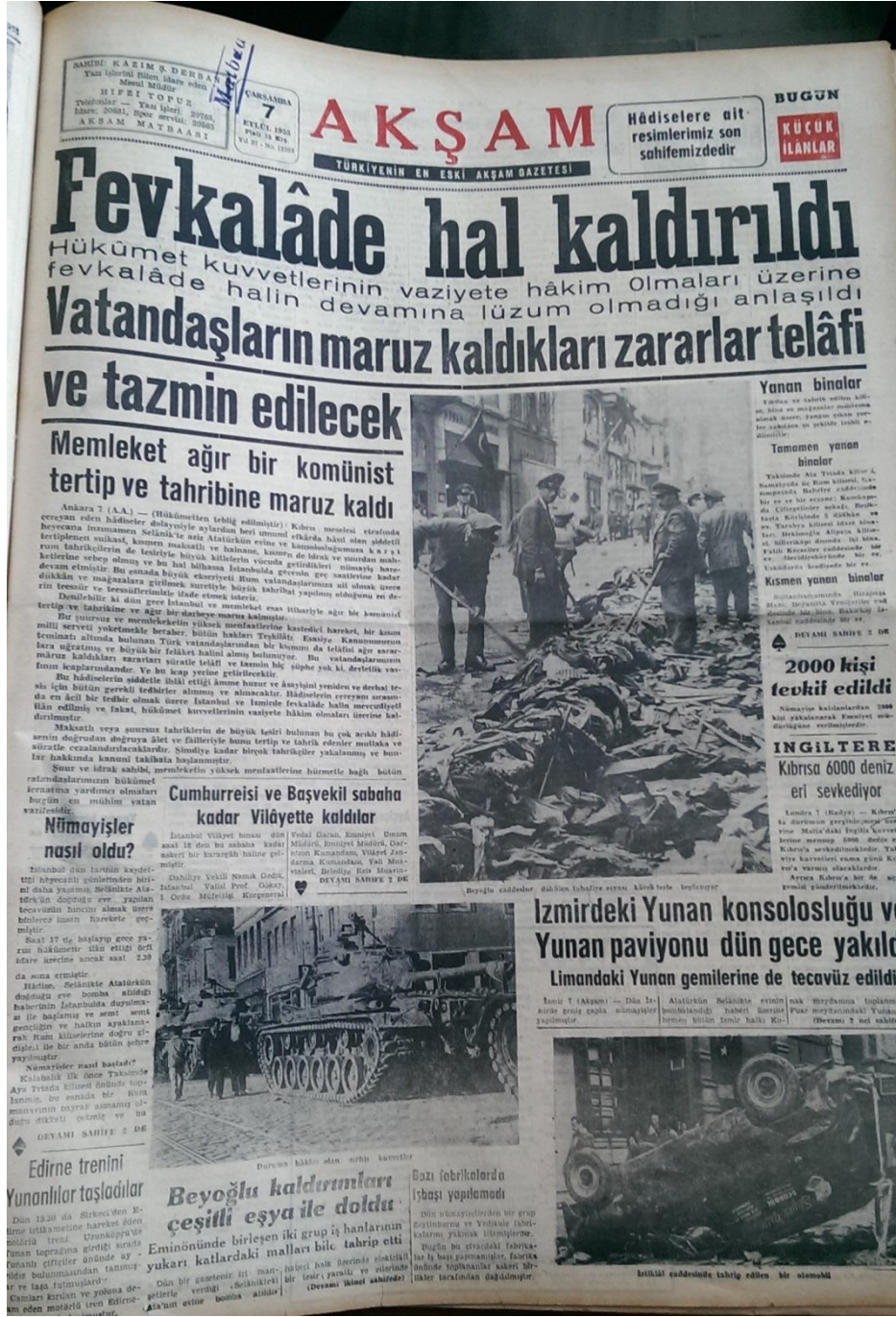
Resim 20. (Akşam, 1955: 1)