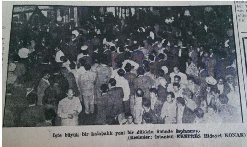
Resim 14. (İstanbul Ekspres, 1955c: 1)

“Taksim abidesi beş on dakikada boşalıp boşalıp durdu” (İstanbul Ekspres, 1955c: 1)