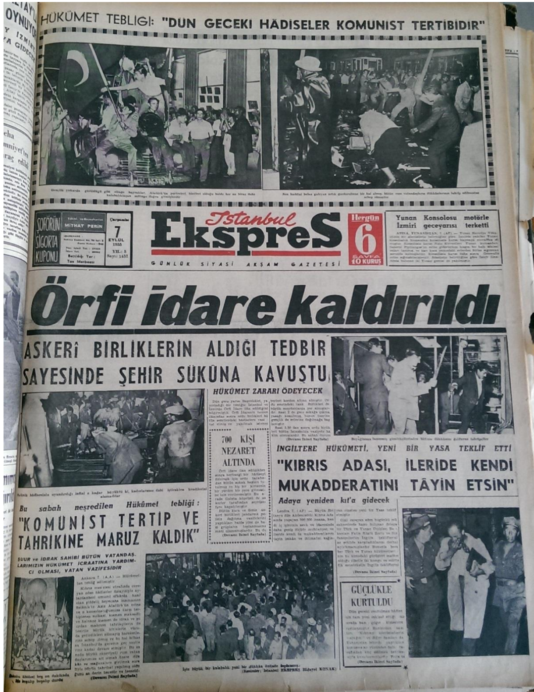
Resim 8. (İstanbul Ekspres, 1955c: 1)