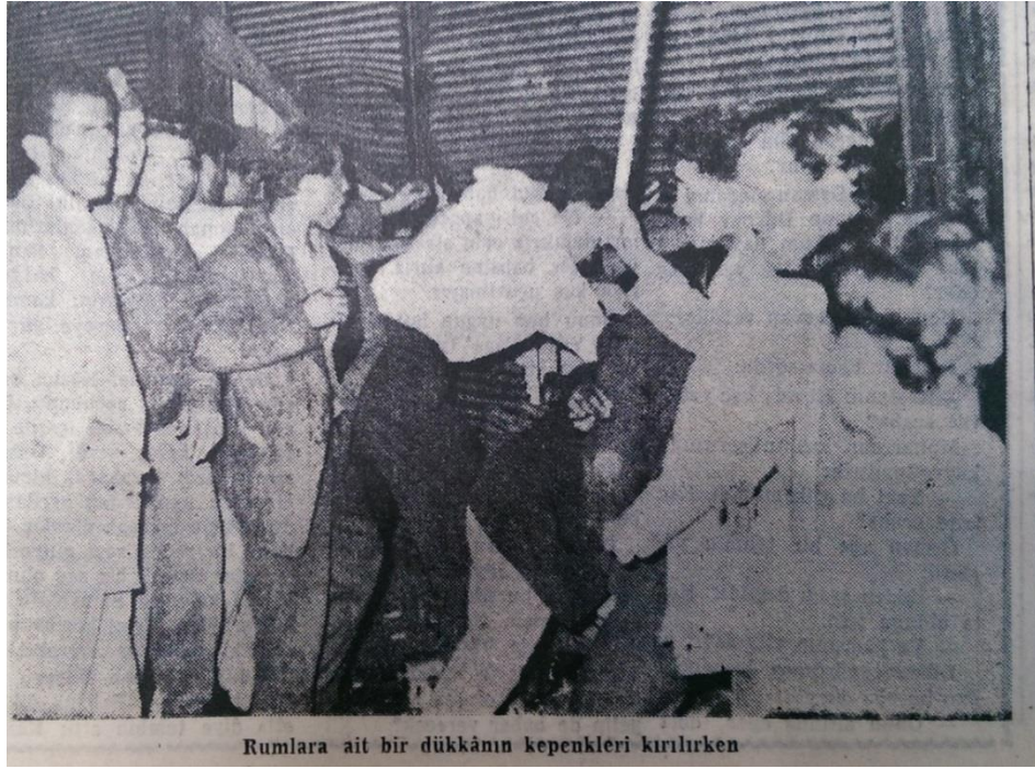
Resim 18. (Vatan, 1955b: 1)

“Sıkıyönetimin ilânını müteakip askeri kuvvetler evvela Beyoğlu semtinde vaziyete hakim olmaya başlamışlardır. Fakat tahrikçi ve yağmacı gruplarının hareketleri o kadar müessir olmuştur ki dalga dalga kenar muhitlere saldıran gruplar, en ufak bir mukavemetle karşılaşmamış ve tahribata devam etmişlerdir” (Vatan, 1955b: 8).