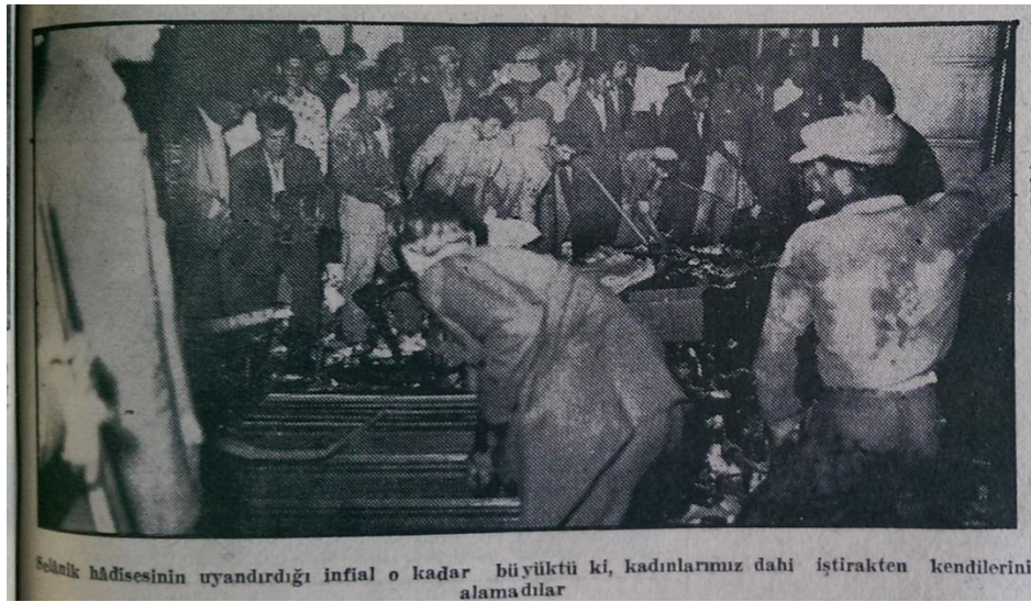
Resim 10. (İstanbul Ekspres, 1955c: 1)

“Hükümet Tebliği: ‘Dün geceki hadiseler komünist tertibidir’ başlığının kullanıldığı fotoğrafların alt yazısında “Gençlik yukarıda görüldüğü gibi elinde bayraklar, Atatürk’ün portreleri, büstleri olduğu halde her an biraz daha kalabalıklaşan mitinge doğru gitmişlerdir” ve “Son haddini bulan galeyan artık durdurulmaz bir hal almış, bütün Rum vatandaşlarının dükkânlarının tahrip edilmesine sebep olmuştur” (İstanbul Ekspres, 1955c: 1) cümleleri kullanılmıştır.