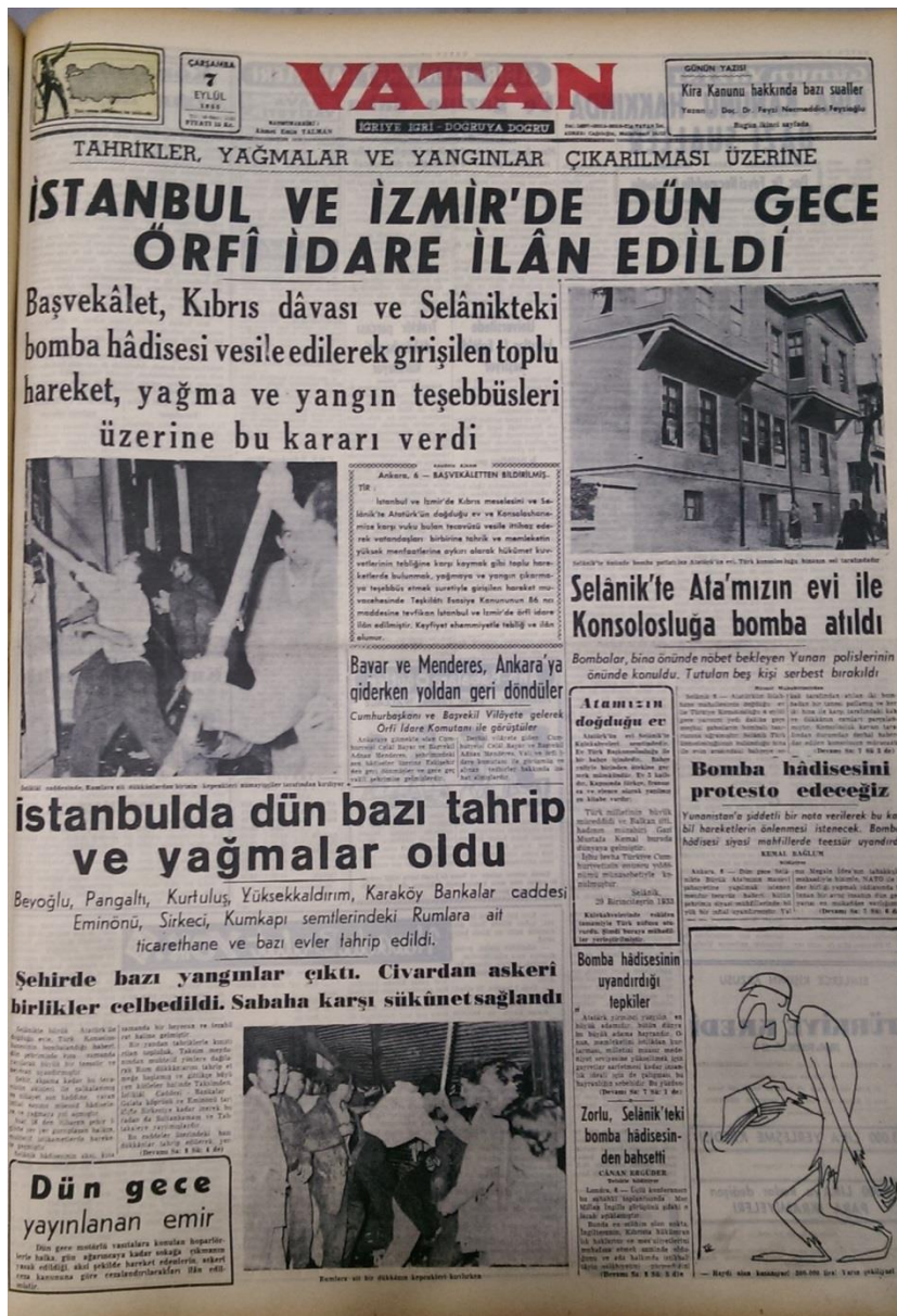
Resim 15. (Vatan, 1955b: 1)

7 Eylül 1955 tarihli gazete, “Tahrikler, yağmalar ve yangınlar çıkarılması üzerine İstanbul ve İzmir’de dün gece Örfî İdare ilân edildi” manşetiyle çıkmıştır. Manşetin spotunda “Başvekâlet, Kıbrıs dâvası ve Selânikteki bomba hâdisesi vesile edilerek girişilen toplu hareket, yağma ve yangın teşebbüsleri üzerine bu kararı verdi” (Vatan, 1955b: 1) cümlesine yer verilmiştir.