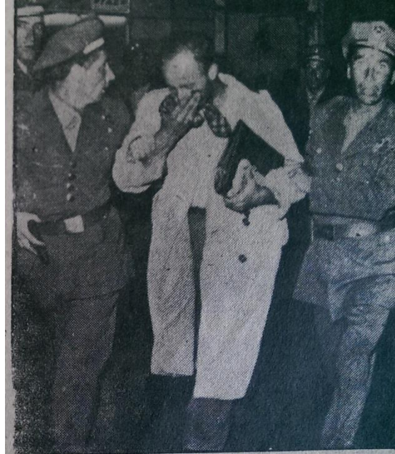
Resim 12. (İstanbul Ekspres, 1955c: 1)

“Beyoğlunun tanınmış gömlekçilerinden birinin dükkânını dolduran tahripçiler” (İstanbul Ekspres, 1955c: 1).