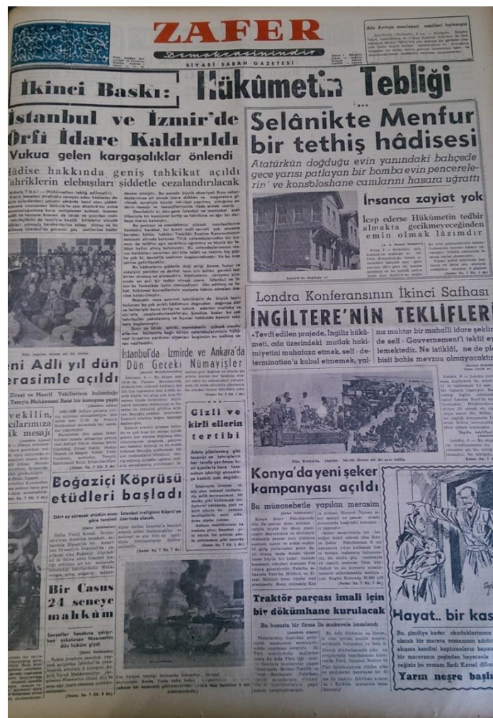
Resim 23. (Zafer, 1955c: 1)

Aynı gün ikinci baskısını yapan gazete, “Hükümetin tebliği İstanbul ve İzmir’de Örfi İdare kaldırıldı” manşetiyle çıkmıştır. Manşetin spotunda “Vukua gelen kargaşalıklar önlemleri” ve “Hadise hakkında geniş tahkikat açıldı Tahriklerin elebaşları şiddetle cezalandırılacak” (Zafer, 1955c: 1) cümlelerine yer verilmiştir. Manşette Hükümetin olaylara dair yapmış olduğu ve failleri “... dün gece İstanbul ve memleket esas itibarıyla bir komünist tertip ve tahrikine ve ağır bir darbeye maruz kalmıştır” (Zafer, 1955b: 1) şeklinde değerlendirdiği tebliğine yer verilmiştir.