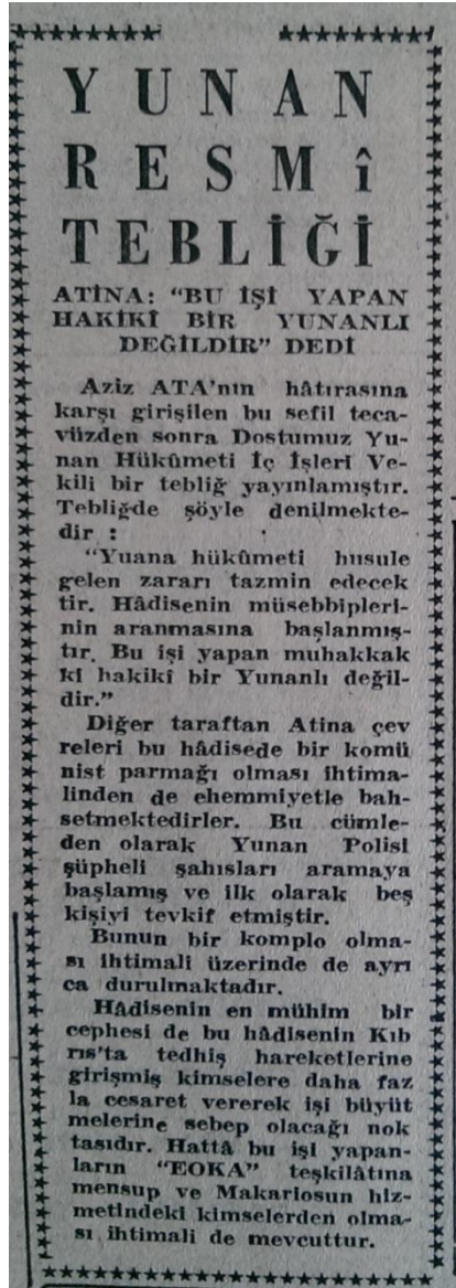
Resim 7. (İstanbul Ekspres, 1955b: 1)

Bu arada yine telefonla bize müracaat eden ve Tarlabası Caddesi Çorbacı sokak 3/1'de otomobil tamirciliği yapan Hırant Kılıçyan isimli vatandaşımız dükkânındaki 5 işçi ile birlikte derhal Kıbrısa gitmeğe talip olduğunu ve bu tecavüzü tel'in ettiğini ifade etmiştir. Hırant Kılıçyan ayrıca her şeyini Türk olarak Türkiye'de kazandığını bütün servetini bu yolda harcıyabileceğini de söylemiştir (İstanbul Ekspres, 1955b: 2).