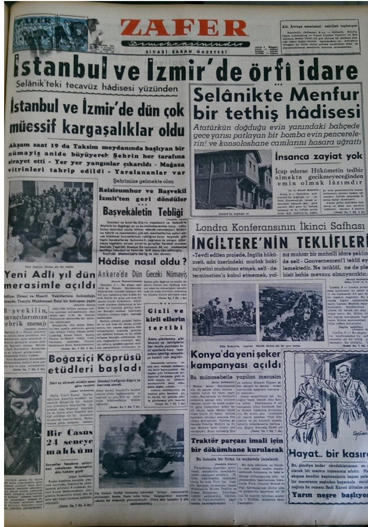
Resim 22. (Zafer, 1955b: 1)

“Selânikte menfur bir tethiş hadisesi” başlıklı haberin spotunda “Atatürk’ün doğduğu evin yanındaki bahçede gece yarısı patlayan bir bomba evin pencerelerini ve konsoloshane camlarını hasara uğrattı”, “İnsanca zayıat yok” ve “İcap ederse Hükümetin tedbir almakta gecikmeyeceğinden emin olmak lâzımdır” (Zafer, 1955b: 1) cümlelerine yer verilmiştir. Olaya dair ayrıntıların verildiği haberin sonunda Zafer Gazetesi olarak “Atatürk’ün hatırasına olduğu kadar, insanlığın bağlı bulunduğu bütün manâ ve an’anelere ve aynı zamanda siyasi terbiyeye müteveccih bu küçük ve çirkin hareketi şiddetle takbih ederiz” (Zafer, 1955b: 7) yorumu yapılmıştır.