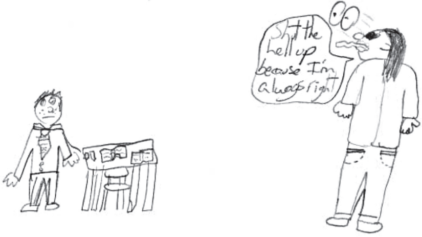
Şekil 2. 'Kapa çeneni çünkü ben her zaman haklıyım!'

ifadesini güvence altında almaktadır. Dezavantajlı ve marjinalleşmiş çocukların ve gençlerin katılımının güvenceye alınması gerekliliği, bu kimselerin kendi öz saygılarını kazanmaları ve kendi yaşamlarının sorumluluğunu üstlenmelerine yardımcı olacağı göz önünde bulundurularak Birleşmiş Milletler Genel Kurulu (2002) tarafından vurgulanmıştır. Dahası, Komite, “çocuğun yetkinliğini kabul etmede daha derin bir yetersizlik” nedeniyle, engelli çocukların katılımını “bu kişilerin haklarının “iki kez yadsınmasına” maruz kalabileceklerini temel alarak güvence altına alma gerekliliğini vurgulamaktadır (1997, para. 334).