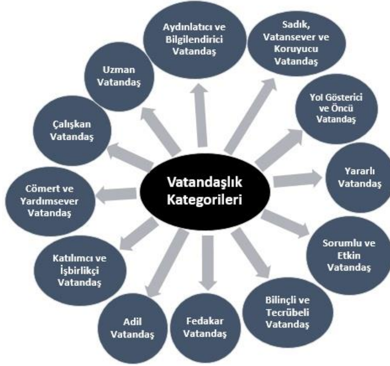
Şekil 1. Vatandaşlık tipleri

Sosyal bilgiler öğretmen adaylarının 'iyi vatandaş' kavramını açıklamak için kullandıkları metaforlar incelenmiş ve 12 farklı kategoriye ulaşılmıştır: