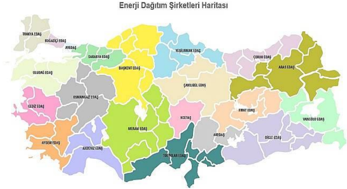
Şekil 1. Türkiye’de Elektrik Dağıtım Şirketlerinin Faaliyet Bölgeleri