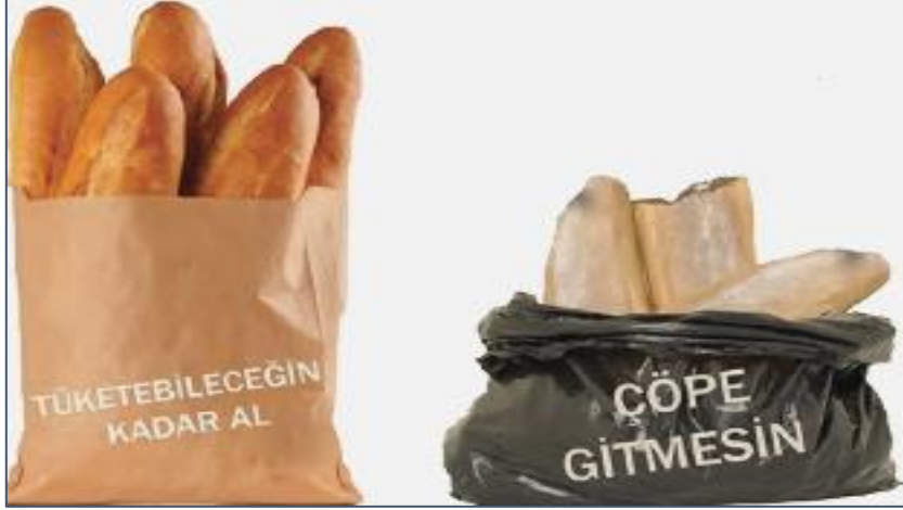
Şekil 6. Ekmek İsrafını Azaltmaya Yönelik Öneriler

Bu önerilerden biri, Şekil 6. kullanılarak görünür kılınmaya çalışılmıştır. Diğer yandan, çocuklar bu önerilerin dışında başka hangi önerilerde bulunabilecekleri konusunda düşünmeye sevk edilmişlerdir (Tüysüz, 2018, s.144):