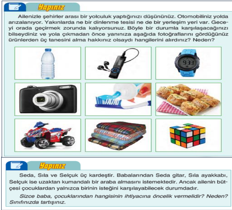
Şekil 3. İhtiyaç ve İstek Temelli Etkinlik Örnekleri

Bu etkinliklere ek olarak ihtiyaç ve istekler konusunda verilen birtakım cümlelerle çocuklara "doğru" ve "yanlış" etkinliği yaptırılmıştır. Onlardan, etkinlik sonunda söz konusu cümlelerle ilgili olarak yaptıkları değerlendirmelerin nedenlerini açıklamaları ve kendileriyle hemfikir olmayan arkadaşlarıyla konuyu tartışmaları istenmiştir (Tüysüz, 2018, s.125). Böylece hem çocukların konuya dair öğrendikleri test edilmiş hem de farklı düşüncelerin tartışılmasına imkân tanınmıştır. Bu çerçevede, ihtiyaç ve istek gibi esasen tasarrufun temelini teşkil eden bir konuda aydınlatılan çocuklara, harcamaların planlanması ve tüketimin bilinçli yapılması konusunda özellikle örnekler eşliğinde önemli birtakım incelikler daha öğretilmeye çalışılmıştır.