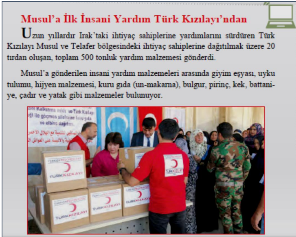
Şekil 1. İnternet Haberi (3)

İnsanlar dünyanın neresinde yaşarsa yaşasınlar, ihtiyaçlarının büyük ölçüde aynı olduğu vurgulanmış; hatta bunu doğrulamak üzere aşağıdaki internet haberi kullanılmıştır (Tüysüz, 2018, s.123):