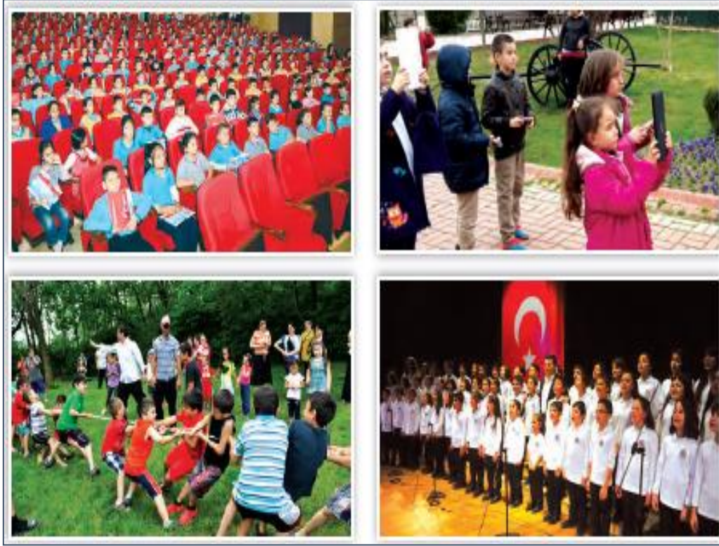
Şekil 2. Bazı Sosyal ve Kültürel İhtiyaçlar

Kızılay tarafından başka bir coğrafyada yaşayan ihtiyaç sahibi insanlara yapılan yardımın hem ayrıntılandırıldığı hem de görselleştirildiği haberde, aynı zamanda "Türk yardımseverliği"ne gönderme yapılmıştır. Konu bağlamında tiyatroya, sinemaya veya konsere gitmek; eğitim almak, oyun oynamak, kitap okumak, seyahate çıkmak, hobi sahibi olmak, sivil toplum kuruluşlarının faaliyetlerine katılmak gibi sosyal ve kültürel ihtiyaçlar dahi söz konusu edilmiş ve bunlardan bazıları Şekil 2. kullanılmak suretiyle görünür kılınmıştır (Tüysüz, 2018, s.124):