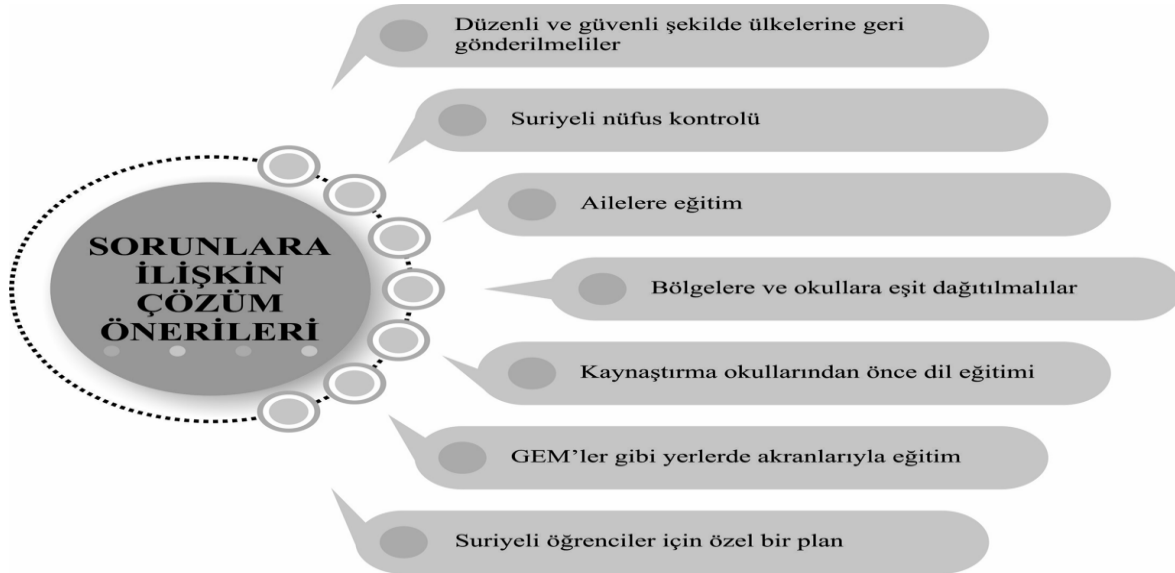
Şekil 4. Sorunlara İlişkin Çözüm Önerileri

İlkokul yöneticileri ve sınıf öğretmenlerinin sorunların altında yatan nedenlere ilişkin görüşlerinin ardından sorunlara ilişkin çözüm önerileri ana temasına yönelik görüşme sorularına verdikleri yanıtlar hazırlanmış olan Şekil 4 ile verilmiştir. Aşağıda sorunlara ilişkin çözüm önerileri ana temasına yönelik bulgular, ilkokul yöneticileri ve sınıf öğretmenlerinin kendi ifadeleriyle desteklenerek Şekil 4'te açıklanmaktadır.