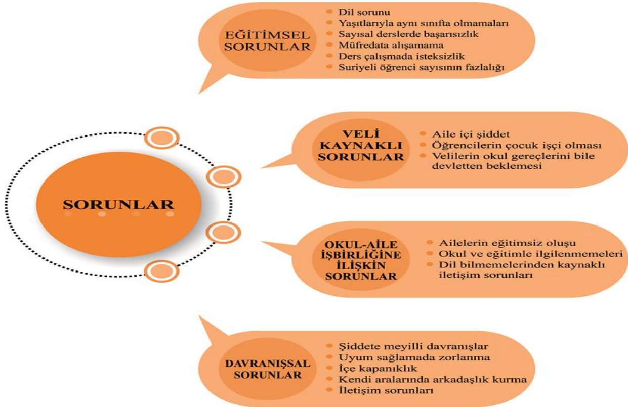
Şekil 2. Suriyeli Öğrencilerin Yaşadıkları Sorunlar

Sınıf öğretmenleri eğitimsel olarak karşılaştıkları en önemli sorunun dil sorunu olduğunu belirttikleri gibi, görüşülen sınıf öğretmenlerinin büyük çoğunluğu bu öğrencilerin yaşlarına göre sınıflarda eğitim alamamalarının ilerleme sağlama konusunda önemli bir sorun olduğunu belirtmişlerdir. Görüşülen sınıf öğretmenleri ve ilkökul yöneticileri Suriyeli öğrencilerin çoğunlukla derslerde başarısız olduklarını belirtmişlerdir. Araştırmaya katılan sınıf öğretmenleri ve ilkökul yöneticileri sadece Suriyeli öğrencilerin değil buldukları okuldaki Türk öğrencilerin de başarı düzeylerinin yüksek olmadığını belirtmişlerdir. Belirlenen eğitimsel sorunları ortaya çıkaran birden fazla neden bulunmaktadır. Eğitimsel sorunları ortaya çıkaran bu nedenler, oluşturulan bir diğer tema olan “Sorunlarına Altında Yatan Nedenler” temasında irdelenmiştir. Yaşanılan sorunları açıklamak için oluşturulan bir diğer alt tema olan veli kaynaklı sorunlara ilişkin ilkökul yöneticileri ve sınıf öğretmenlerinin görüşleri aşağıdaki gibidir.