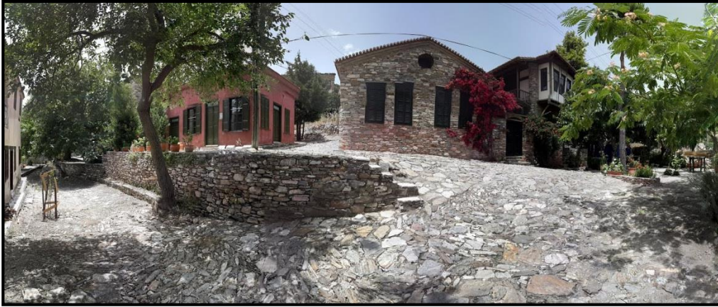
Fotoğraf 5: Doğanbey Köy Meydanı