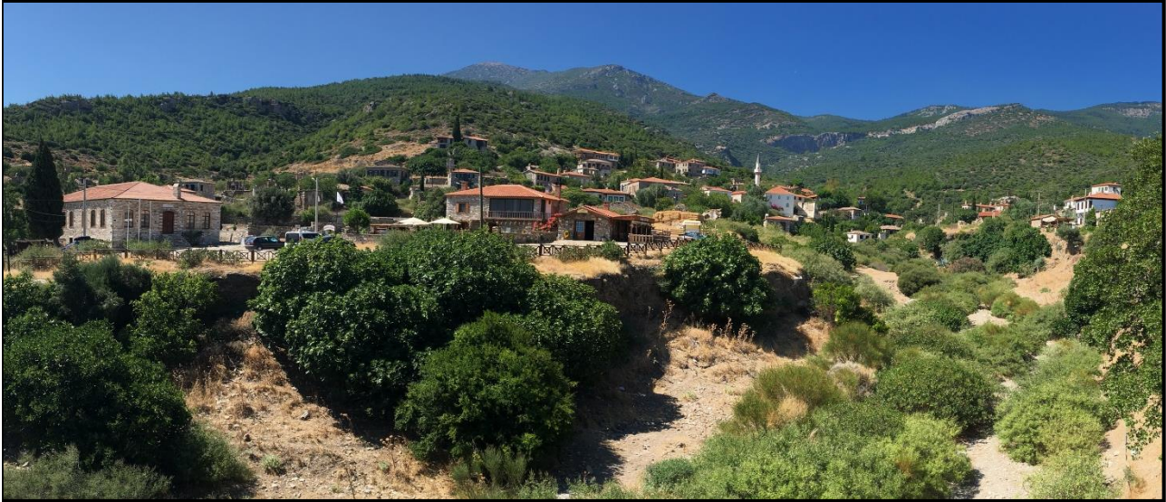
Figure 1: A View of Doğanbey Village (Settlement Pattern)

economic service buildings. One of them is village square defined by socio-economic buildings such as Aios Konstantinos Church, Doğanbey Mosque and commercial units such as pharmacy, traditional coffee shop, fish market. Another of them is old Rum School turned into the National Park Visitor Center and Fauna Museum (Söğüt, 2020: 89-90). Today, Doğanbey village is functionalized as an important destination node for cultural and natural tourism routes extending from ancient cities such as Miletus, Priene, Karina and Thebai to the National Park (Figure 1).