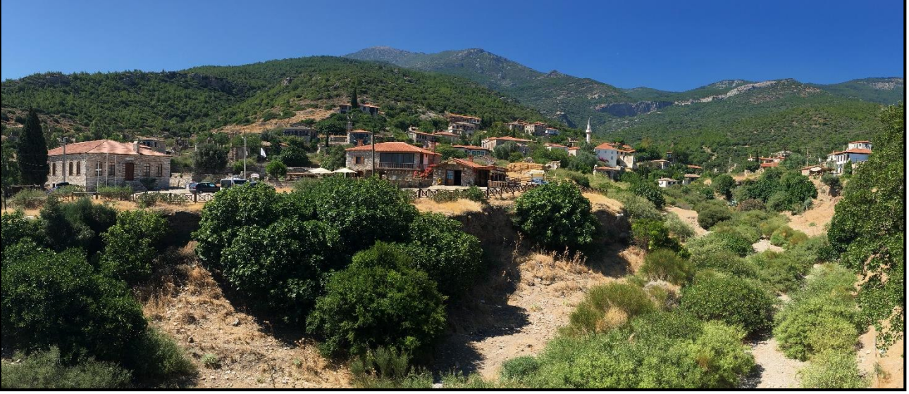
Fotoğraf 1: Doğanbey Yerleşim Deseni

Bu araştırmanın konusu; Aydın İli, Söke İlçesi, Dilek Yarımadası–Büyük Menderes Deltası Milli Parkı sınırları içinde yer alan, İzmir 2 Numaralı Kültür ve Tabiat Varlıklarını Koruma Bölge Kurulu Kararı 5 ile kentsel sit alanı statüsüne alınmış yaklaşık 35,00 hektar (ha) alanı kapsayan Doğanbey yerleşmesidir (Fotoğraf 1).