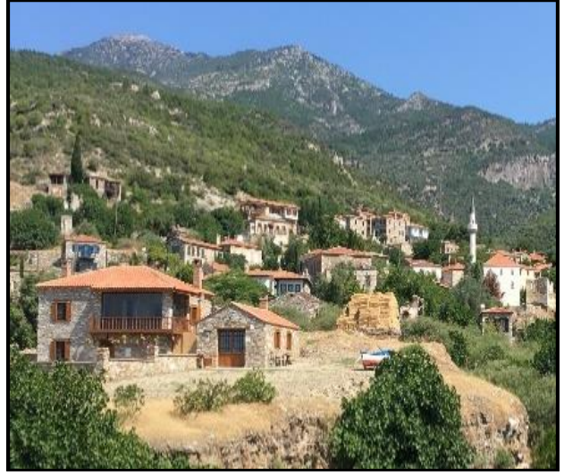
Fotoğraf 7: Doğanbey, Yapılaşma Sürecinin Değişimi