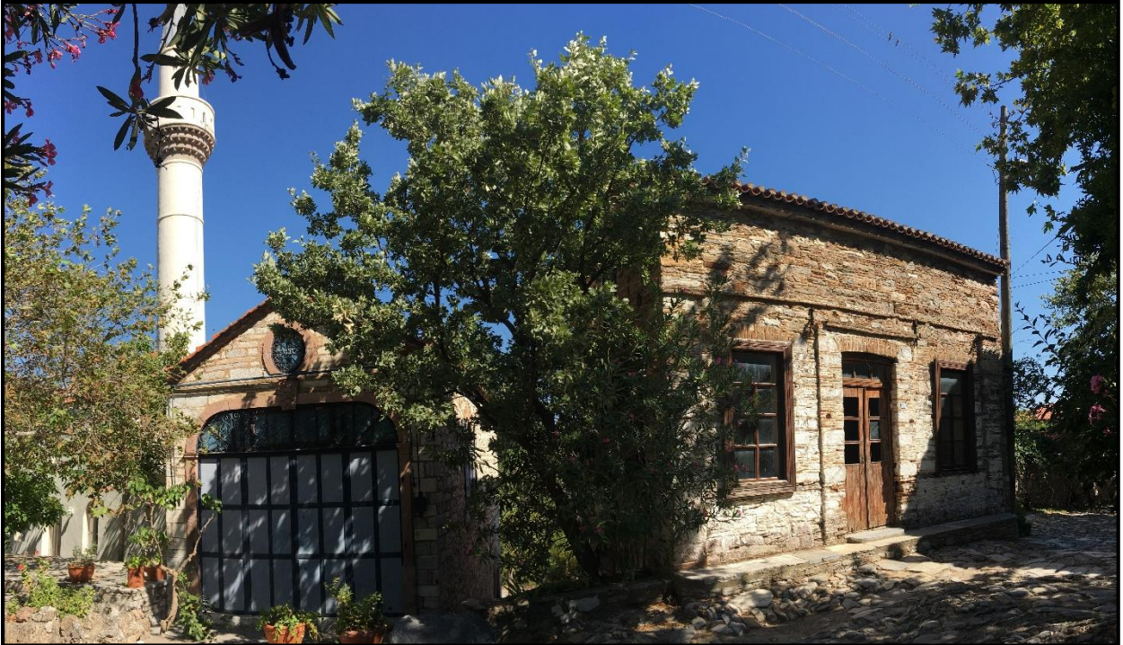
Fotoğraf 3: Doğanbey Camisi, Balık Pazarı ve Manifatura