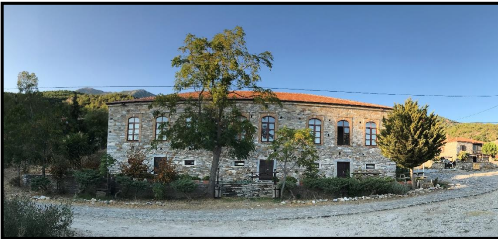
Fotoğraf 6: Doğanbey, Eski Rum Ortaokulu (Bugün Ziyaretçi-Tanıtım Merkezi)