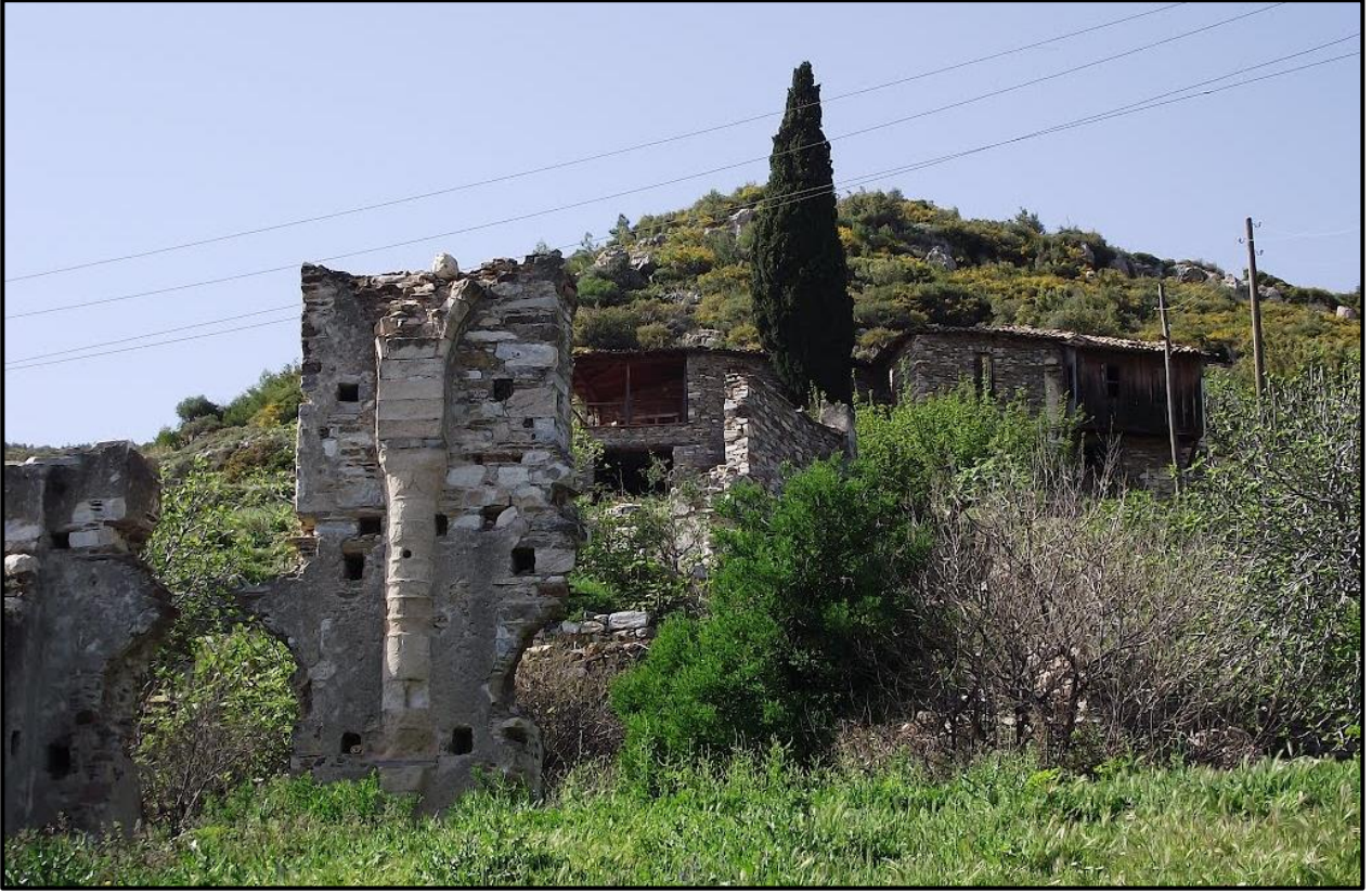
Fotoğraf 2: Doğanbey, Aios Konstantinos Kilisesi