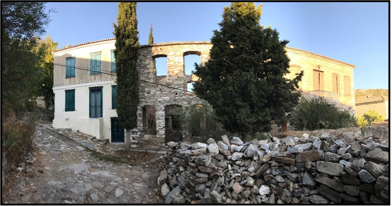
Fotoğraf 8: Doğanbey, Yapılaşma Süreci: Eski Yapı–Yeni Yapı İlişkisi