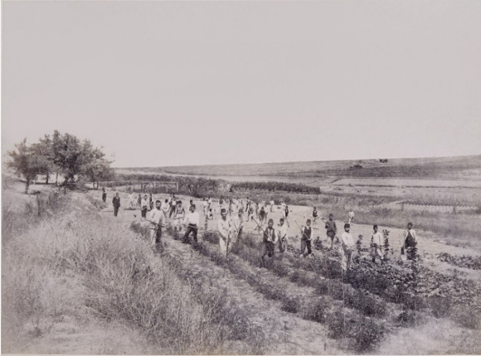
Fotoğraf 2. Halkalı Ziraat Mektebi öğrencileri, çiftlikteki fidanlıkta uygulama yaparken.