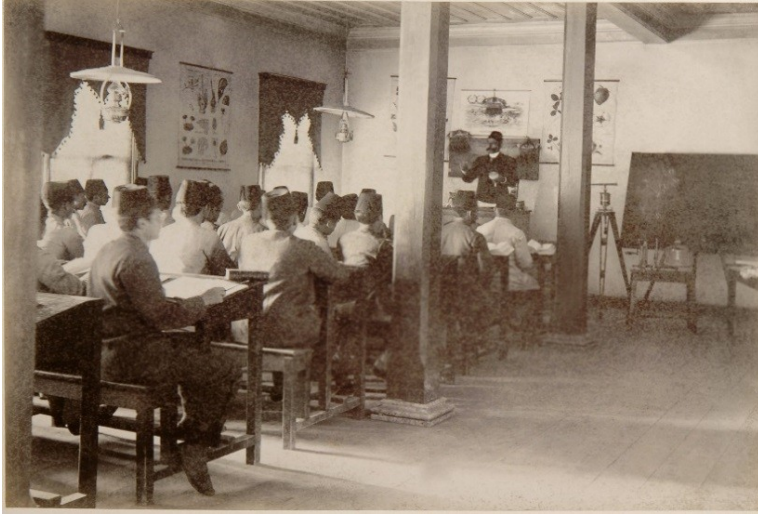
Fotoğraf 1. Halkalı Ziraat Mektebi'nin bir sınıfında ders işlenirken.

1884 tarihli nizamnâmeye göre okulda öğrencilere uygulamalı eğitim verecek hocalar Ziraat Uygulama, Bahçivanlık, Baytarlık ve Ziraat Defteri Tutma 4 alanlarında ders verecek olan hocalardır. 5 Ziraat Uygulama hocası öğrencilere, ziraat aletlerinin kullanımı ile tarlalarda uygulanacak olan yöntemleri öğretmek ve uygulatmakla görevlidir. Sebze ve meyve bahçesi kurulması, meyve ağaçlarının dikimi, aşılması ve budanması ise Bahçivanlık hocasının gözetiminde yapılacaktır. Okulda bulunacak olan baytar ve muhasebeci ise uygulamalı olarak ders veren diğer hocalardan farklı olarak, okul işlerinin yürütülmesinden de sorumlu olacaklardır. Baytarlık hocası öğrencilere baytarlık ile ilgili eğitim verip tedavi yöntemlerini uygulattırken, aynı zamanda çiftlikteki hasta hayvanların bakımını da yapacaktır. Muhasebeci ise, öğrencilere ziraat defteri tutma tekniklerini göstermenin yanı sıra okul çiftliğinin muhasebe işlerinden sorumlu olacaktır. 6