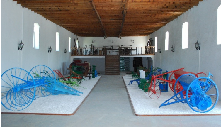
Fotoğraf 4. Halkalı Ziraat Mektebi'nde kullanılmış olan bazı ziraat aletleri. Fotoğrafın çekildiği tarihte, Halkalı Ziraat Mektebi binası, Tarım Bakanlığı'na bağlı 'Halkalı Ziraî Üretim İşletmesi Tarımsal Yayım ve Hizmet İçi Eğitim Merkezi Müdürlüğü' olarak hizmet vermekteydi. Şimdi İstanbul Sabahattin Zaim Üniversitesi olarak kullanılmaktadır.

Ülkede tarımın geliştirilmesindeki rolüne bağlı olarak okulun çiftliğinde bulunan makineler de devamlı surette yenilenmeye çalışılmıştır. Satın alınacak harman makinesi, kuluçka makinesi, meyve kurutma makinesi gibi çiftlik makinelerinin Halkalı Ziraat Mektebi'nde denenmesi ve uygun görülenlerin diğer ziraat okullarına da satın alınması, Halkalı Ziraat Mektebi'nin ayrı bir önem taşıdığını göstermektedir.