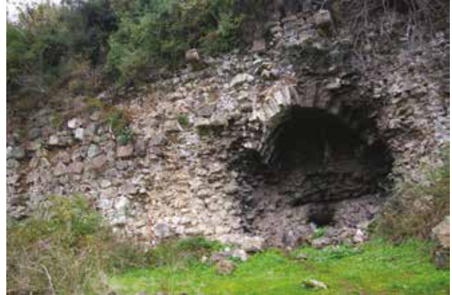
Fotoğraf 14 - Bir sıra şeklinde devam eden konsollar / Consoles lined up at the western terrace wall

çekmektedir (Foto.14). Benzer konsollar diğer istinat duvarında da görülmektedir. Bizans sivil mimarisinde ve saraylarında manzaraya açılan bölümlerde konsollar üzerinde balkonlar veya localar bulunmaktadır. Bukoleon Sarayı, Blakhernai bölgesindeki saray kompleksinin parçası olan Tekfur Sarayı ve yine Blakhernai Sarayı'nın bir parçası olan, Anemas Zindanı içinde kalan Isakios Angelos Kulesi'nin konsollarla taşınan balkonları / locaları Magnesia'daki konsollu duvarla benzer özellik yansıtır. Başkent Konstantinopolis'in dışında da konsollu cepheler bulunmaktadır. Silifke Akkale'deki saraya ait yapı kalıntısının denize bakan kuzey cephesindeki konsol sırası, üzerinde taşıdığı balkon yıkılmış olsa da oldukça belirgindir (Eyice 1981: 876, 883-884; Tunay 2001: 52-53). Örnekler Magnesia'daki istinat duvarlarının oluşturduğu teras sistemlerinin de bir sivil mimarlık örneğine ait olduğunu düşündürmektedir. Araştırmacılar, Magnesia iç kalede III. Ioannes Vatatzes'in bir saray yaptırdığından bahsetmektedir (Foss 1979: 307, 309; Mercangöz 1985: 36). Ancak dış kalede bulunan konsollu duvarlar bu sarayın, oldukça meşakkatli bir yürüyüş sonrasında ulaşılan iç kaleden ziyade, dış kaleden olma ihtimalini arttırmaktadır.