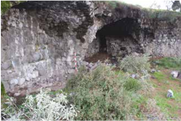
Fotoğraf 13 - Üst galerilere çıkan koridor girişi / Entrance of the hallway to the upper gallery

Bu kompleksin batısında ikinci bir istinat duvarı bulunmaktadır. Duvarın uzunluğu 78 m.'dir ve doğu kesiminden 30 m.'lik dik bir duvar ile birleşerek "L" formu oluşturur. İstinat duvarının önündeki taraça yaklaşık 42 x 78 m. boyutlarındadır. Bu taraçanın da batı tarafında yine eyimli araziye düzleştirerek üzerine inşa edilecek yapılara bir temel oluşturmak için yapılmış tonozlu mekânlar yer almaktadır. Bu istinat duvarı özellikle üzerinde bir sıra şeklinde devam eden konsollarla dikkat