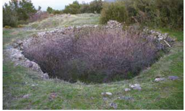
Fotoğraf 10 - İç kaledeki yuvarlak sarnıç / Rounded cistern at the citadel

Halk arasında "Sandık Kale" olarak da bilinen iç kale surlarının inşa tekniği, dış kaleden farklı değildir. Dış kaplamasında irili-ufaklı kabaca işlenmiş yerel taş ve belli bir düzen göstermeyen tuğla sıraları görülmektedir. İç kalenin kuzeybatısında yer alan dikdörtgen burcun üç yüzünde bir sıra halinde devam eden korniş, alternatifli olarak tuğla-taş sıralarıyla inşa edilmiş burca bir hareket katmaktadır (Foto. 9). Burcun iç kısmının yarısından fazlası toprak dolgulu olmasına rağmen iç düzenindeki kat ayrımına işaret eden ahşap döşemenin oturduğu bir seki dikkat çekmektedir.