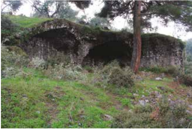
Fotoğraf 12 - Büyük terasın batı ucundaki tonozlu mekânlar / Vaulted structures at the western end of master terrace