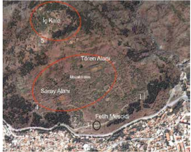
Fotoğraf 18 - Dış-iç sur kapıları ile diğer mimari unsurlar / Inner and Outer Gates of the Castle and other architectures

Saruhanlı döneminin surlara katkısının ne ölçüde olduğu konusunda net bilgiler bulunmamakla birlikte, sonradan yapıldığının düşündüğümüz kapının hemen yanındaki büyük ölçüde ayakta olan kapının -2 numaralı kapı- bu dönemde onarılmış olduğu düşünülebilir. Bu kapı iki büyük daire planlı burç ve kapı kemeri ile oldukça sağlam bir Şek.de günümüze ulaşmasına karşın malzeme ve teknik olarak diğer tüm duvarlardan farklı bir özellik yansıtır. Alt seviyesindeki büyük blok taş ve tuğlanın birlikte kullanıldığı Bizans dönemi duvar örgüsü üzerine tuğla kaplama şeklinde inşa edilmiş olan bu burçlar tuğla malzemesi nedeniyle muhtemelen bir Türk dönemi onarımına işaret eder (Foto. 19). Hemen yakınındaki Fetih Camii'nin tuğla malzemesinden yola çıkarak, bu kapının Saruhanoğulları tarafından onarılmış olabileceği önerilebilir.