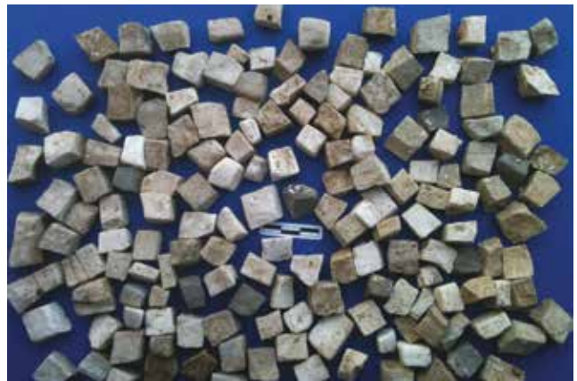
Fotoğraf 15 - Döşeme mozaigine ait tesseralar / Floor mosaics, tesserae