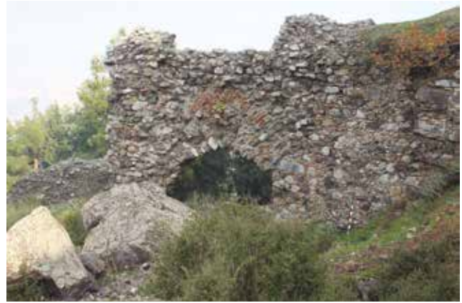
Fotoğraf 7 - Doğu kapısı/Dördüncü kapı (kale içinden) / East Gate/ Fourth Gate

ve duvar örgüsü tekniği bakımından batı surlarıyla benzerdir. Ancak kemer açıklığı dikkat çekmektedir (Foto.7). Geçirdiği onarım sonrasında sivri kemer formunda bir görünüm alan kapı açıklığına Foss da değinmiş ve Türk dönemine ait olabileceği üzerinde durmuştur (Foss 1979: 309). Batıya doğru kıvrılarak devam eden sur üzerinde sonradan örülerek kapatılmış bir tali kapı bulunmaktadır. Dış kalenin günümüze en iyi durumda ulaşılmış bölümünün kuzeydoğu surlarının olduğu söylenebilir. Belirgin bir Şek.de çerçevesiz tekniğin kullanıldığı bu bölümdeki duvar örgüsü dış kalenin diğer bölümleriyle karşılaştırıldığında daha özenlidir.