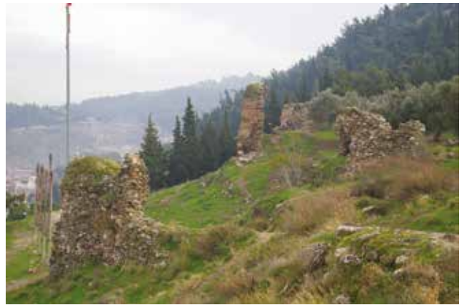
Fotoğraf 20 - Üçüncü kapı (muhtemel Osmanlı dönemi kapısı) / Third entrance, considered to be opened in Ottoman period

Bahsi geçen kapı girişinin hemen arkasında yer alan, yaklaşık 5 m. çapındaki sarnıç, kaledeki görebildiğimiz üçüncü sarnıcı oluşturması açısından önemlidir. 2013 araştırmasında tespit edilen sarnıç yamaçta bulunan yerleşimlere su haznesi görevi görüyor olmalıdır.