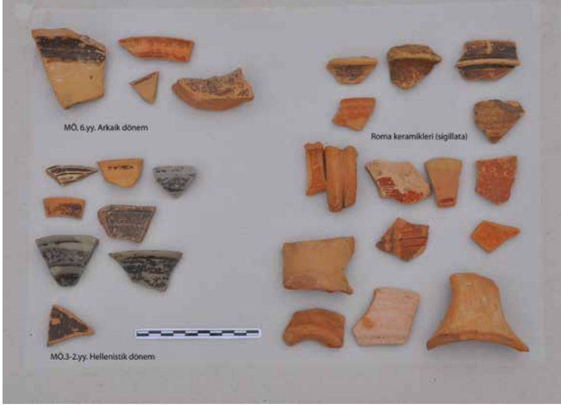
Fotoğraf 1 - Kale içinde tespit edilen keramik türleri (Arkaik, Hellenistik, Roma) / Some ceramics belong to different periods (Archaic, Hellenistic, Roman)