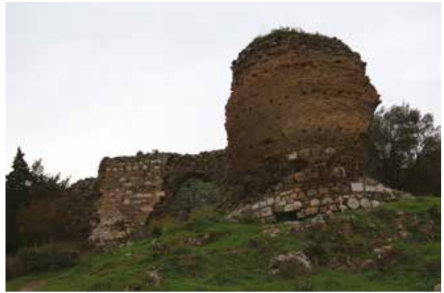
Fotoğraf 19 - İkinci kapı (Muhtemel Saruhanoğulları dönemi kapısı) / Second entrance, considered to be renewed in Saruhanoğulları period