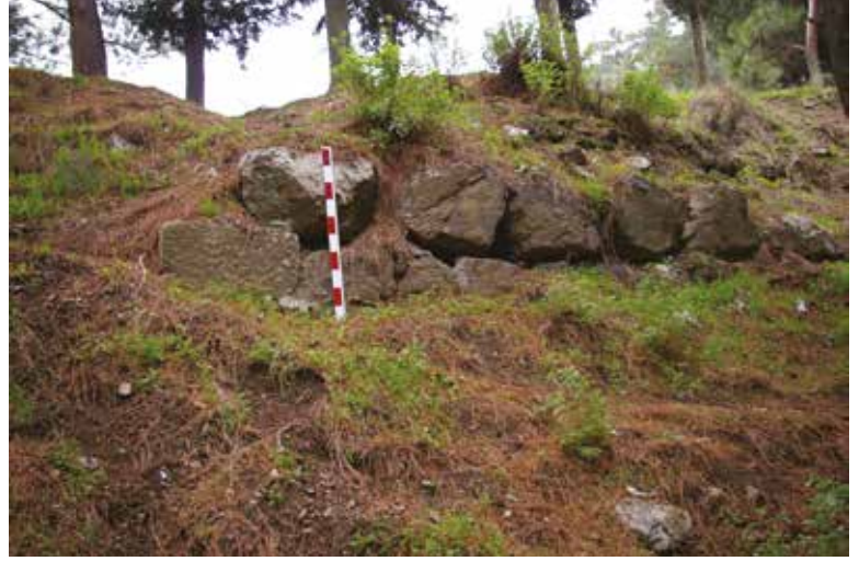
Fotoğraf 3 - Batıdaki kiklopiik duvarlar / Western side cyclopean walls

Manisa kalesi ile ilgili yapılan bazı yayınlarda kiklopiik dediğimiz duvarlar, poligonal duvar olarak isimlendirilmiştir. Duvarlarda kullanılan taşların Klasik ve Hellenistik dönemde devşirme olarak kullanıldıklarını ve dolayısıyla düzeltilmiş kenarları olduğunu düşünürsek; Manisa'da kullanılan duvarların Klasik öncesinde Arkaik dönemde yapıldığını ileri sürebiliriz. Kale, eğer kaynaklarda geçen "Magnesia ad Sipylum"un son halı ise, buradaki yerleşimin başlangıcını Erken Demir Çağı'na kadar çekmek mümkün gibi görülür. Kalede, Erken Demir Çağı'na ait keramik (M.Ö. 1200) varlığı bilgisi de bulunmaktadır (Doğan 2007a: viii). Bu Şek.de düşünmemizin bir diğere sebebi, Spil Dağı'nın güneyinde Nif Dağı silsilesinde yer alan ve Karabel yazıtı olarak bilinen, hiyeroglif metinli bu Hitit kabartmasında "Mira ülkesi kralı Tarkasnavı" ifadesi bulunmaktadır (Hawkins 1998: 4).