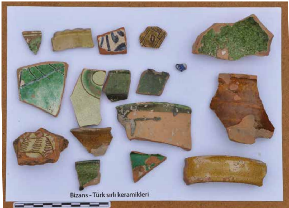
Fotoğraf 2 - Kale içinde tespit edilen keramik türleri (Bizans ve Türk) / Some ceramics belong to different periods (Byzantium and Turks)