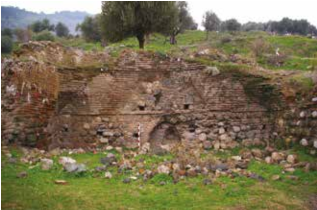
Fotoğraf 17 - Fetih (Kale/ Hacet) Mescidi, iç mekân / Fetih (Kale/Hacet) Mosque, interior space

Cami sur içerisindeki konumu nedeniyle ilk Saruhanlı yerleşimine yönelik önemli bir veri olarak değerlendirilebilir. Bulunduğu yer, kalenin ovaya açılan iki kapısının hemen yakınında, nispeten düzlük bir alanda ve günümüzde bu kapılardan birinin üzerinden geçirilerek şehir ile sur içerisini bağlayan yolun üzerindedir (Şek. 1). Bu konumu ile Fetih Camii ilk yerleşim bölgesinin sur içerisinde olduğuna işaret eder. Ancak, sur içerisinde olmasına karşın caminin kale kapıları ile olan yakın ilişkisi adeta kentin ilk gündün itibaren sur dışına kayacağına da habercisi olur. Gerçekten de Kale Mescidi dışında, günümüze ulaşan Saruhanlı yapıları ve arşiv belgelerinden öğrenilen ilk Saruhanlı mahalleleri beylik yerleşiminin yoğunluğu sur dışına olmak üzere kuzeybatıya doğru kaymaya başladığını ortaya koyar. Bu dönem Manisa'sı Ulu Camii ve Külliyesi 8 öncelikli olmak üzere Eskihisar (İshak Çelebi dönemi), İlyas Bey (1363), Giderci (1393) ve Gûrhane (1397 öncesi) mescitlerin belirlediği ince bir yerleşme şeridi halindedir 9 . Ancak bunlardan kale içerisinde olduğu tahmin edilen "Eskihisar" mahallesi 1531 yılına kadar ortadan kalkmıştır (Emecen 2013: 51). Bu durum, ortadan kalkan sur içi halk yerleşimleri hakkında önemli veri olarak değerlendirilebilir.