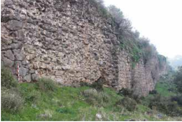
Fotoğraf 11 - Büyük teras (doğu terası) / Master terrace (eastern terrace)