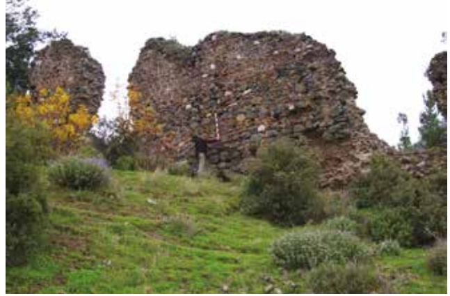
Fotoğraf 6 - Dış kale batı yöndeki Bizans sur duvarı / West wall belongs to Byzantium period

Dış kalenin en sağlam bölümü, doğudaki kapıdan başlayarak, batıya doğru kıvrılıp yamaçlardan aşağıya inmekte ve kuzeydeki surlara kadar hemen hemen kesintisiz takip edilebilmektedir. Doğu kapısı, malzeme