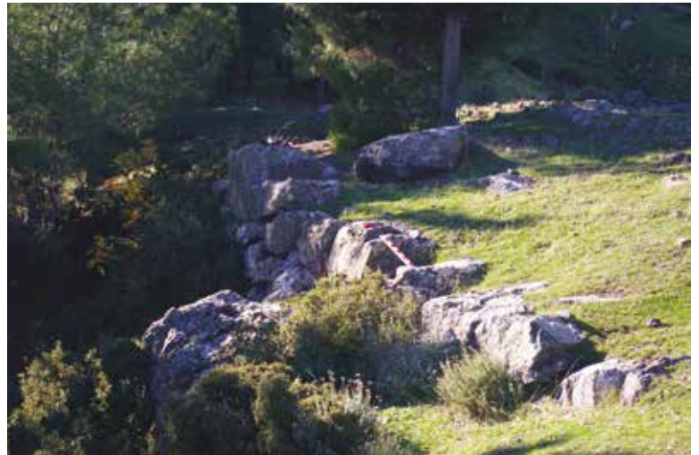
Fotoğraf 5 - Doğudaki kiklopiik duvarlar / Eastern side cyclopean walls

Kiklopiik duvarların Hellenistik dönemdeki durumu net olarak bilinmemekle birlikte, kalede tespit edilen Hellenistik dönem keramikleri bu dönemin varlığına işaret eder. Ancak Hellenistik dönem keramikleri ile eşleşen bir duvar örgüsüne rastlanmamıştır. Roma dönemi sigillataları için de aynı durum söz konusudur. Kiklopiik duvarlarda kullanılan iri blokların Roma döneminde kullanılmadığını düşünmemize neden olan durum, Kiklopiik taşların saray taraçasının altında devşirme olarak kullanılmasıdır. Strabon'un bahsettiği M.S.17 yılındaki (Strabon 2000: 87) ya da daha sonraki depremler bahsi geçen dönem duvarlarını iz bırakmadan yıkamayacağına göre arařtırma yaptığımız bölge ile ilgili sıkıntılar bilimsel bir kazı yapılmadığı sürece devam edecek gibi görünmektedir 5 .