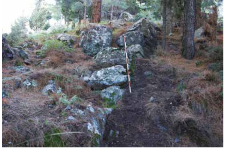
Fotoğraf 4 - Doğudaki kiklopiik duvarlar / Eastern side cyclopean walls

Artan arařtırmalar sonucunda Batı Anadolu'daki Hitit varlığı ile ilgili pek çok veriye rastlanır. Bu da, Ege hinterlandında Minos'un güç kaybetmesi ile Batı Anadolu'da Miken-Hitit karşılaşmasının başlamış olduğunu işaret eder (Gür 2012: 13; Kelder 2004-2005). Spil Dağı'ndaki Hitit hiyeroglifi ve kalede var olan kiklopiik duvarlar Hititlerin burada bir yerleşim kurduğuna delil teşkil etmese de Hitit etkilerinin buraya kadar ulaştığına rahatlıkla bir gösterge olabilir (Akşit 1983: 35). Manisa Kalesi'nin erken dönemine açıklık getirebilmek için söz konusu duvarlara sahip bölgelerdeki kazı sonuçlarının ve Mira 4 denen ülkenin (şehrin?) lokasyonu ile ilgili çalışmaların netleşmesi gerekmektedir.