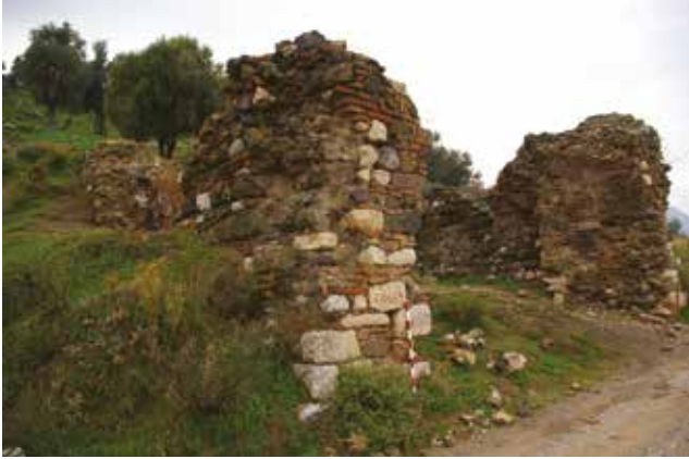
Fotoğraf 16 - Fetih (Kale/ Hacet) Mescidi / Fetih (Kale/Hacet) Mosque

Kale'deki Türk dönemine ait en erken yapılar, fethi gerçekleştiren Saruhanoğulları'na aittir. Manisa 1313 yılında Saruhan Bey tarafından ele geçirilir ve Bizans ile birlikte yeniden yükselişe geçen bu korunaklı şehir Saruhanoğulları'nın merkezi olarak seçilir. Beyliğin kurucusu Saruhan Bey (ölümü 1345/6) ilk iş olarak sur içerisine bir Fetih Camii ve caminin hemen batısında bir çeşme inşa ettirir (Foto.16-17). Bugün Kale veya Hacet Mescidi olarak adlandırılan yapının kitabesi yoktur ancak fethin hemen ardından yapıldığı aşikârdır. Nitekim hem inşa malzemesi hem de planı mescidin 1313 ya da 1314 tarihinde yapıldığını düşündürür. Mescid bugün oldukça harap durumda olsa da, Saruhan Bey'in günümüze ulaşabilen ilk ve tek eseridir.