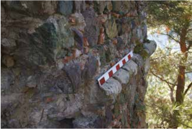
Fotoğraf 9 - İç kale burcunun üç yüzünde bir sıra halinde devam eden korniş / Cornice at the tower of citadel

İmparatorluğu'nun Türklerle mücadele edebilmek için tuttıkları Katalanların, Magnesia'yı kendilerine üst edindikleri bilinmektedir. Moncada, kroniğinde Magnesia için bölgedeki en güçlü ve korunaklı şehir olarak bahsetmektedir (Moncada 1975: 53, 59). Bu özellikler Katalanların neden Magnesia'yı üst olarak seçtiklerini açıklamaktadır. Kaynaklar, bu dönemde Magnesia ve çevresindeki kalelerde takviyeler yapıldığı bilgisini de vermektedir (Pachymeres 1835: 428; Foss 2011: 114; Karakaya 1990: 26-27). Dış kalenin kuzey kısmında yer alan bu devşirme malzemeli burcun Laskaris dönemine ait olabileceği gibi II. Andronikos Palaiologos döneminde de onarılmış olabileceği göz ardı edilmemelidir. Bu burcun üst kısmında farklılık gösteren tuğla kaplamalı bölüm dikkate alındığında Türk döneminde de elden geçirilmiş olma ihtimali, üzerinde durulması gereken bir başka konudur 7 .