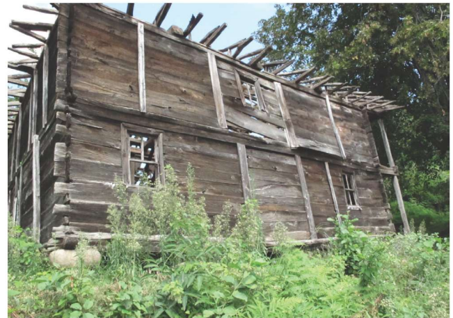
Fotoğraf 2 - Kutluca Mahallesi Camii'nin güney cephesi / The South Façade of Kutluca Quarter Mosque

Kapılardan girildiğinde caminin kuzey kenarı boyunca uzanan, derinliği doğu kenarında 1,66 m., batı kenarında 1,89 m., uzunluğu da 8,14 m. olan bir giriş mekanına ulaşılmaktadır. 0,10 x 0,10 m. ölçülerinde beş ahşap direk arasında, doğudan başlayarak 0,90 m., 0,82 m., 0,88