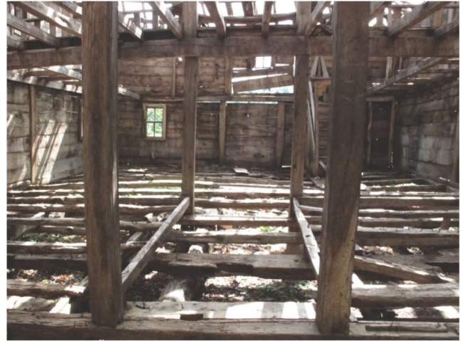
Fotoğraf 5 - Kutluca Mahallesi Camii'nin iç mekânı / The Interior Place of Kutluca Quarter Mosque