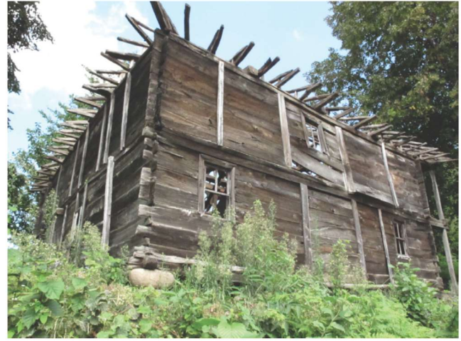
Fotoğraf 8 - Kutluca Mahallesi Camii'nin ahşap duvar yapısı ve üst örtüsü / The Wooden Wall and Cover of Kutluca Quarter Mosque

Perşembe İlçesinin Afırlı Mahallesi'nde yer alan ve mahallenin adıyla anılan caminin ne zaman ve kim tarafından inşa edildiği bilinmemektedir. Mahalle sakinlerinin yaşlılarının verdiği bilgilere dayanılarak hazırlanan caminin ibadete açılış beratındaki kayıtta 1204 H. / 1789-90 M. tarihi bulunan yapının, XVIII-XIX. yüzyıllardan kalmış olması ihtimal dâhilindedir.