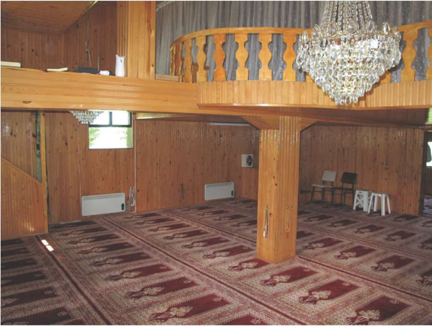
Fotoğraf 14 - Afırlı Mahallesi Camii'nin iç mekânı / The Interior Place of Afırlı Quarter Mosque