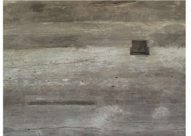
Fotoğraf 17 - Afırlı Mahallesi Camii duvarlarındaki orijinal pencere / The Original Window on The Walls of Afırlı Quarter Mosque

Yapının dört yöne eğimli çatısı, yakın tarihlerde saç örtü ile kapatılmış durumdadır. Ayrıca içte duvarları lambri ile kaplanmış ve daha geniş pencereler açılmış vaziyettedir. Cami, genel yapısı itibariyle doğu ve batı yönlerinde olmak üzere iki yönlü revaklı olması itibariyle, yöredeki tarihi ahşap çantı camilerden birisi olarak değerlendirilmektedir.