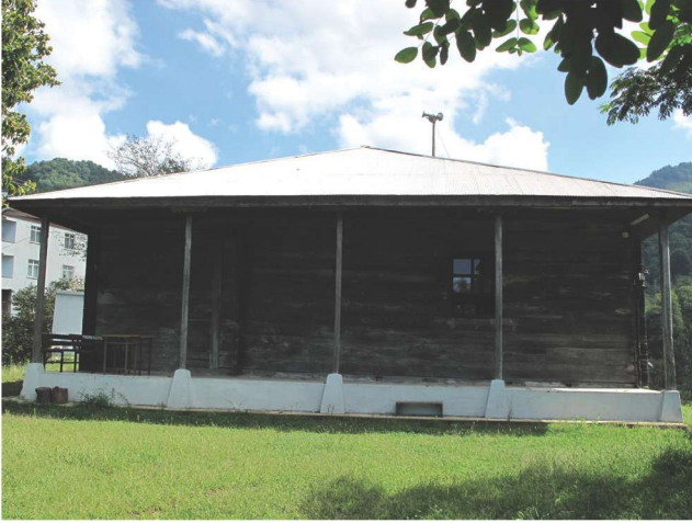
Fotoğraf 10 - Afırlı Mahallesi Camii'nin batı cephesi / The West Façade of Afırlı Quarter Mosque