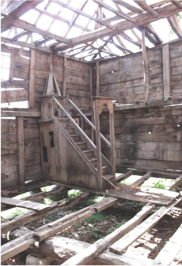
Fotoğraf 7 - Kutluca Mahallesi Camii minberi / The Pulpit of Kutluca Quarter Mosque

kuzey kenarı 8,26 m., doğu kenarı 9,10 m., batı kenarı 9,18 m. ve güney kenarı 8,33 m. uzunluğunda olan kareye yakın dikdörtgen bir plana sahiptir. İç mekân; doğu duvardaki 0,65 m. ve 0,60 m., batı duvardaki 0,65 m. ve 0,60 m. genişliğindeki beş dikdörtgen şekilli pencere ile aydınlatılmıştır (Şek. 1). Mihrap tamamen sökülmüş durumdadır. Ancak, 0,67 m. genişliğinde ve 2,17 m. uzunluğundaki sekiz basamaklı ahşap minberi özgün nitelikleriyle günümüze gelebilmiştir (Foto. 7). Caminin içindeki taban, tavan gibi ahşap unsurlar hemen hemen tamamen sökülmüş vaziyettedir.