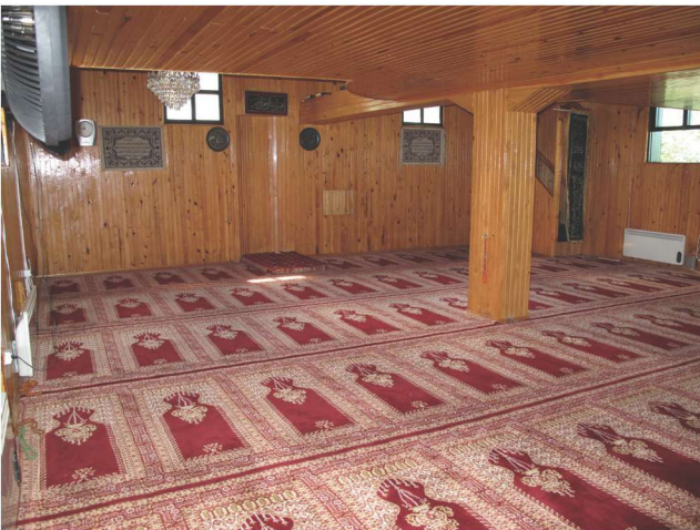
Fotoğraf 15 - Afırlı Mahallesi Camii'nin iç mekânı / The Interior Place of Afırlı Quarter Mosque