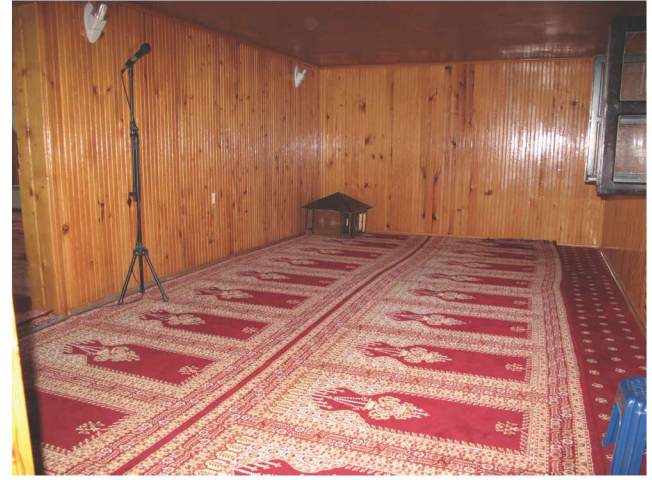
Fotoğraf 13 - Afırlı Mahallesi Camii'nin giriş mekânı / The Entrance Space of Afırlı Quarter Mosque

Son cemaat yerinin güney duvarının ortasındaki 0,80 m. genişliğinde, düz lentolu bir kapı ile harime girilmektedir. Harim, doğu kenarı 7,80 m., güney kenarı 6,55 m., batı kenarı 7,83 m. ve kuzey kenarı 7,43 m. uzunluğunda olmak üzere hemen hemen kare planlıdır. Mekânın orta kısmında 0,33 x 0,33 m. ölçülerinde kare kesitli bir ahşap direk yer almakta ve bu direk mahfili desteklemektedir