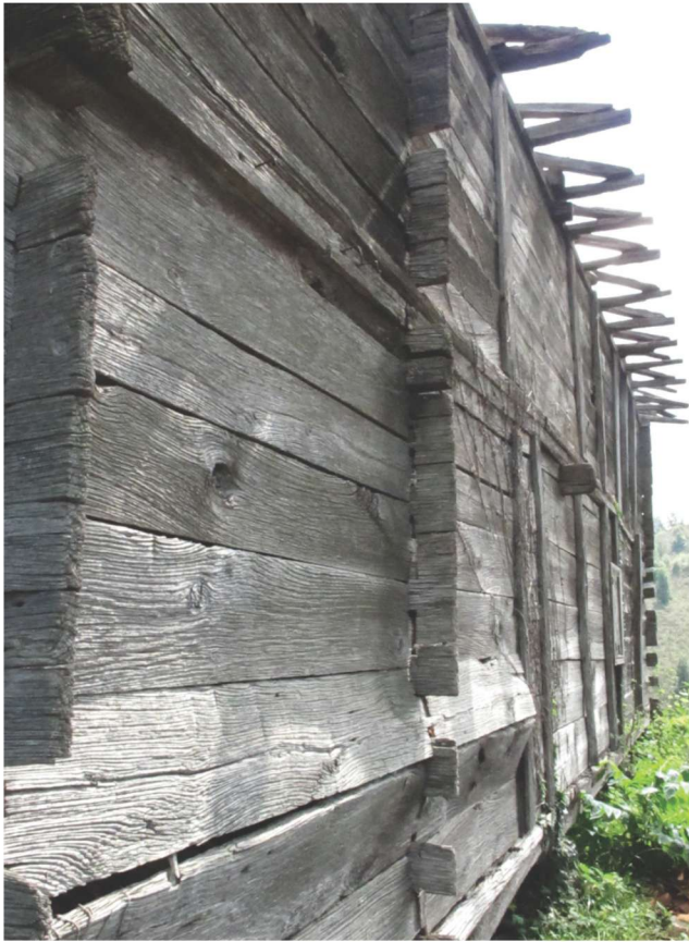
Fotoğraf 4 - Kutluca Mahallesi Camii'nin Batı Cehesi / The West Façade of Kutluca Quarter Mosque

m., 0,98 m., 1,07 m. ve 1,12 m.lik açıklıklarla harime bağlanan giriş mekanının batı ucunda, mahfile götüren bir ahşap merdiven yer almaktadır.