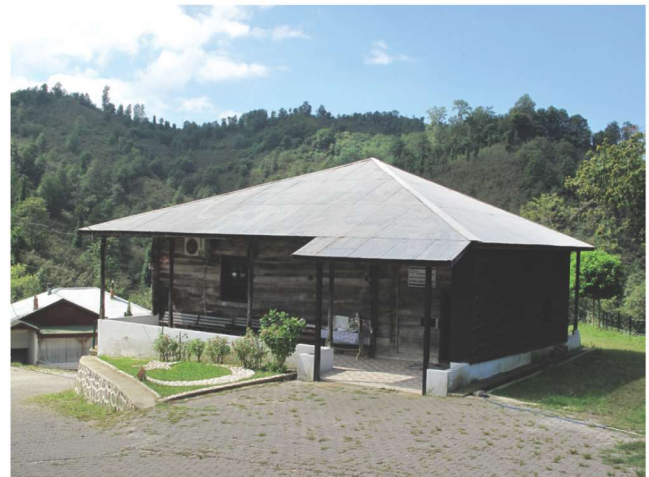
Fotoğraf 9 - Afırlı Mahallesi Camii'nin doğu cephesi / The East Façade of Afırlı Quarter Mosque

Caminin doğu ve batı kenarları (Foto. 9-10) boyunca uzanan revaklardan doğudaki, aynı zamanda giriş revakı olarak düzenlenmiştir. Sağdan sola 2,57 m., 1,41 m., 2,75 m. ve 2,80 m. genişliklerinde dört gözlü revak, 0,10 x 0,10 m. ebatlarında ahşap direklere sahiptir. Revakın güneyi 2,22 m. olarak açık bırakılmışken, kuzey tarafı ayakkabılık olarak düzenlenmiştir. Revakın kuzeydoğu köşesindeki gözün doğusuna, 1,12 m. mesafede iki ahşap