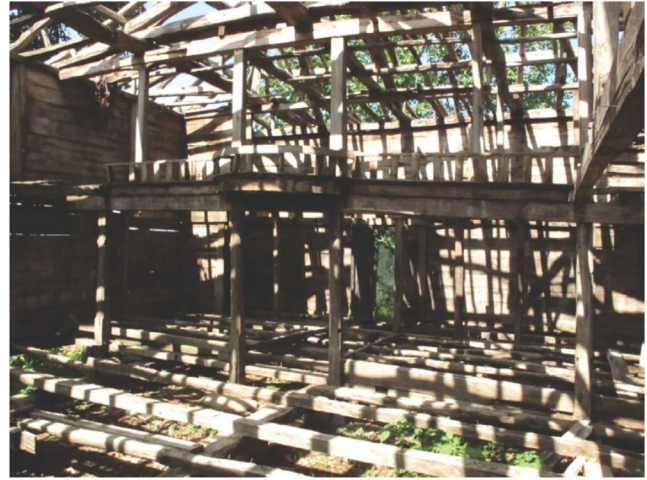
Fotoğraf 6 - Kutluca Mahallesi Camii'nin mahfili / The Circle of Kutluca Quarter Mosque

Harimin kuzey kenarında 0,15 x 0,15 m. boyutlarında dört ahşap direkli bir dizi aynı zamanda mahfile desteklemektedir (Foto. 5-6). Doğu uçtan başlayarak direkler arasındaki açıklıklar, sırasıyla 1,01 m., 2,50 m., 1,20 m., 2,16 m. ve 1,05 m. genişliğindedir. Harim;