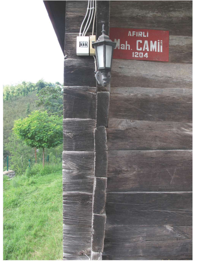
Fotoğraf 16 - Afırlı Mahallesi Camii'nde kurt boğazı geçmeli duvar yapısı / The Wall With Tenon (wolf throat) on Afırlı Quarter Mosque