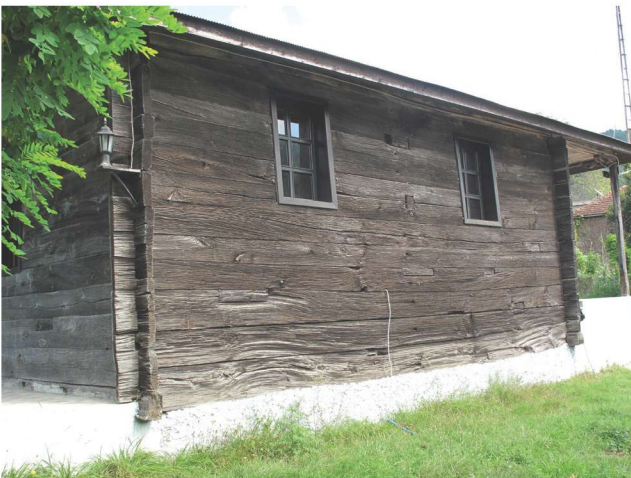
Fotoğraf 12 - Afırlı Mahallesi Camii'nin kuzey cephesi / The North Façade of Afırlı Quarter Mosque

direkle bir giriş bölümü eklenmiştir. Kuzey ve güney yanları yalın bir kuruluş sergilemektedir (Foto. 11-12).