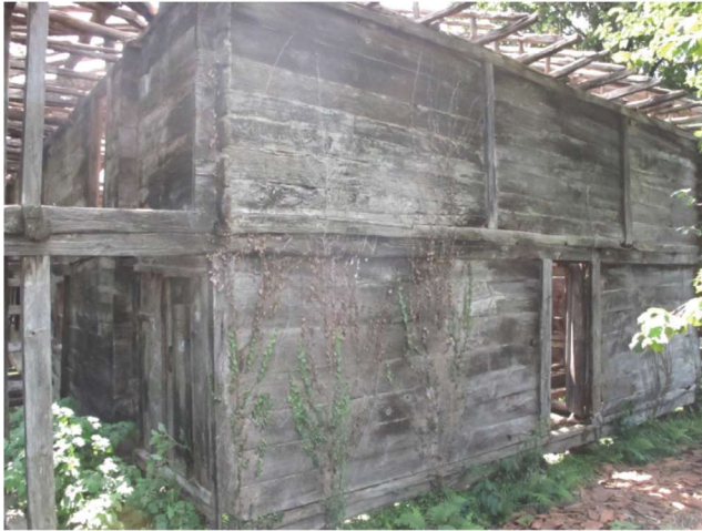
Fotoğraf 3 - Kutluca Mahallesi Camii'nin Kuzey Cehesi / The North Façade of Kutluca Quarter Mosque