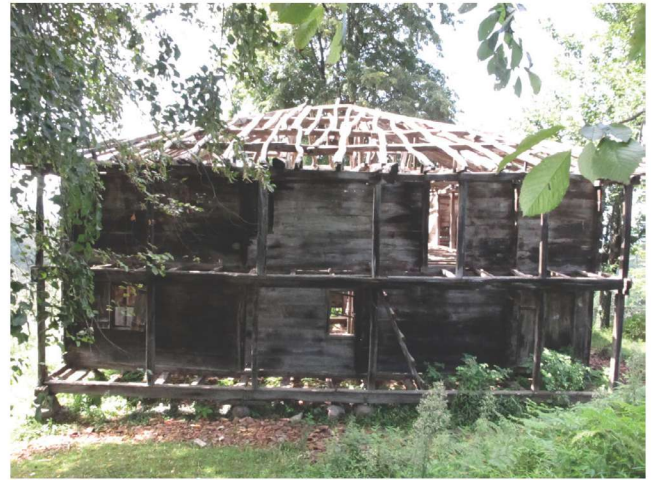
Fotoğraf 1 - Kutluca Mahallesi Camii'nin doğu cephesi / The East Façade of Kutluca Quarter Mosque

Kutluca Mahallesi Camii'nin doğu duvarı boyunca uzanan ve iki katlı olarak düzenlenmiş olan revak, 0,10 x 0,10 m. kesitinde altı ahşap direklidir (Foto. 1). Revak, kuzeyden başlayarak sırasıyla 1,45 m., 3,00 m., 2,04 m., 1,84 m. ve 2,00 m. genişliğindeki açıklıklarla beş gözlü olup, kuzey ve güney kenarları da 1,04 m.lik açıklıklarla dışarıya açılmıştır (Foto. 2). Caminin iki giriş kapısı mevcuttur. Bunlardan birisi doğu cephedeki revakın kuzey ucundan olup, 0,76 m. genişliğinde ve düz lentoludur. Kuzey cephenin ortasında yer alan ikinci kapı da 0,95 m. genişliğinde, iki ahşap kanatlı ve düz lentoludur (Foto. 3). Batı kenar daha sade bir düzenleme ortaya koymaktadır (Foto. 4).