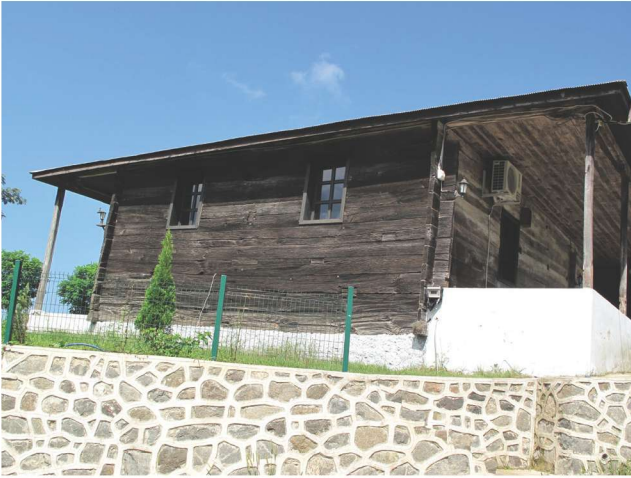
Fotoğraf 11 - Afırlı Mahallesi Camii'nin güney cephesi / The South Façade of Afırlı Quarter Mosque