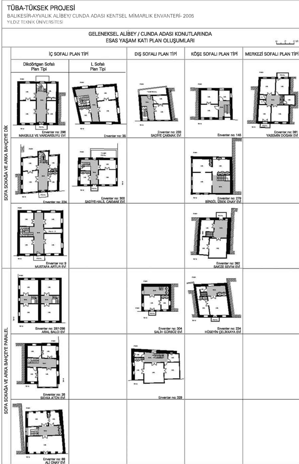
Şek. 3. Alibey (Cunda) Adasında 2005 yılında yapılan envanter çalışmasında elde edilen veriler ışığında, Cunda'nın geleneksel konutlarında üst kat plan oluşumları.