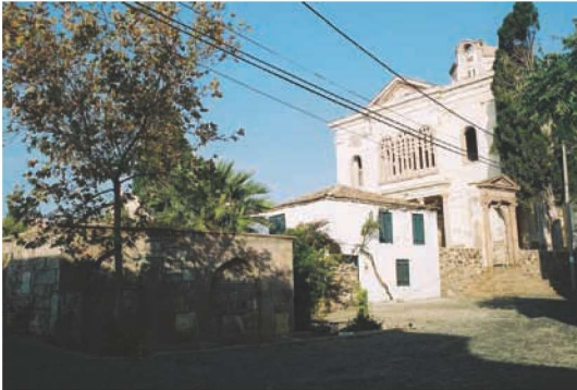
Res. 5. Taksiyarhis Kilisesi (env. no: J17.B12.171) ve güneyindeki küçük meydana yer alan Aşağı Çeşme (env. no: J17.B12.18).