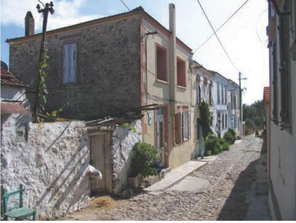
Res. 16. Cunda'nın özgün niteliklerini koruyabilmiş caddelerinden Hükümet Caddesi.