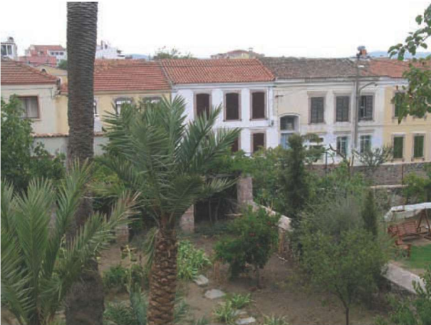
Res. 27. Ön cepheleri ile sokak çizgisini oluşturacak şekilde yerleştirilen bitişik düzende Cunda evlerinin arka cephelerinde büyük bahçeleri bulunur.