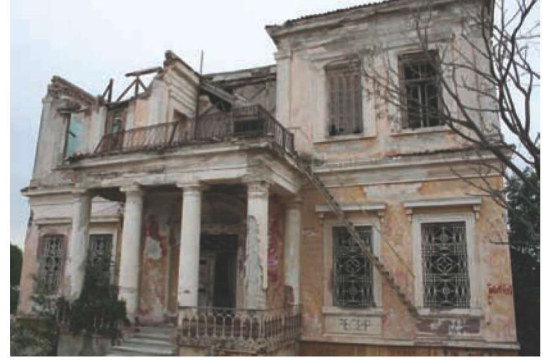
Res. 10. Cunda'nın önemli yapılarından biri olan Despot'un Evi (eski Yetimhane Binası) (2005 yılı çalışma alanı sınırları dışında).