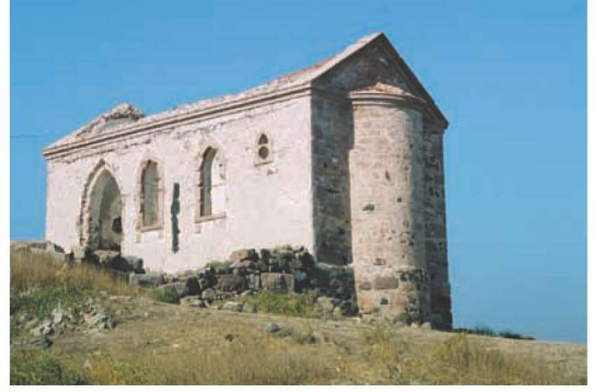
Res. 2. Aşıklar Tepesindeki Agios Yannis Kilisesi (2004), günümüzde kütüphane olarak kullanılıyor.