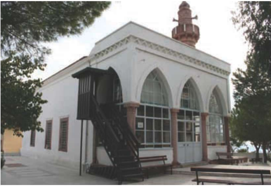
Res.11. Kentin tek camisi, 1905 tarihli Hamidiye Camisi (2005 yılı çalışma alanı sınırları dışında).