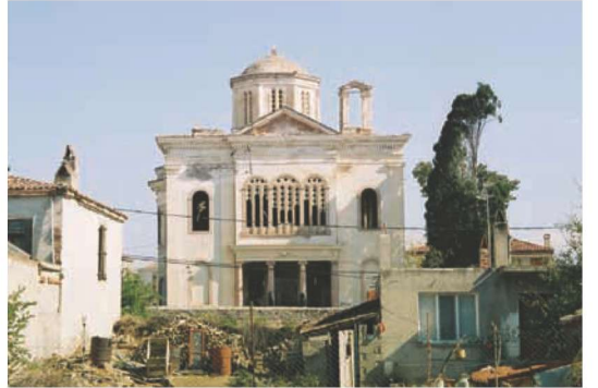
Res. 4. Taksiyarhis Kilisesinin (env. no: J17.B12.171) giriş cephesinden görünümü, 2004 yılı.