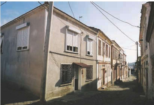
Res. 14. Hayat Caddesi, Cunda'nın izgara planlı düzenlemeye uyan tipik sokaklarından biri.