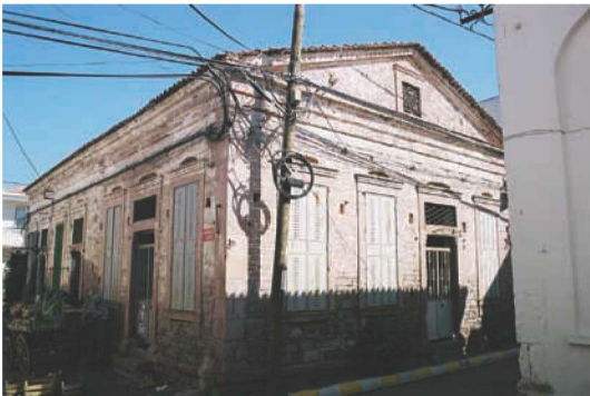
Res. 7. Sahildeki ticari merkezde yer alan bir dükkan (2005 yılı çalışma alanı sınırları dışında).