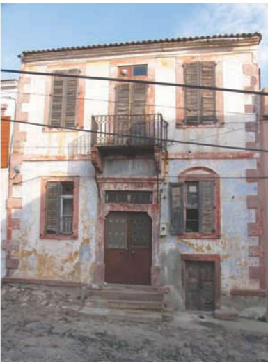
Res. 21. Genellikle giriş kapısının üzerinde yer alan balkonlar, kapıların görkemini bir üst kata taşıyan yapı elemanlarıdır. Hüseynin Çelikkaya Evi (env. no. J17.B12.180).