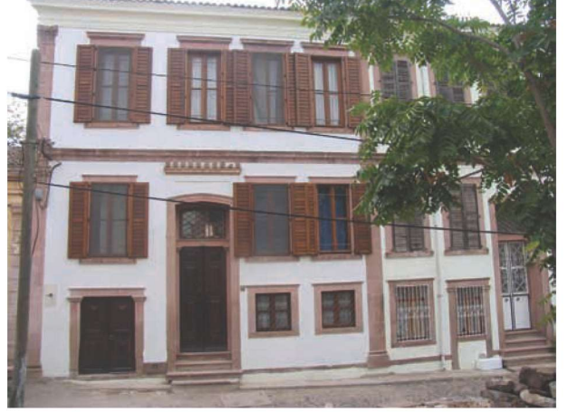
Res. 17. Cunda'da, kendi içinde asimetrik karakter taşıyan bir ev cephesinin bazen bitişiğindeki evin cephesiyle tamamen aynı biçimde olduğu örneklerden biri: Cumhuriyet Caddesi no. 30 (env. no: J17.B12.240).