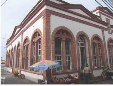
Res. 9. Sahilboyu Caddesi üzerinde bulunan ünlü Taş Kahve (env. no: J17.B12.115).