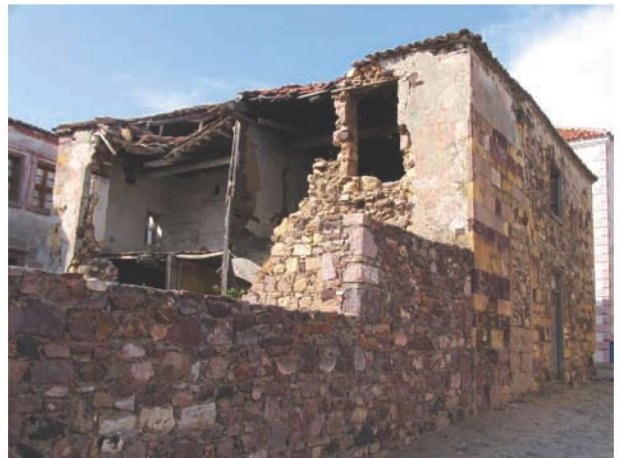
Res. 34. Orta Sokak no. 3 - Halk Caddesi 2. Sokak no. 2 (env. no: J17.B12.299). Cunda evlerinin taş duvarlarında yapı malzemesi olarak siyah renkli Cunda Adası taşı ile birlikte sarı renkli Soğan (Lale) Adası taşının da kullanıldığı görülmektedir.