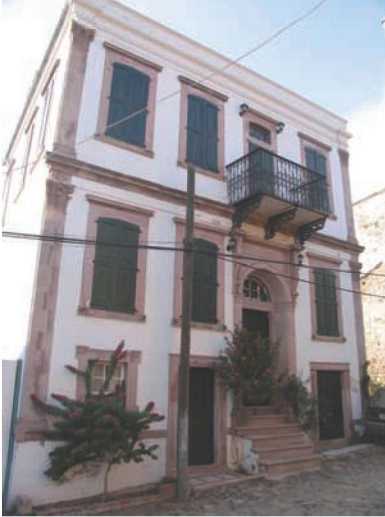
Res. 18. Anıtsal giriş kapısı, sokağa taşan merdivenler ve mütevazı "mağaza" kapısı: Cumhuriyet Cad. no. 57 (env. no: J17.B12.263).