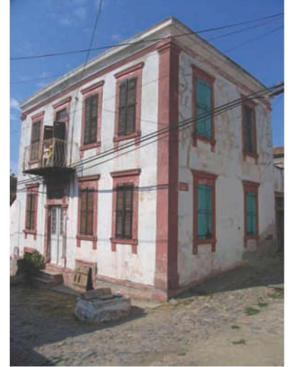
Res. 20. Cunda sokaklarında kuyulara rastlanır; Şadiye-Halil Çakmak Evi, Cumhuriyet Caddesi no. 45 (env. no: J17.B12.257).