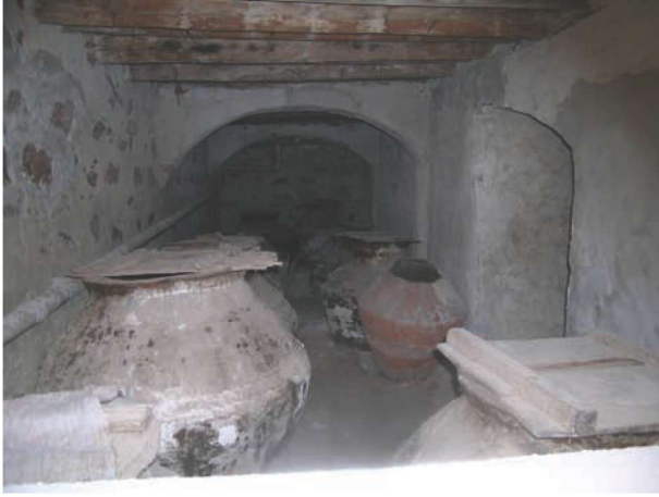
Res. 25. Cunda evlerinin "mağaza" adı verilen zemin katlarında, depolama mekânları, mutfak, çamaşır yıkama mahalleri, sarniç veya kuyu yer alır. Ali Kesebir Evi, Halk Caddesi no. 24 (env. no: J17.B12.220).