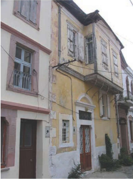
Res. 31. Ahşap çıkmalı Sakize Sevim Evi (env. no: J17.B12.234). Cunda'da çok az sayıdaki evin oda çıkmaları, dolayısıyla üst kat seviyesinde sokağa bakan duvarları ahşap çatıklı olarak yapılmıştır.