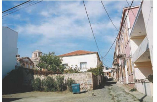
Res. 6. Cunda'nın, bitişik düzenli kâgir evlerin sıralandığı tipik sokaklarından biri Hayat Caddesi, Mithat Paşa Mahallesi.