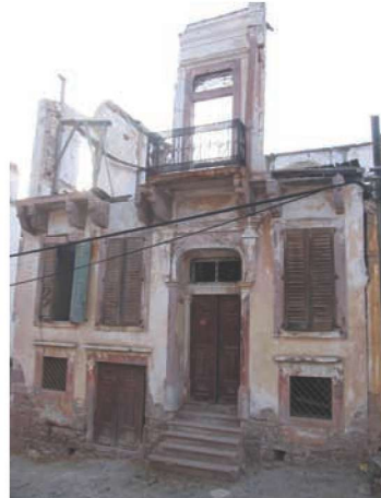
Res. 28. Nurhayat - Müjdat Soylu Evi Evlerin kapı ve pencere sövelerinde ve balkon çıkmalarını taşıyan taş konsollarında Sarımsak taşı kullanılmıştır.