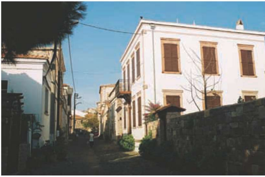
Res. 13. Bitişik düzenli, 2 ya da 3 katlı, pembe renkli Sarımsak taşı söveli tipik Cunda evlerinin bulunduğu Selamet Caddesi.