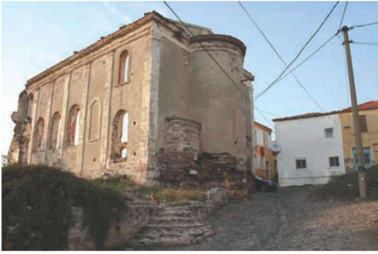
Res. 3. Yalnız beden duvarları ayakta kalabilen Panagia Kilisesinin güney ve doğu cephelerinin görünümü, Aşıklar Tepesi.