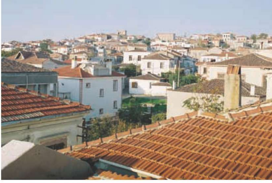
Res. 1. Kentin en yüksek noktası Aşıklar Tepesi ve çevresi, 2004 yılı.