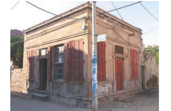
Res. 8. Ayvalık Caddesi no. 14, Ali Onay'ın dükkanı (env. no: J17.B12.113).