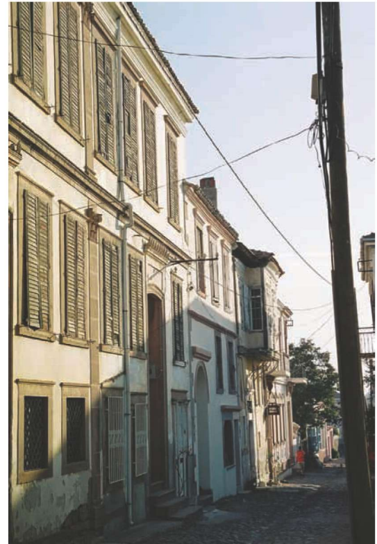
Res. 15. Cunda'nın geleneksel kâgir evlerinin en belirgin özelliklerinden biri de niş içine alınmış anıtsal kapılardır, Cumhuriyet Caddesi.