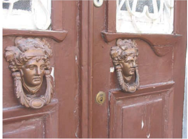
Res. 30. Ali Onay Evi (env. no: J17.B12.306). Evlerin kapıları, çoğu zaman mitolojiden esinlenmiş tokmaklarla süslenmiştir.