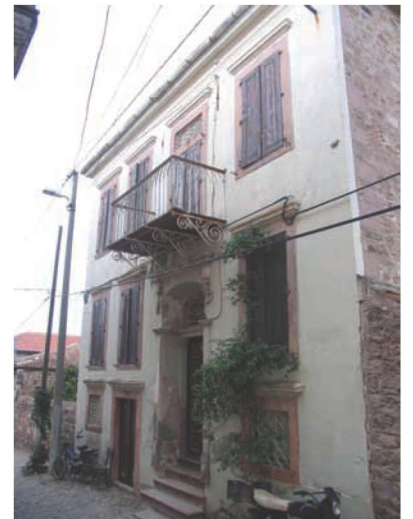
Res. 22. Makbule Vardarsuyu Evi (env. no. J17.B12.221). Balkonların çıkmaları, genellikle metal desteklere ya da taş konsollara taşınmıştır.