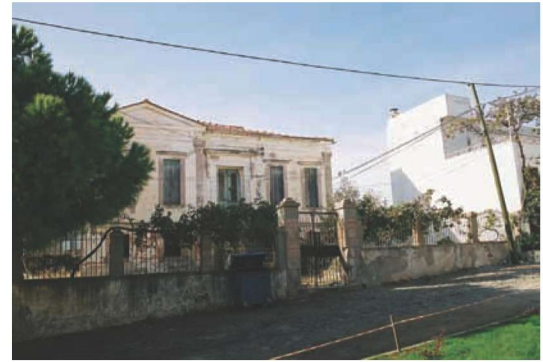
Res. 12. Gayret Sokağı no. 30 (env. no: J17.B12.301) Cunda'da, ayrık düzende inşa edilmiş çok az sayıdaki evden biri.