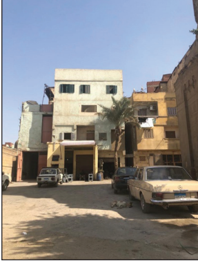
Katlı Binaya Dönüştürülen Mezar Evler