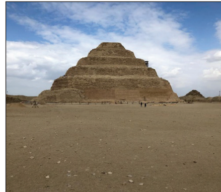
Sakkara'da Zoser Piramiti