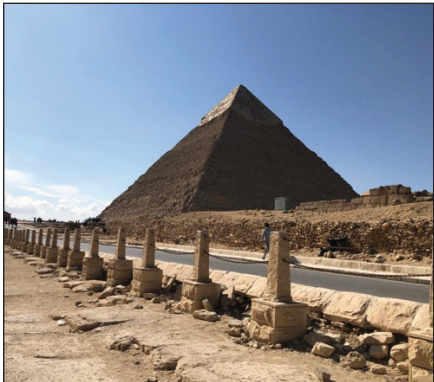
Giza'da Hafra Piramiti