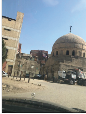
Mezar Evlere Ait Bir Cami