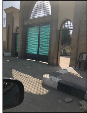
Mezar Ev Girişi