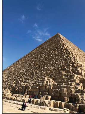
Giza'da Kufu Piramiti