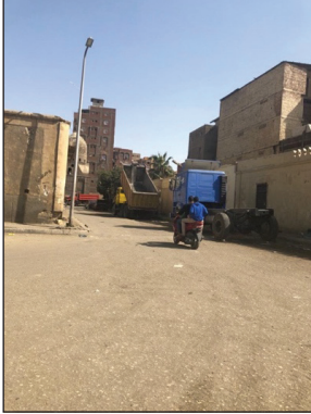
Mezar Evler Bölgesinden Bir Sokak