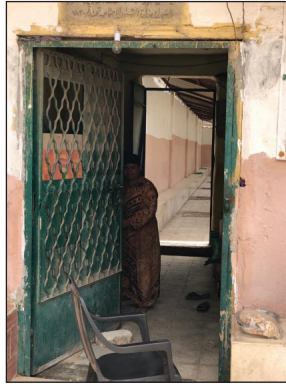
Mezar Ev Girişi