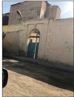
Bir Mezar Evin Dıştan Görünüşü