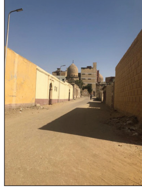
Mezar Evler Bölgesinden Bir Sokak