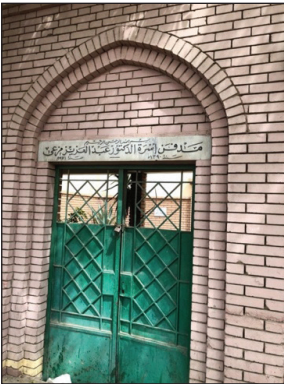
Mezar Ev Kapısı Üzerinde Ait Olduğu Ailenin İsmi