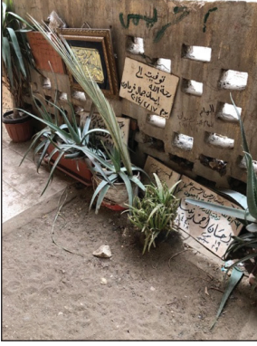
Alttaki Mezar Odalarda Bulunanların İsimleri

Araştırma ve Gözlem Alanlarında Çekmiş Olduğum Resimler.