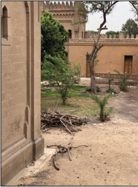
Mezar Ev Avlusu