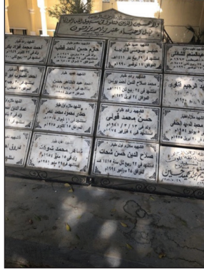
Alttaki Mezar Odalarda Bulunanların İsimleri