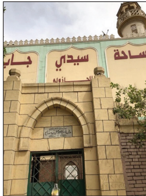
Mezar Ev Kapısı Üzerinde Ait Olduğu Ailenin İsmi