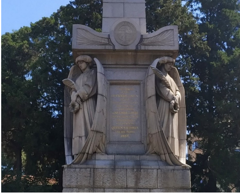
Görsel 3: Kırım Savaş Anıtı Heykelleri

Anıtın açılışı İngiltere'de, Crystal Palace'ta, Kraliçe Viktorya ve Prens Albert ile birlikte üst düzey temsilcilerin katıldığı büyük bir törenle yapılmış ve anıt bir süre burada sergilenmiştir. Crystal Palace'ta anıtın tepesine yerleştirildiği görülen hacin İstanbul'da sökülmiş olması dikkat çekicidir. Osmanlıların anıtlara karşı ihtiyatlı tutumunun hacin kaldırılmasına neden olduğu akla yatkın görünmektedir. 22