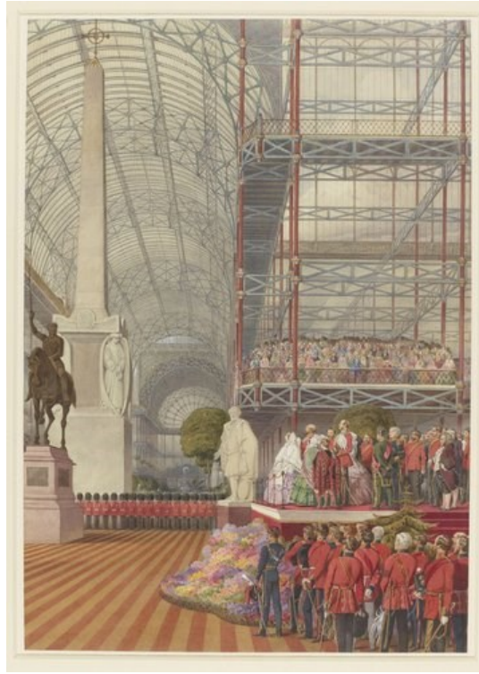
Görsel 4: Kırım Savaş Anıtı'nın Crystal Palace'ta Sergilenmesi ve Açılış Töreni (Sir John Tenniel, 1856)

Royal Collection Trust, https://www.rct.uk/collection/916788/the-inauguration-of-the-scutari-monument-and-the-peace-trophy-at-the-crystal (Erişim Tarihi: 04.11.2020).