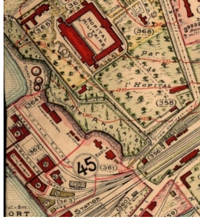
Görsel 1: Pervititch Haritalarında Haydarpaşa İngiliz Mezarlığı