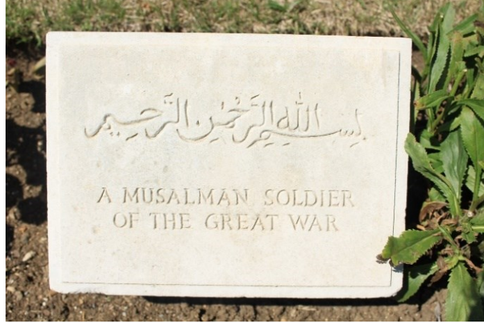
Görsel 6: 1. Dünya Savaşı'nda İngiliz cephesinde savaşan Müslüman askere ait mezar taşı (Haydarpaşa)

İngiliz İmparatorluğu adına ölen Hintli askerlerin varlığı, gerçek bir düşmanlık beslememelerine rağmen, Batı coğrafyası yerine Müslümanların Halifesi kabul edilen Osmanlı Sultanına karşı hangi nedenlerle savaştıklarını sorgulatmaktadır. Kant, bu durumun arkasında yatan duygu ve gerekçelerin açıklanmasında önem arzeden, özellikle sıradan askerlere ait anı, mektup v.b. belgelere günümüzde ulaşmanın kolay olmadığını belirtmektedir. Öte yandan, 1. Dünya Savaşı'nda aynı cephede savaşan, aralarında Türklerle birlikte, Rum ve Ermenilerin de bulunduğu Osmanlı savaş esirlerinin, kilometrelerce uzaktaki Hint çalışma kamplarında (tütün tarlaları, demiryolları v.s.) yaşadıkları deneyim gözden kaçabilmektedir. 29