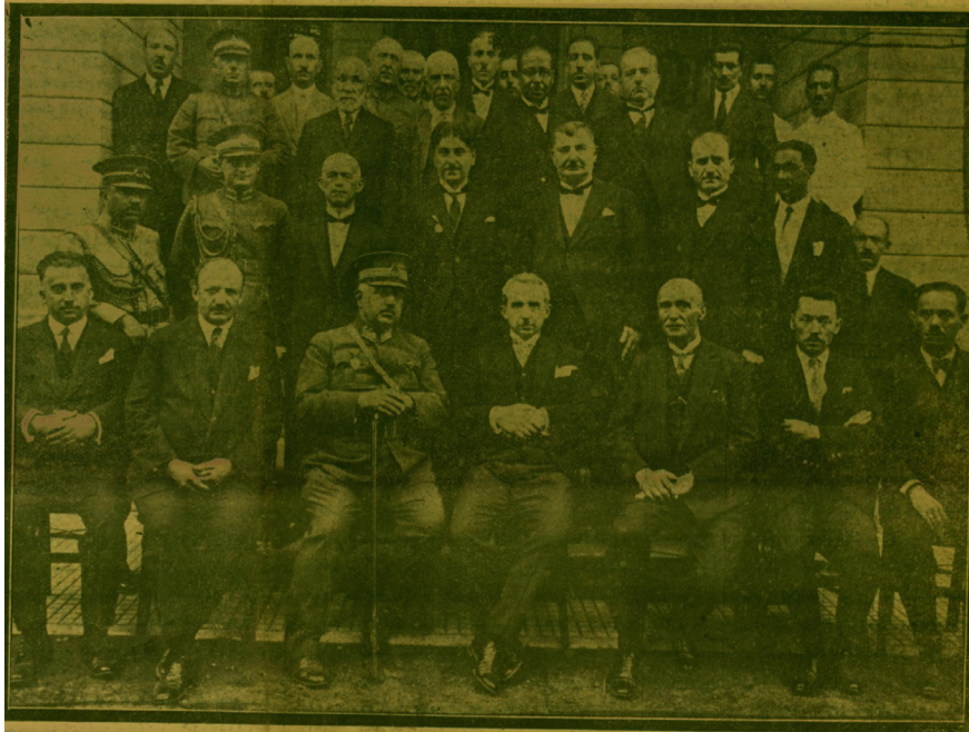
Başvekil İsmet Paşa Hazretlerinin, evvelki gün Bursa Halk Fırkası Merkezi ziyaretleri esnasında alınan grup resim, Cumhuriyet , 16 Temmuz 1927, s.1.