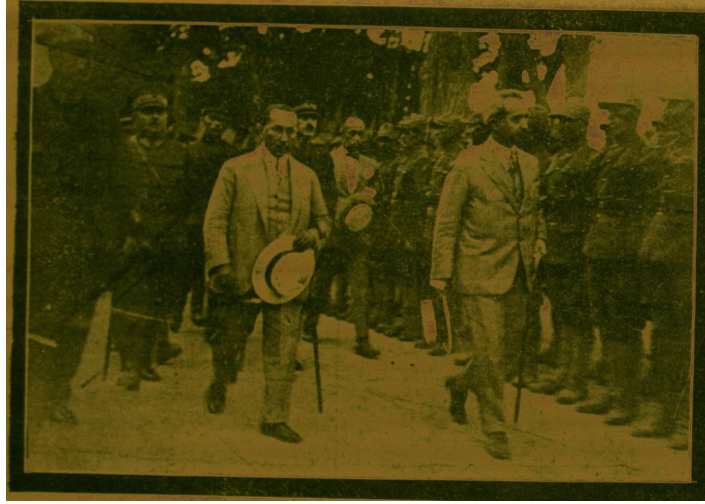
İsmet Paşa'nın Bursa'da karşılanması. "Başvekilimiz İsmet Paşa Hazretleri Bursa'da...", Cumhuriyet , 10 Temmuz 1927, s.1.