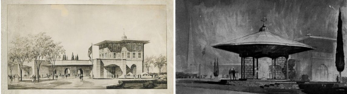
Şekil 4. 1939 New York Fuarı için tasarlanan Türk sitesi ve Türk Çeşmesi (Eldem, 1939a, s. 155) (URL-4).

1939 New York Fuarı için Sedad Hakkı Eldem iki yapı tasarlar. Bunlardan biri Türk sitesi ve devlet pavyonu, diğeri ise Türk çeşmesidir (Şekil 4). Site tek katlıdır. Cephenin sağında iki katlı bölüm bulunmaktadır. Eldem, hünkâr köşklerine benzeyen iki katlı bölümü sergi binasının kalesi olarak nitelendirir. Altın yaldızlı saçaklar, alçı pencereler ve kapaklar, çini işçiliği ile eski Türk evi göndermelerinin yoğun kullanıldığı söylenebilir (Eldem, 1939a, s. 153). Merkezde bulunan havuzu bir galeri çevreler ve mekânları birbirine bağlar. Eldem 1939 yılında Arkitekt dergisi için yazdığı, pavyonu anlattığı yazısında, yapının milli mimari karakterinin dikkatleri çektiğini, " Türk sitesi binası ve çeşme daha inşası esnasında şöhret bulmağa başlamış, binanın kendisine hâs milli karakteri her milletin paviyonundan fazla nazarı dikkati celbetmiştir. " sözleri ile vurgular (Eldem, 1939a, s.153).