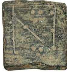
Env. No: 2010-220 (Resim 2)