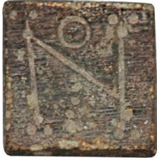
Env. No: 2010-227 (Resim 5)