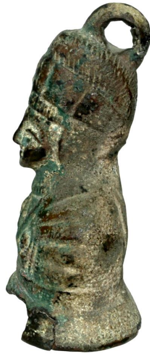
Env. No: 1.1.57 (Resim 23b)