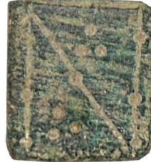
Env. No: 2010-139 (Resim 7)