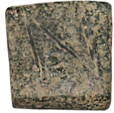
Env. No: 2010-223 (Resim 4)