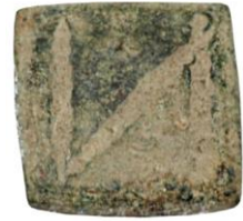
Env. No: 2010-222 (Resim 8)