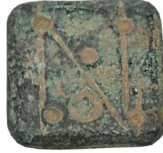
Env. No: 2010-226 (Resim 3)