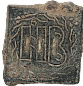
Env. No: 2010-140 (Resim 19)