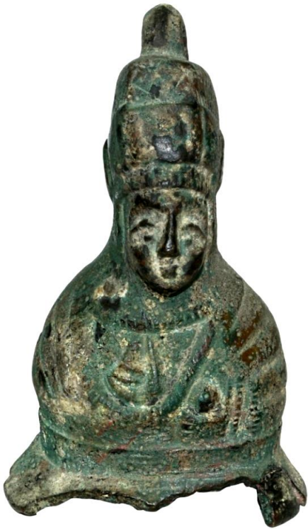
Env. No: 1.1.57 (Resim 23a)