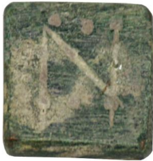
Env. No: 2010-133 (Resim 9)