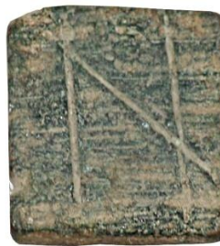
Env. No: 2010-219 (Resim 11)