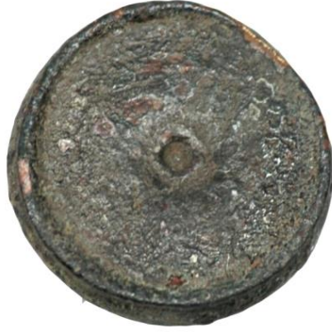
Env. No: 2010-231 (Resim 21b)