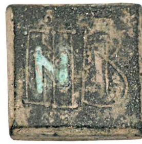
Env. No: 2010-230 (Resim 20)