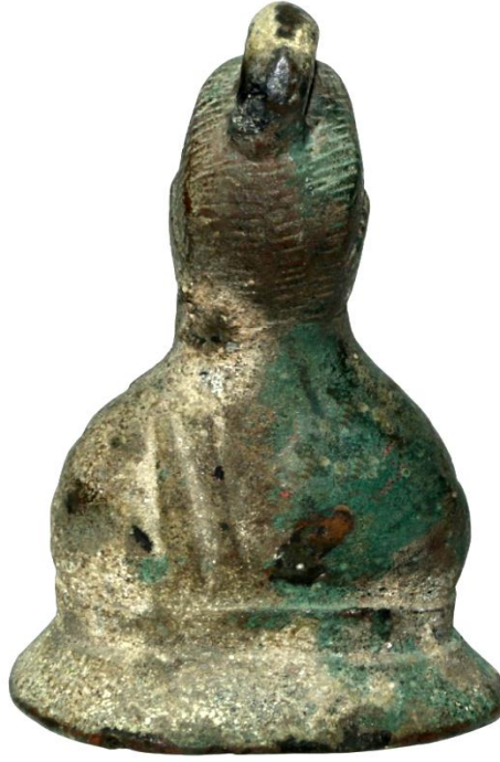
Env. No: 1.1.57 (Resim 23c)