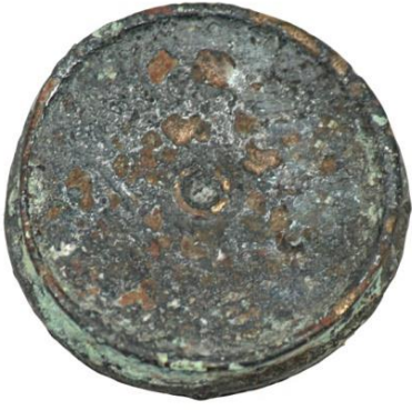
Env. No: 2010-231 (Resim 21a)