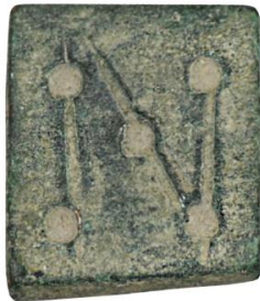
Env. No: 2010-137 (Resim 10)