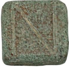
Env. No: 2010-225 (Resim 1)