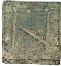
Env. No: 2010-224 (Resim 6)