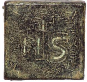
Env. No: 2014-11 (Resim 22)