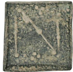
Env. No: 2010-135 (Resim 12)