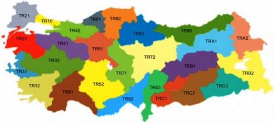
Şekil 1 Düzey 2 Bölgeleri

Düzey II bölgelemeye göre oluşan 26 Düzey 2 Bölgesinde (Şekil 1) bu bölgelerde potansiyelleri kullanarak kalkınmayı hızlandıracak kalkınma ajanslarının kurulmasına 5449 sayılı Kanun ile karar verilmiştir. Başlangıçta 2006 yılında iki pilot ajansla (Çukurova ve İzmir) yola çıkılan uygulamada 2008 yılında her bölge için ajansların kurulması aşaması kanunen tamamlanmış ve 2010 yılında bütün bölgelerde kalkınma ajansları aktif olarak çalışmaya başlamıştır.