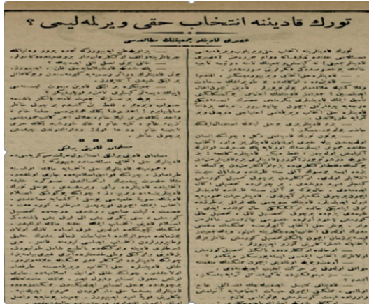
(Türk Kadınına İntihap Hakkı Verilmeli mi?“, Vakit , 1 Kasım 1919, s.2.)