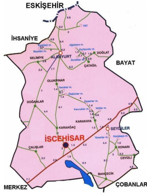
Resim 1: Afyonkarahisar İscehisar İlçesi Haritası