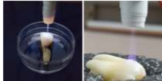
Şekil 1. Solda argon plazma ve sağda helyum plazma

Maddenin dördüncü hali olarak bilinen plazma basit olarak iyonize gaz olarak tanımlanır. Laboratuvar ortamında gaz deşarjıyla elde edilebilen plazmalar farklı yüzey işlemlerinde kullanılabilirler. Elektronlar, yüklü, nötr, uyarılmış parçacıklar ve fotonlar içeren plazmalar farklı biçimde sınıflandırılabilirler. Plazma içerisindeki elektronlar yüksek sıcaklıklara sahipken gaz sıcaklığı oda sıcaklığına yakın olan plazmalar soğuk plazmalar olarak adlandırılır. Bu özellikleri tıp alanında plazmaların kan pıhtılaşması, yara iyileşmesi ve prokaryot/ökaryot hücreler üzerinde uygulanabilme avantajı sunmuş ve plazma tıbbi denilen yeni bir alanın doğmasına öncülük etmiştir [1]. Atmosferik basınç plazmalar da soğuk plazmalardır (Şekil 1).