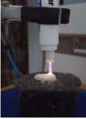
Şekil 2. Soğuk plazma ve diş beyazlatma uygulaması

Günümüz diş hekimliği uygulamaları hastaların artan ilgisiyle beraber giderek yaygınlaşmaktadır. Fakat bu uygulamaların sonucunda dokular zarar görebilmekte ve istenmeyen olumsuzluklar yaşanabilmektedir. Örneğin diş hekimliğinde diş beyazlatmada kullanılan yüksek yoğunluklu hidrojen peroksitlerin dişleri aşındırarak dişlerde demineralizasyona ve diş hassasiyetine sebep olması ve diş beyazlatma işlemini hızlandıran yüksek yoğunluklu lambaların diş pulpasında kalıcı termal hasara sebep olması karşılaşılan zorluklardan bazılarıdır. Ayrıca oral ortamdaki patojenlerin sterilizasyonu, bakterilerin sebep olduğu biyofilmlerle mücadele ve kök kanal tedavisinde sterilizasyonda karşılaşılan sorunlar güncelliğini halen korumaktadır. Son zamanlarda diş beyazlatma ve bakteriyel enfeksiyonların tedavisinde yeni gelişen termal olmayan plazma teknolojisi kullanılmaya başlanmıştır (Şekil 2).