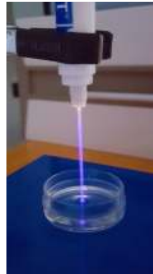
Şekil 5. PAW uygulaması

Özellikle hava ile temas halinde olan plazmaların havadaki oksijenle oluşturduğu etkileşim bakteriyel inaktivasyonu arttırmaktadır [65]. Bunun yanında plazma cihaz tasarımlarının ağız içinde rahatlıkla kullanılabilir olması ve