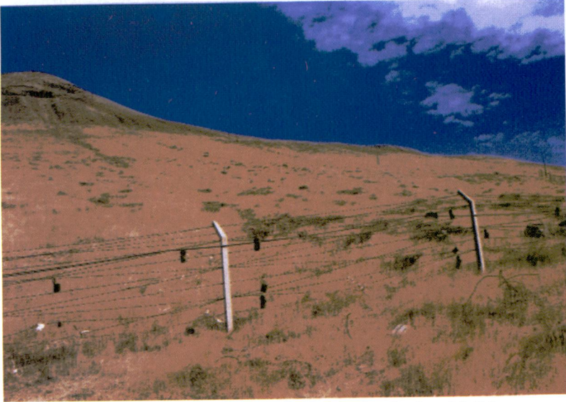
Resim 2 - Kot Tepe 2001, telefon direklerinin güneybatıdan görünüşü.