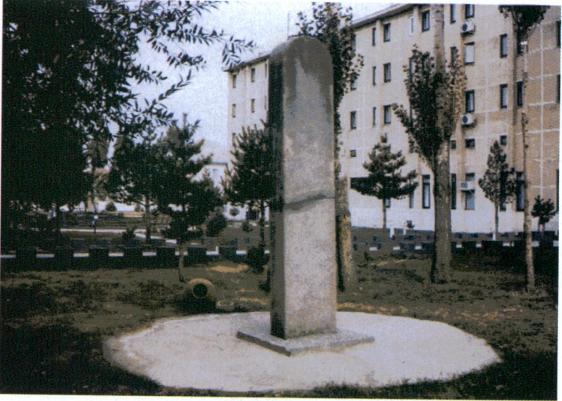
Resim 4 - Stelin arkadan görünüşü.