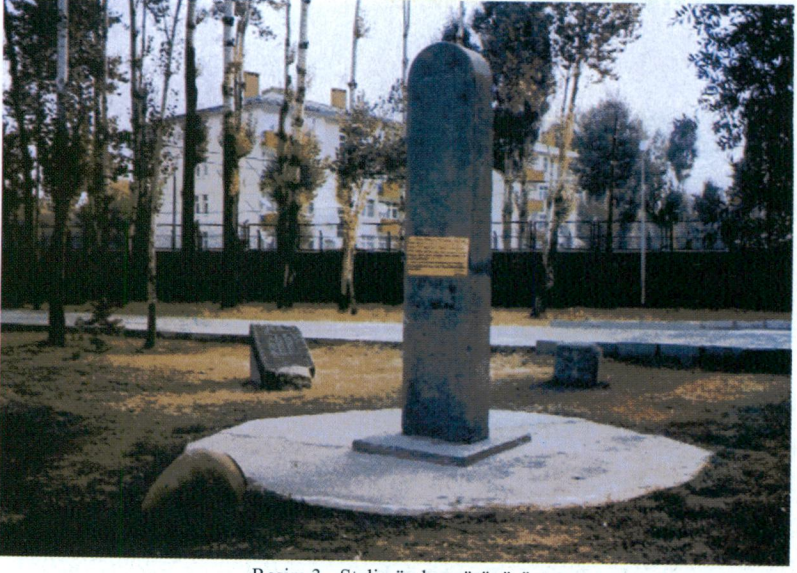
Resim 3 - Stelin önden görünüşü.