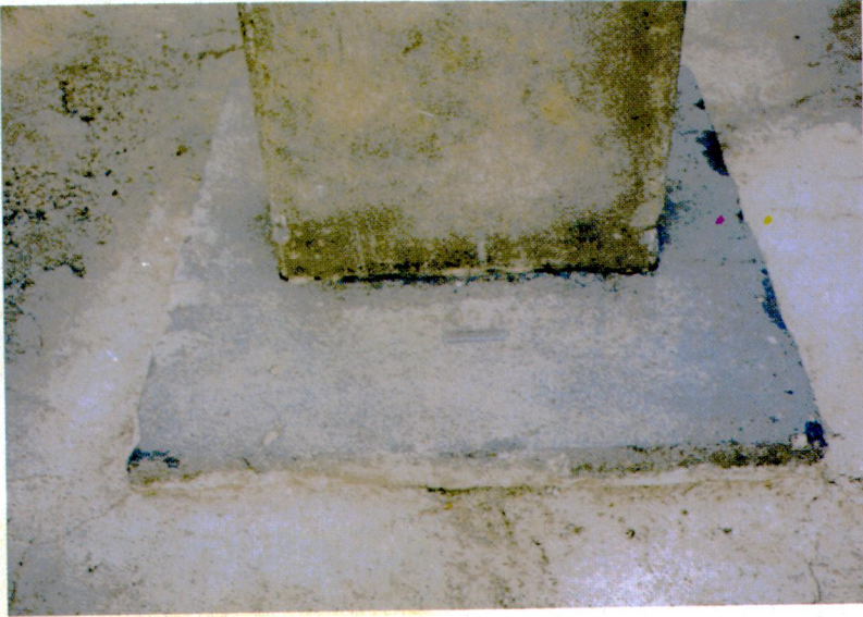
Resim 6 - Kaidenin arka kısmındaki kabartma.