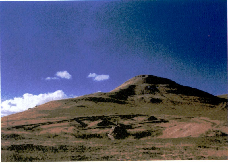
Resim 1 - Kot Tepe 2001, doğudan görünüşü.