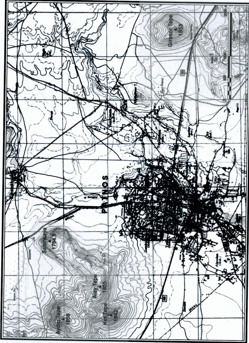
Harita 2 - Patnos ilçe merkezi ve yakın çevresinin topografik haritası.