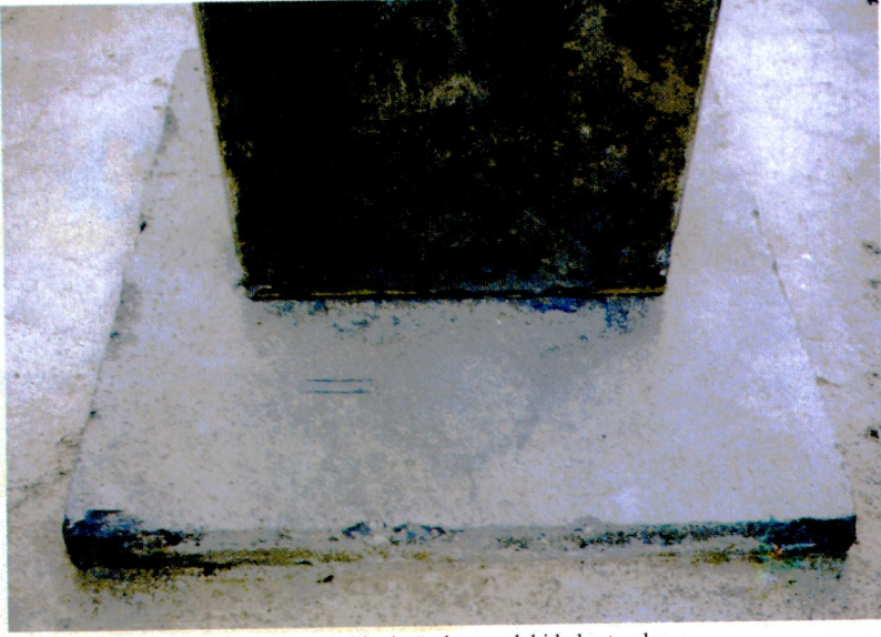
Resim 5 - Kaidenin ön kısmındaki kabartmalar.