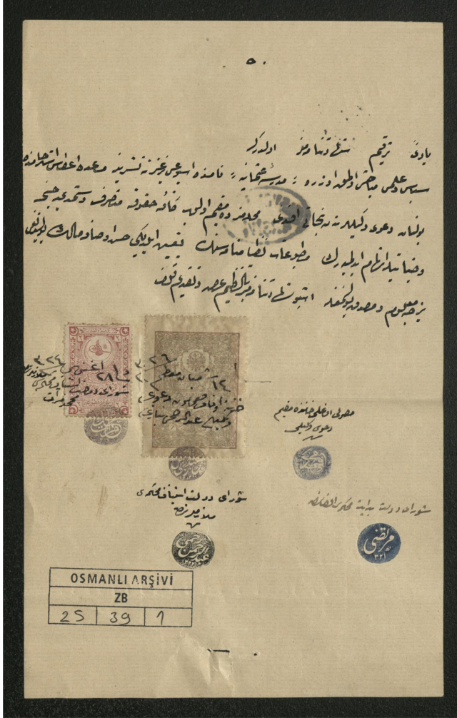
Ek-1: Mustafa Necati Bey'in Medrese-i Osmani adlı gazete çıkartma ruhsatı.