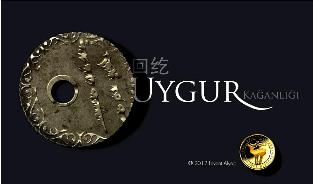
Levent ALYAP'ın tasarımlarından: "Sikke Denemeleri Serisinden (Uygur)"

Yaptığım en son çalışmalar sikke denemelerimin devamı: Eşsiz motiflerimizin belki de karşımıza çıkmayan nesnelere üzerindeki görünümünü tasarlamayı çok seviyorum.