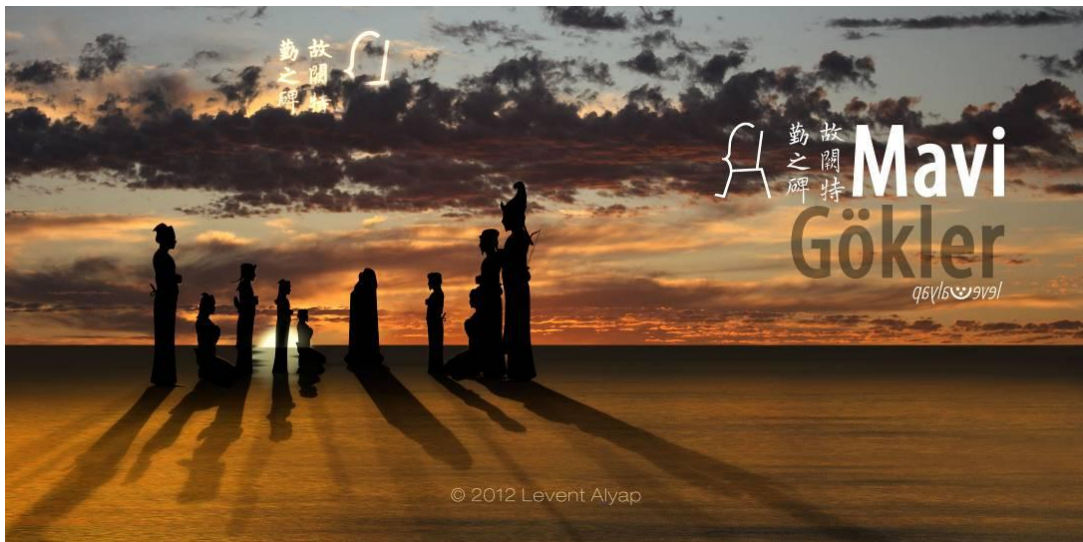
Levent ALYAP'ın tasarımlarından: “Mavi Gökler I”