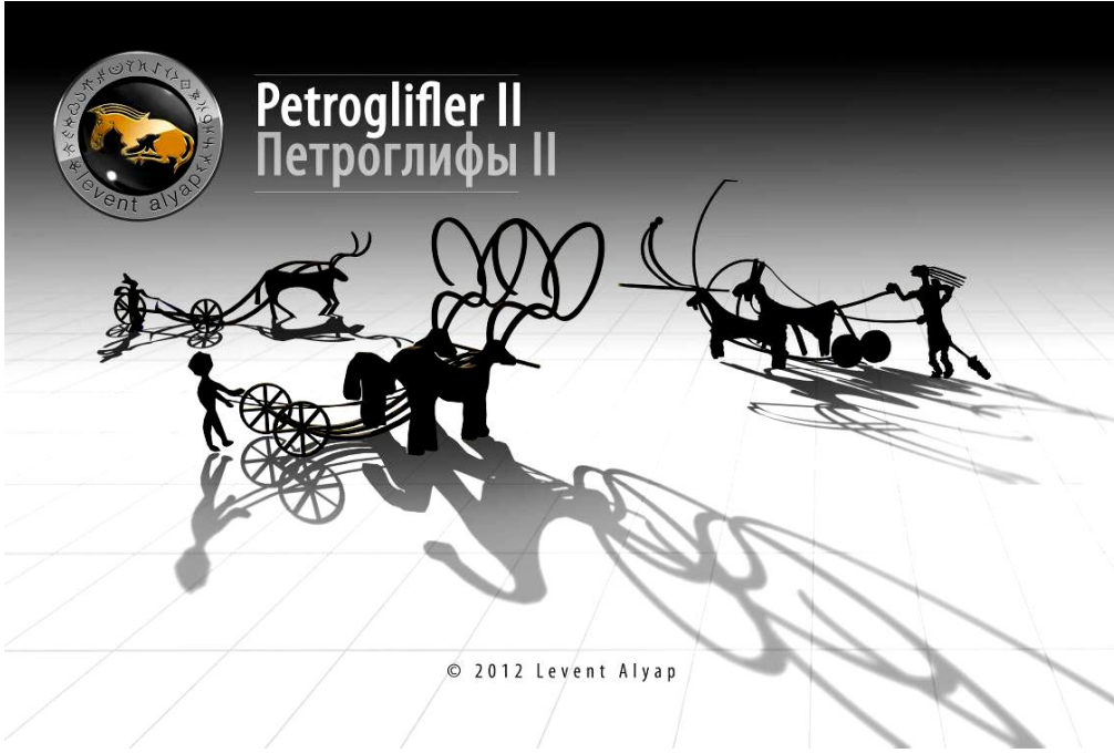
Levent ALYAP'ın tasarımlarından: "PetrogliflerII"

gerçekleştirmeye çalıştım. Çalışmalarında belgesel niteliği taşıması açısından dikkati çekecek puntolarda yazılar yazmayı seviyorum. Buna tasarıma dolaysız bir gönderme diyebilir miyiz?