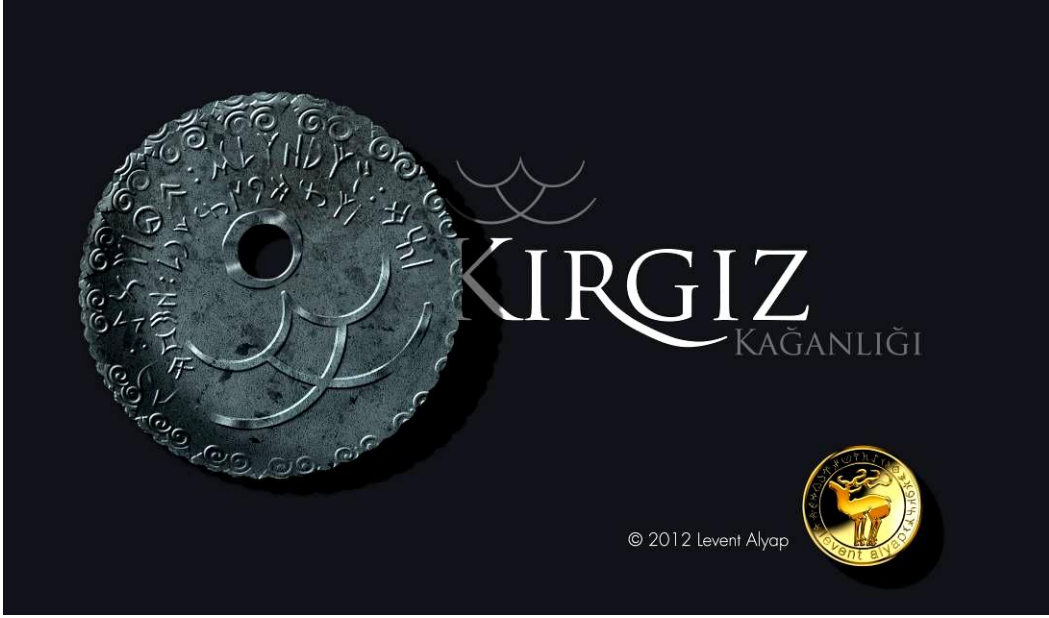
Levent ALYAP'ın tasarımlarından: "Sikke Denemeleri Serisinden (Kırgız)"

yapabiliriz gibi sorular ve cevaplarla / buna cevabını bulmaya çalışan öğretim faktörü de eklenince) araştırmaya ve çalışmaya sevk ettiğimi anlayınca o zaman çalışmalarımı olumlu bir etki ile sonuçlandırdığıma inanıyorum.