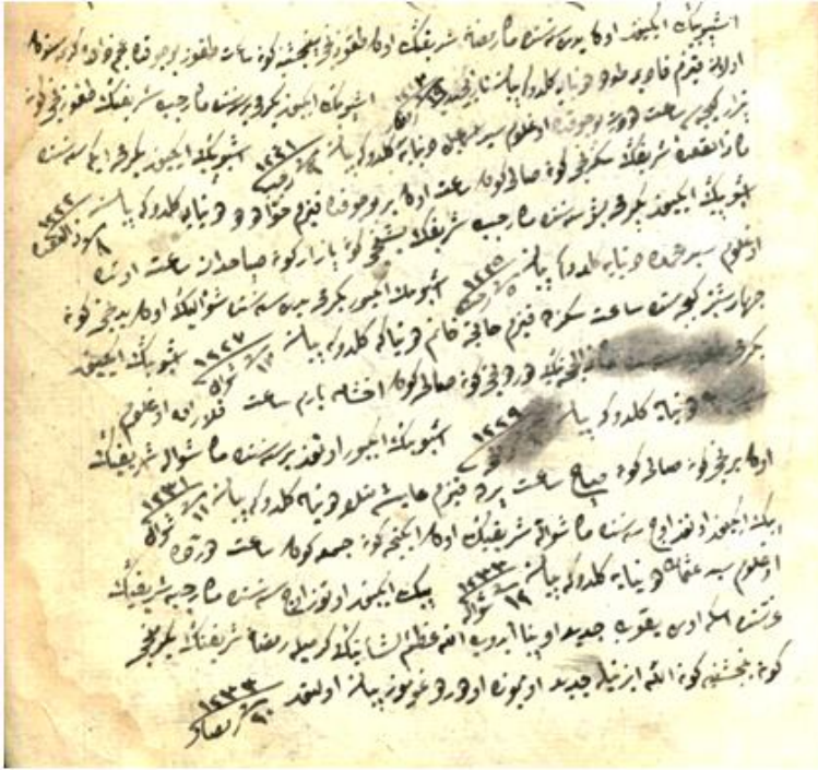
Figür 2: Süleyman'ın evlatlarının doğum günlerini kaydettiği kısım. Görüldüğü gibi buradaki el yazısı ile nüshanın geri kalanındaki el yazısı aynıdır.

şeklinde bir kez daha geçmektedir. Görüldüğü gibi her iki notta Seyyid Süleyman Yazıcı ismi geçiyor olsa da bu iki notta karışıklık yaratan husus ifadelerin üçüncü tekil şahıs şeklinde olmasıdır. Bu açıdan notları ekleyen Seyyid Süleyman Yazıcı isimli kişi olup olmadığından emin olamayabiliriz. Fakat nüshadaki diğer notlarda üçüncü tekil şahıs ifadelerinin kaybolduğunu görürüz. Örneğin, nüshadaki diğer notlar şu şekildedir: “...oğlum Seyyid Süleyman dünyaya geldi.” 17 Bu durumda nüshadaki bazı notlar birinci tekil şahıs bazıları ise üçüncü tekil şahıs halindeyken haklı olarak kendimize notların kime ait olduğu sorusunu sorabiliriz. İşte tam bu noktada nüshadaki notlarda kullanılan el yazısına bakmak yararlı olabilir. Bu çerçevede nüshadaki “oğlum” ifadelerinin geçtiği nottaki el yazısı ile nüshadaki diğer el yazılarını karşılaştırıldığımızda fark ederiz ki bu el yazıları birbirinin aynıdır (bkz. Figür 1, 2 ve 3). Başka bir ifadeyle, oğluna ait olan iki not hariç 18 , nüshadaki tüm notlar Seyyid Süleyman Yazıcı Sinobî’ye aittir.