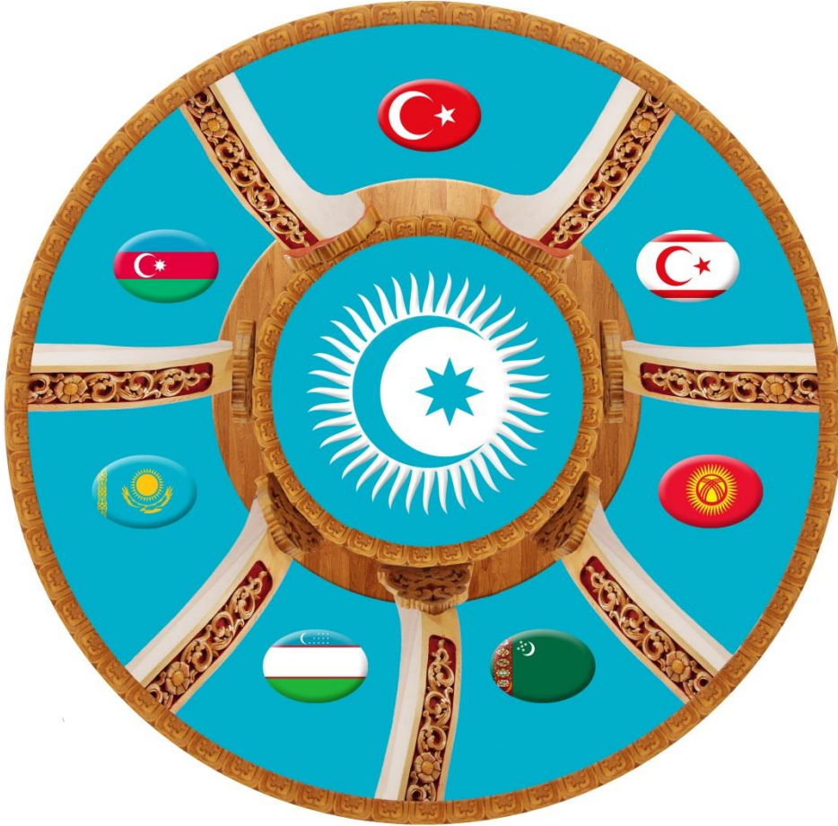
Foto 3: “Türk Dünyası Vatandaşlığı” için Cengiz ALYILMAZ ve Semra ALYILMAZ’ın danışmanlığında Onur ER tarafından hazırlanmış bir logonun görüntüsü 7

benzerlikleri en az Avrupalılarınki kadar eski ve köklüdür. Asyalı milletlerin farklı etnik yapıya ve inanç sistemine mensup oldukları bu yüzden de bir araya gelmelerinin, ortak paydada buluşmalarının zor olacağı muhtemeldir. Ancak bütün dinlerin temelde “birlik” olmayı önerdiği unutulmamalıdır. 6