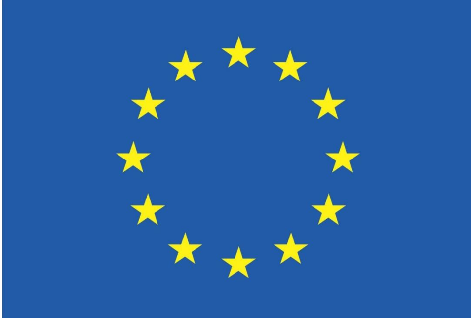
Foto 1: Avrupa Birliği'nin logosunu yansıtan görüntü

Bugün Avrupa Birliği içinde yer alan ülkelerin birçoğu yakın tarihe kadar birbirleriyle savaşmışlardır. Çünkü Avrupa Birliği ülkelerinin (birçoğunun dini aynı olsa da) onların da birleşen yanları kadar ayırışan yanları; aralarında çıkar çekişmeleri vardır. Ancak Avrupalılar geçmişten (aralarında yaşanan savaşıardan) ders çıkarmayı bilmiş; birleşen yanlarını ön planda tutmuş; Avrupalılık paydasında buluşarak “Avrupa Birliği”ni kurmuşlardır.