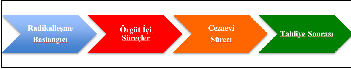
Şekil-2 Radikalleşmeden Dönüş ve Terörist Rehabilitasyonu Süreci